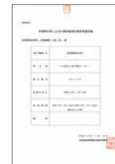
茨城県仕事と生活の調和推進計画