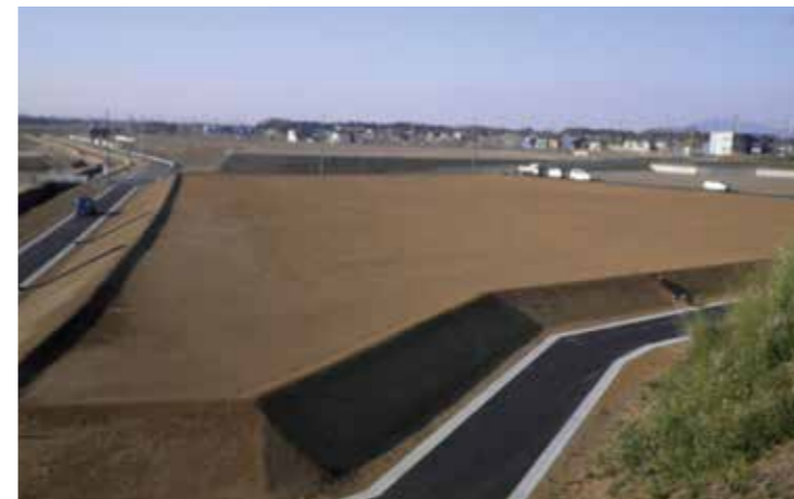
工事名：23国補街路 第23-16-162-0-005号 23国補公下 第23-09-090-0-008号 23国補公下 第23-09-090-0-009号 23県単地特 第23-16-098-0-012号 合併 宅地造成・道路改良舗装・下水道工事(337街区) 発注者：土浦土木事務所 完成日：H25.2.28