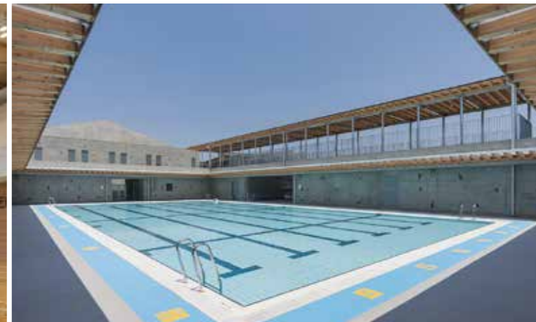
工事名：(仮称)つくばみらい市立陽光台小学校 屋内運動場・プール棟・外構等建設工事 (JV) 発注者：つくばみらい市 完成日：H27.5.29 概要：【屋内運動場】RC造/一部木造/一部S造/地上2階建/1,365.88㎡ 【プール】RC造/一部木造/一部S造/地上2階建/303.6㎡