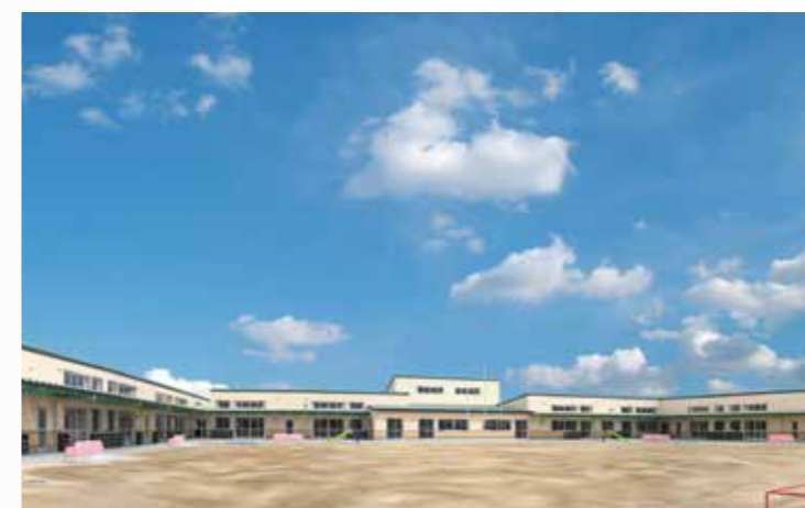
工事名：幼児施設建設整備工事 発注者：つくばみらい市 完成日：H23.3.28 概要：S造/平屋建/2,357㎡