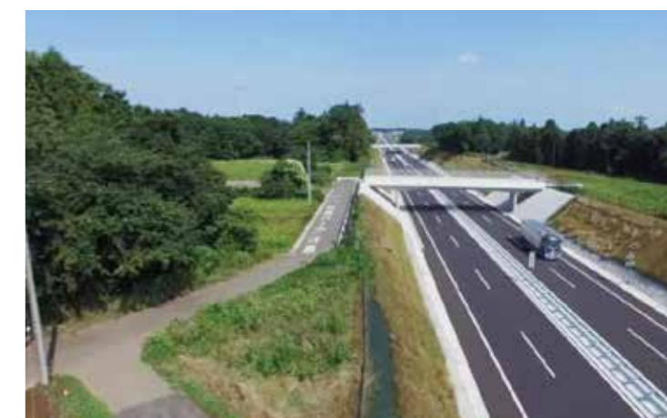
工事名：圏央道坂東常総改良その2工事 発注者：関東地方整備局 常総国道事務所 完成日：H28.7.29