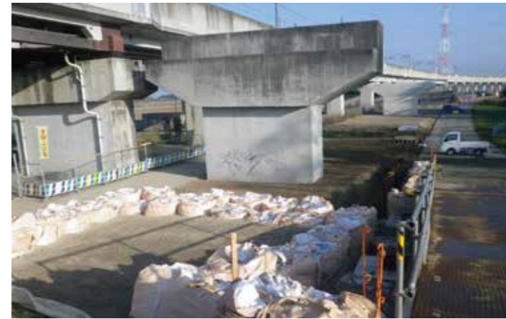
工事名：26国補地道 第26-03-180-0-002号 橋梁下部工事(その2) 発注者：土浦土木事務所 完成日：H28.1.27