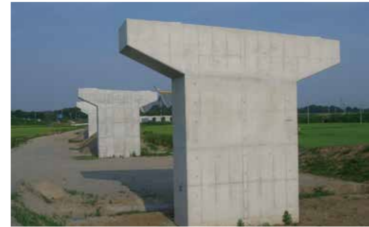
工事名：圏央道小貝川橋下部その1工事 発注者：関東地方整備局 常総国道事務所 完成日：H25.6.28