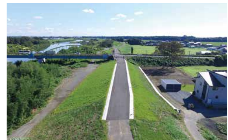
工事名：H29鬼怒川右岸大輪築堤工事 発注者：関東地方整備局 下館河川事務所 完成日：H30.9.21