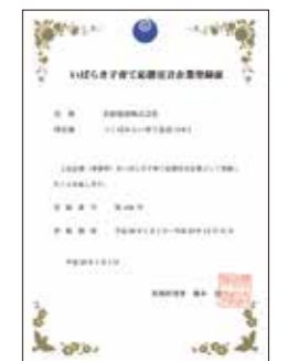
いばらき子育て応援宣言企業