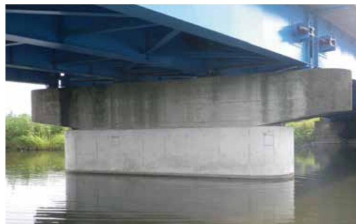
工事名：26国補地道 第26-04-194-0-001号 橋梁耐震補強工事(上岩崎橋) 発注者：土浦土木事務所 完成日：H27.7.31