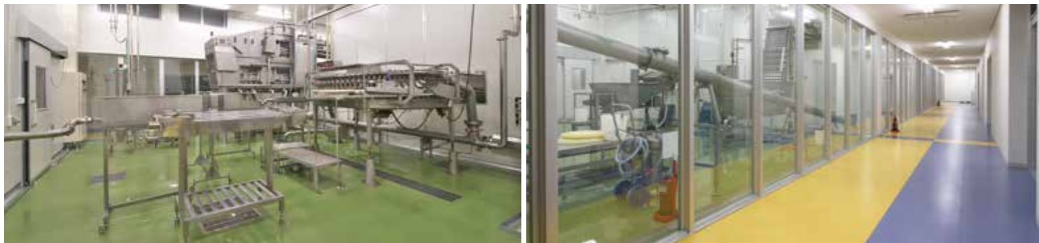
工事名：K様坂東液卵工場新築工事 完成日：H27.11.29 概要：S造/平屋建/1,049.1㎡