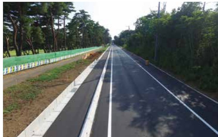
工事名：29国補地道 第29-03-707-0-002号 29新市づくり(住基) 第29-03-790-0-001号 合併 道路改良舗装工事(その1) 発注者：土浦土木事務所 完成日：H30.7.28