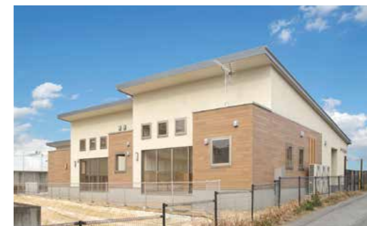
工事名：小絹小学校児童クラブ建設工事 発注者：つくばみらい市 完成日：H26.2.8 概要：S造/平屋建/358.16㎡