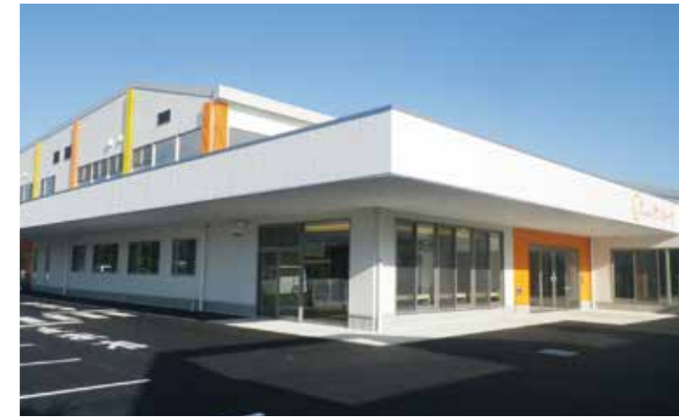
工事名：ライフサポート・サンルーナ新築工事 (JV) 完成日：H28.8.31 概要：S造/地上2階建/2,766㎡