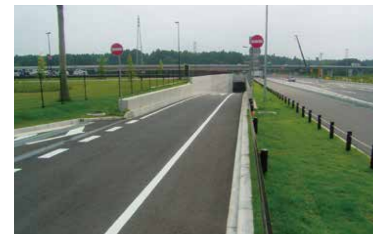
工事名：阿見まち交 第20-16-195-0-001号 町道6406号線 道路築造工事 (JV) 発注者：茨城県 完成日：H21.1.15