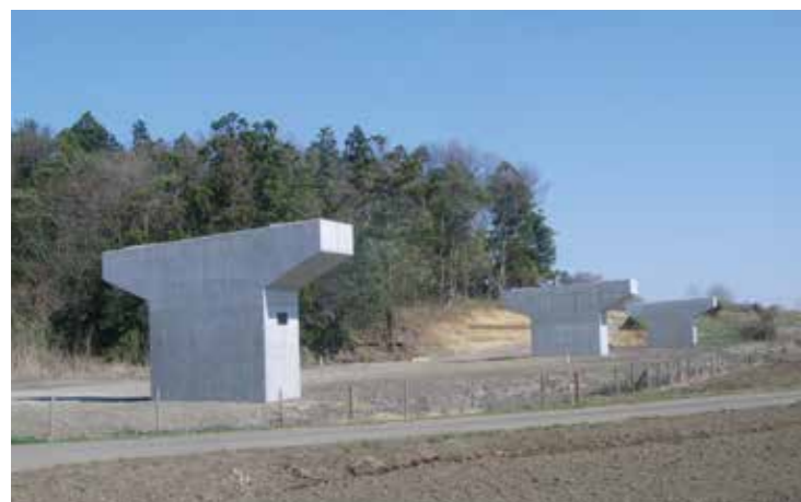
工事名：圏央道高須賀第1高架橋下部その2工事 発注者：関東地方整備局 常総国道事務所 完成日：H26.3.31