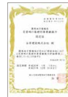
災害時の基礎的な事業継続力