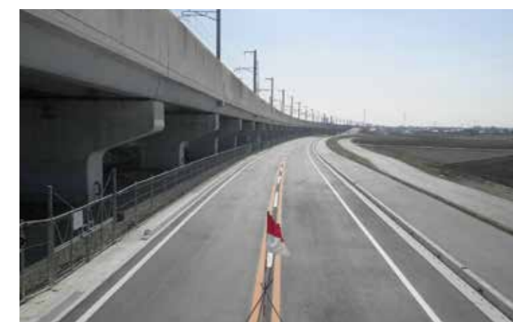
工事名：24国補地道 第24-03-180-0-002号 道路改良舗装工事 発注者：土浦土木事務所 完成日：H25.3.15