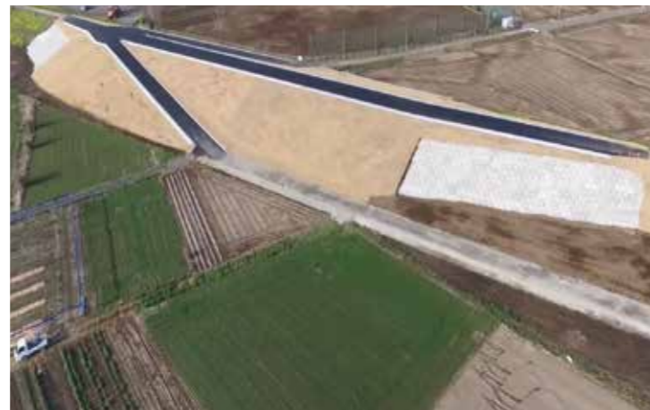
工事名：H27関本分中災害復旧工事 発注者：関東地方整備局 下館河川事務所 完成日：H29.3.31