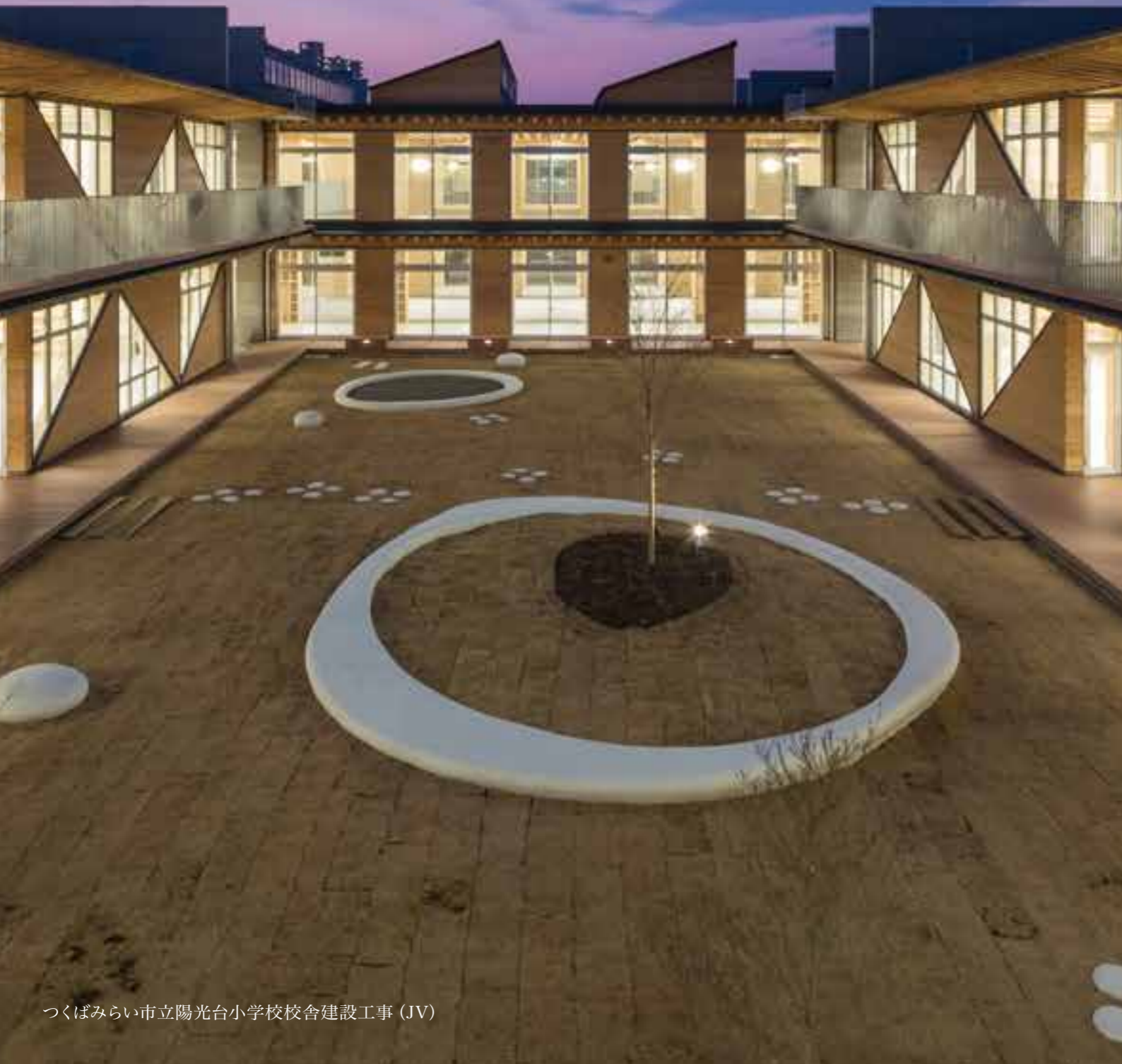
つくばみらい市立陽光台小学校校舎建設工事 (JV)

もっと便利に、もっと美しく、そして何より安全に。社会が成熟期を迎えたいま、人が建築に求めるものも、モノから心へと変化しています。ひとり一人のアメニティのために、私たちはいつでも街に暮らす人の視点で環境づくりに取り組んでいます。