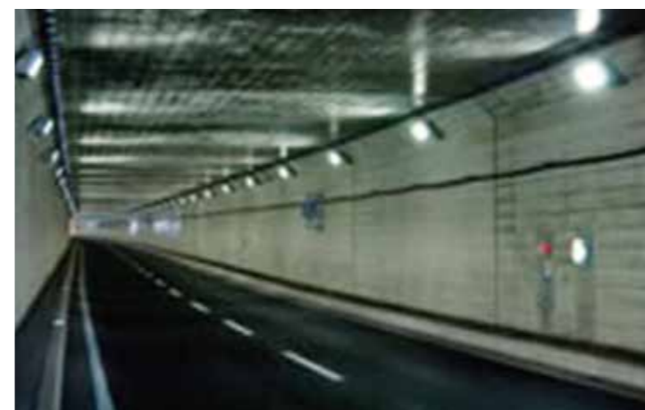
工事名：国補緊道 第13-08-470-Z-002号 トネル工事(上り線) (JV) 発注者：茨城県 完成日：H16.7.31

当社は、国・茨城県及び関係各機関・各地の自治体などから発注される多くの各種土木工事の実績を礎に、多年にわたり地元で培ってきた経験とノウハウを生かし、幅広い土木事業で高い安全性と高品質・経済性を追求しています。又、地域が育んできた文化と風土を大切にしたい生活環境づくりにも積極的に取り組んでいます。