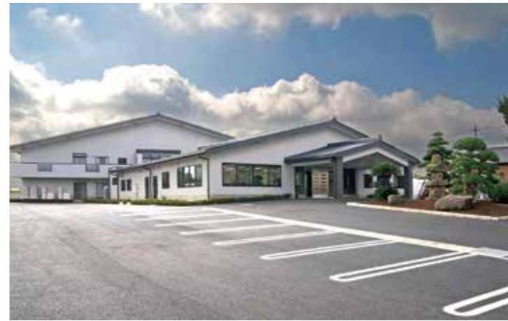
工事名：特別養護老人ホーム雅荘 新築工事 完成日：H23.10.31 概要：S造/地上2階建/3,696.74㎡