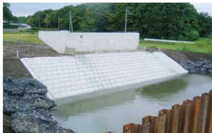
工事名：24国補地道 第24-03-287-0-002号 24国補河川総流防 第24-05-367-0-022号 合併 橋梁下部工事(谷中橋) 発注者：土浦土木事務所 完成日：H25.10.4