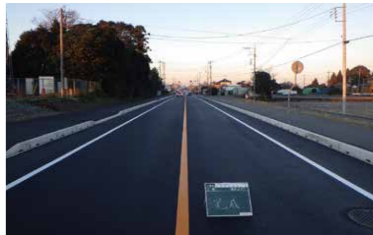
工事名：29国補地道 第29-03-162-0-002号 道路改良舗装工事 発注者：土浦土木事務所 完成日：H30.12.28