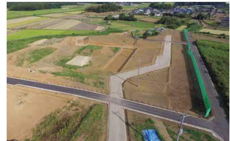
工事名：28国補緊道 第28-16-213-0-008号 宅地造成工事(A街区北) 発注者：土浦土木事務所 完成日：H29.9.14