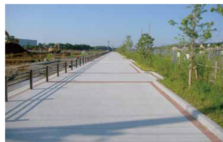
工事名：20国補街路 第20-16-039-0-012号 20県単公下 第20-09-090-0-031号 合併 道路改良舗装工事 発注者：茨城県つくばまちづくりセンター 完成日：H21.8.31