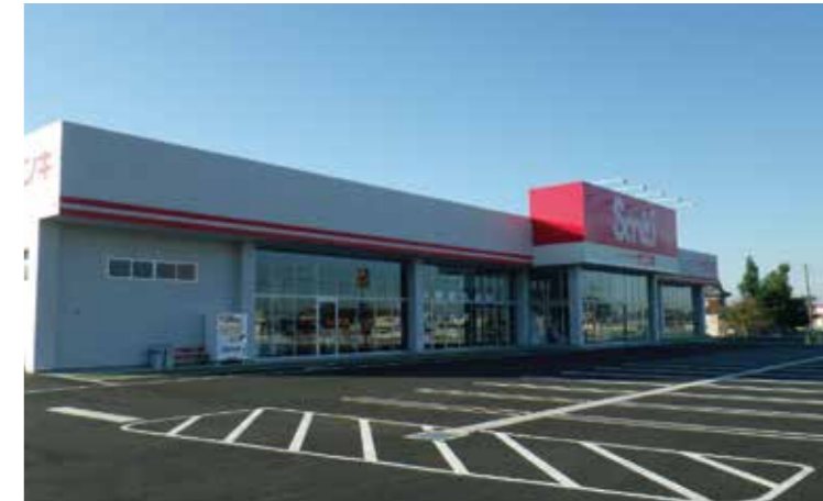
工事名：株S様八街店新築工事 完成日：H26.9.20 概要：S造/平屋建/2,998.55㎡