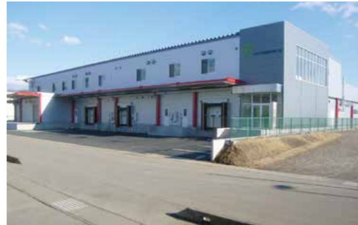
工事名：W様茨城新工場新築工事 完成日：H28.1.31 概要：S造/地上2階建/3,336.73㎡