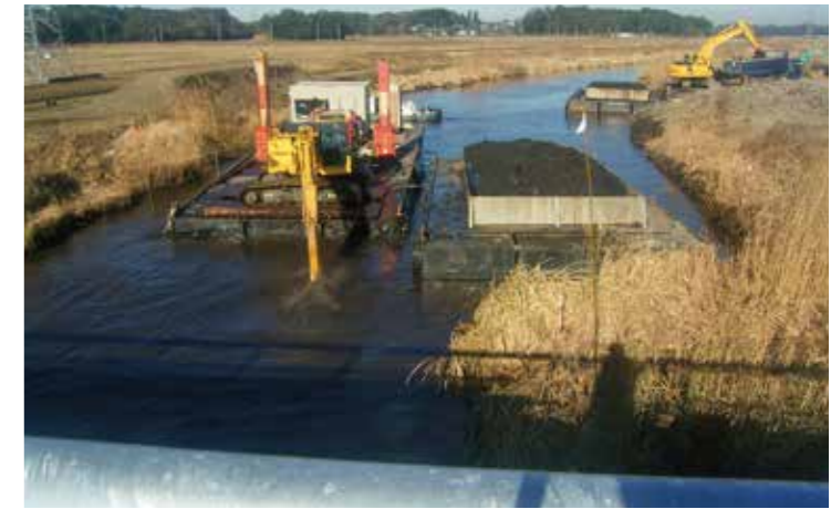
工事名：24国補河川総流防 第24-05-367-0-005号 河道掘削工事(その1) 発注者：土浦土木事務所 完成日：H25.2.20