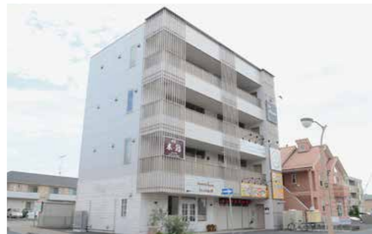
工事名：(仮称)みらい平駅前テナントビル新築工事 完成日：H25.4.30 概要：S造/地上4階建/525.36㎡