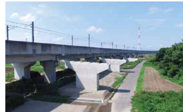
工事名：28国補地道 第28-03-180-0-003号 橋梁下部工事(その5) 発注者：土浦土木事務所 完成日：H29.5.29