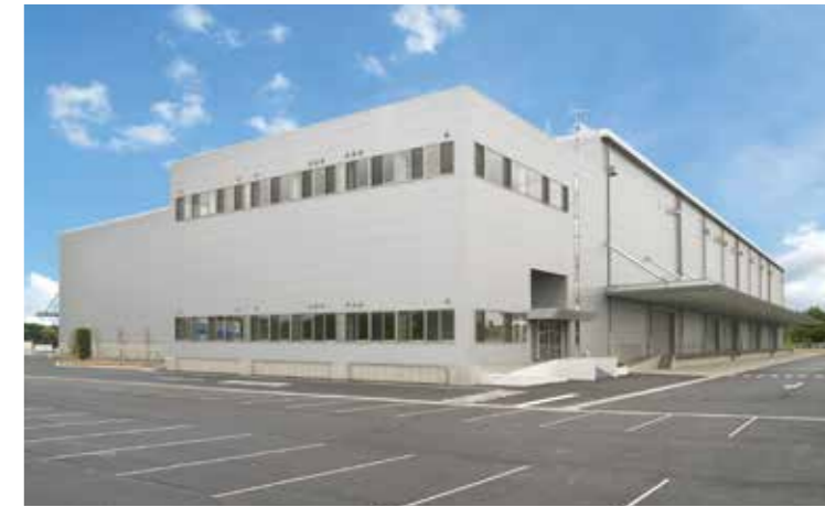
工事名：N様谷田部物流センター新築工事 完成日：H25.8.31 概要：S造/地上2階建/22,234.87㎡