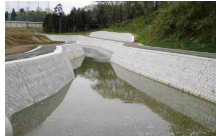
工事名：H21つくば～稲敷地区改良管理工事 発注者：関東地方整備局 常総国道事務所 完成日：H23.4.11