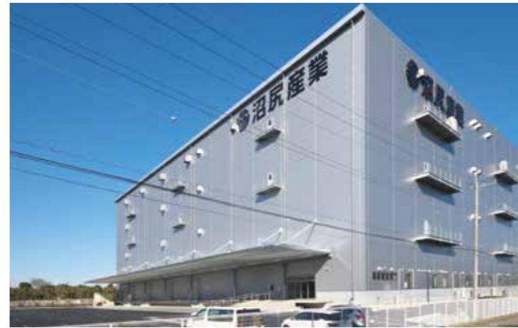
工事名：N様片田アーカイブセンター新築工事 完成日：H27.1.26 概要：S造/地上4階建/19,637.04㎡