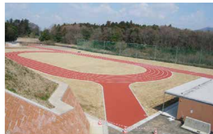
工事名：茨城県立つくば養護学校 運動場整備工事 発注者：茨城県つくば市養護学校 完成日：H20.3.15