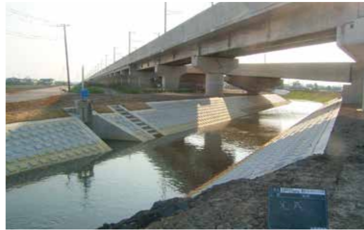
工事名：25国補地道 第25-03-180-0-003号 25国補河川総流防 第25-05-925-0-001号 合併 河川付替工事(その1) 発注者：土浦土木事務所 完成日：H26.6.14