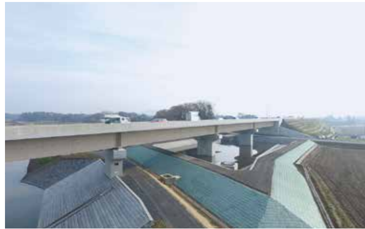
工事名：圏央道坂東常総地区排水整備(1)工事 発注者：関東地方整備局 常総国道事務所 完成日：H29.3.31