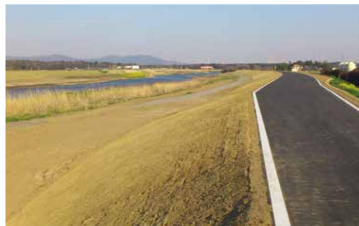
工事名：H24柳原築堤工事 発注者：関東地方整備局 下館河川事務所 完成日：H26.3.7