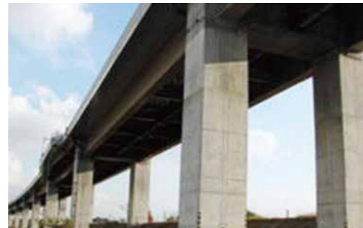
工事名：牛久高架橋下部その4工事 発注者：関東地方整備局 常総国道事務所 完成日：H16.3.23