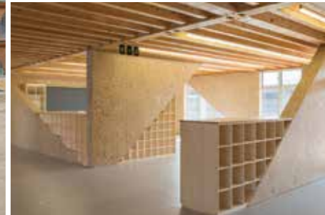
工事名：(仮称)つくばみらい市立陽光台小学校校舎建設工事 (JV) 発注者：つくばみらい市 完成日：H27.2.13 概要：木造・RC造/地上2階建/8,955.57㎡