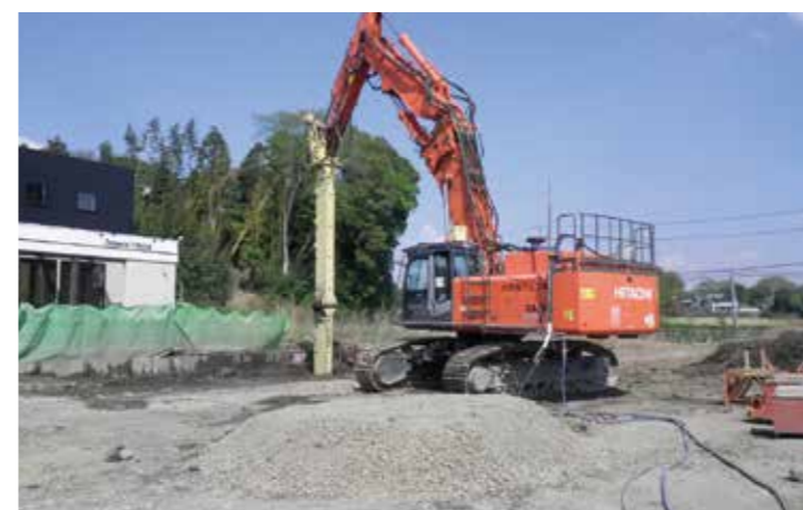
工事名：25県単支援道改 第25-03-462-0-004号 地盤改良工事(その7) 発注者：土浦土木事務所 完成日：H26.8.1