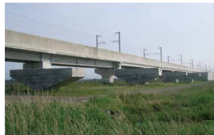
工事名：19国補道橋改 第19-03-845-0-003号 橋梁下部工事 ( (仮称) 谷口川橋梁) 発注者：茨城県つくばまづくりセンター 完成日：H20.7.31