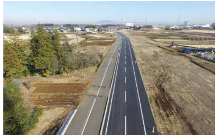
工事名：27県単支援助道改 第27-03-462-0-007号 道路舗装工事(その9) 発注者：土浦土木事務所 完成日：H29.1.21