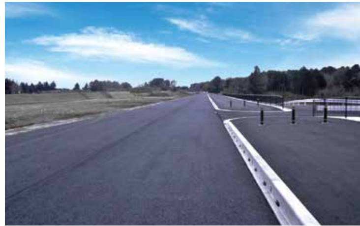
工事名：27県単支援助道改 第27-03-462-0-002号 26県単支援助道改 第26-03-462-0-006号 合併 道路舗装工事(その4) 発注者：土浦土木事務所 完成日：H28.3.15