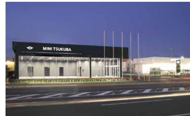
工事名：株M様MINIつくば店新築工事 完成日：H24.2.20 概要：S造/平屋建/661.74㎡