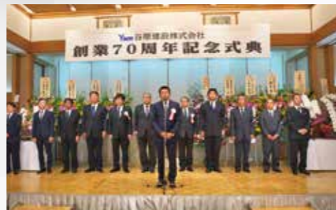
▲ 70周年式典の様子 ◀ 社史