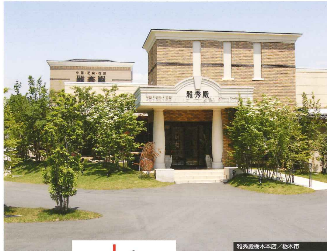
雅秀殿栃木本店 / 栃木市

店に集い、語り、育む、みなさんが自由に楽しめる街の商業施設。 —— 店があると人は歩き、街はもっと楽しくなります —— これからの「店」魅せる店」と「街」の結びつき…その姿が心地よく馴染むバランス、時には存在感を際立たせながら、みなさまに心地よい店舗空間や爽やかな建築施設を伝統の中につくりあげていきます。