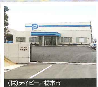
(株)ティビー / 栃木市