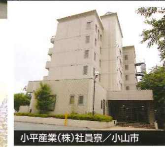
小平産業(株)社員寮 / 小山市