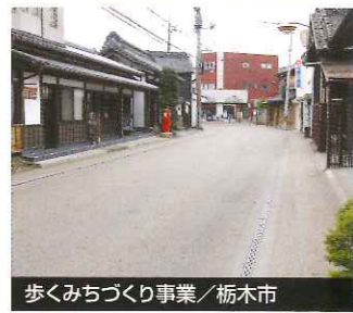
歩くみちづくり事業 / 栃木市

自然環境との融合と調和、人々に優しい魅力ある景観づくりと社会の発展を目指す土木事業。 創業以来、道路・橋梁・河川整備・上下水道・宅地造成などの土木事業に確立した技術力で施工、万全を尽した管理体制で取り組んでいます。また、災害時に県、市、建設業協会と連携をとりパトロールや、24時間体制での災害対策活動を担い、地域社会の安全と信頼に貢献してまいります。