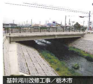
基幹河川改修工事 / 栃木市