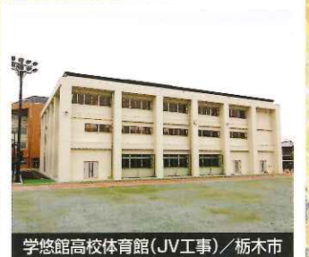
学悠館高校体育館(JV工事) / 栃木市