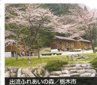
出流ふれあいの森 / 栃木市