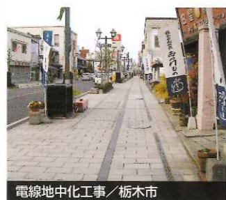
電線地中化工事 / 栃木市