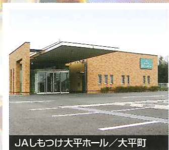
JALもつけ大平ホール / 大平町