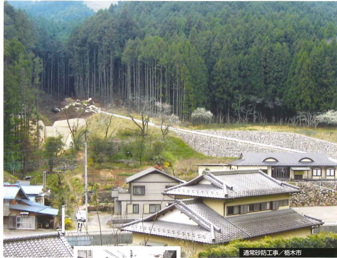
通常砂防工事 / 栃木市