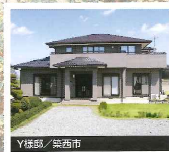
Y様邸 / 築西市