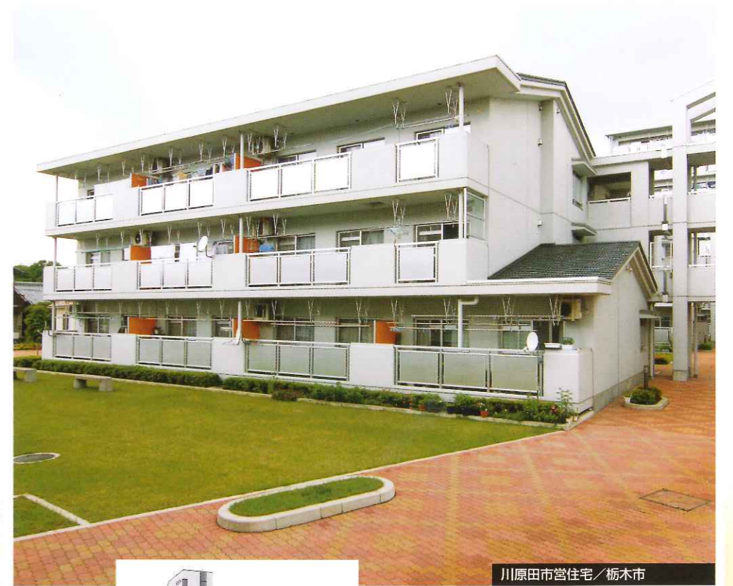
川原田市営住宅 / 栃木市

集い、語り、街のみなさんが過ごす施設、イキイキと快適に参加できる公共施設。学び、ふれ合い、創造を膨らませます教育施設等。 いま、健康意識の高まりや高齢社会への対応、マルチメディア時代へと。これからの「人と環境」の関係を考えつねに一歩先の時代を捉えた快適で豊かな優しい生活環境をつくりあげていきます。