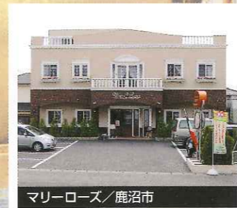
マリローズ / 鹿沼市