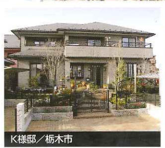
K様邸 / 栃木市