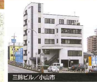
三鈴ビル / 小山市