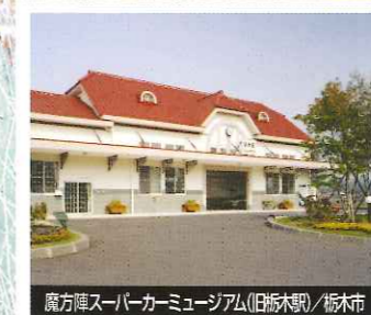
魔方陣スーパーミュージアム(旧栃木駅) / 栃木市