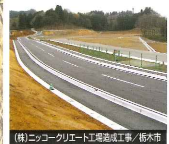
(株)ニッコークリエイト工場造成工事 / 栃木市

自然環境との融合と調和、人々に優しい魅力ある景観づくりと社会の発展を目指す土木事業。 創業以来、道路・橋梁・河川整備・上下水道・宅地造成などの土木事業に確立した技術力で施工、万全を尽した管理体制で取り組んでいます。また、災害時に県、市、建設業協会と連携をとりパトロールや、24時間体制での災害対策活動を担い、地域社会の安全と信頼に貢献してまいります。