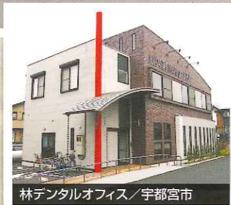
林デンタルオフィス / 宇都宮市