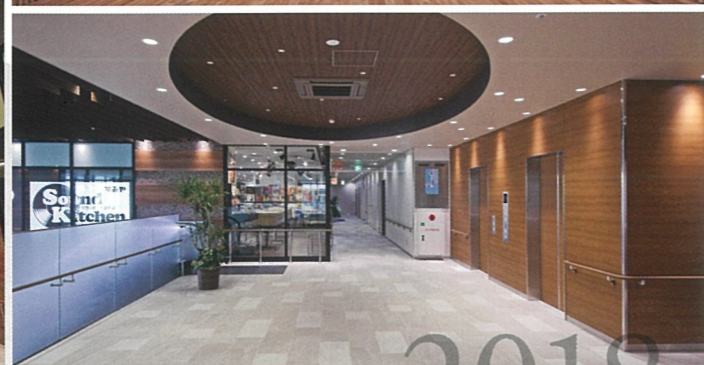
再開発事業 札の辻クロス 2018年