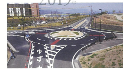
土木工事 日本平公園整備