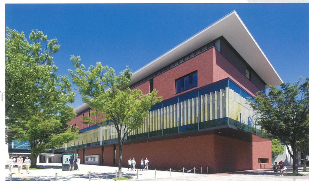
教育施設 静岡県立大学看護学部棟