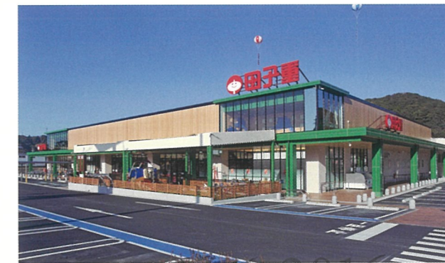
商業施設 田子重清里店