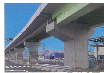
土木工事 中島高架橋