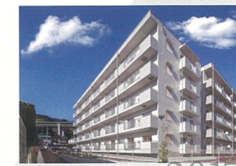
集合住宅 麻機北団地1号棟第2期