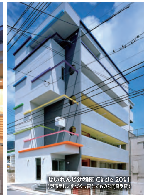
せいれんじ幼稚園 Circle 2011 (呉市美しい街づくり賞たても部門賞受賞)