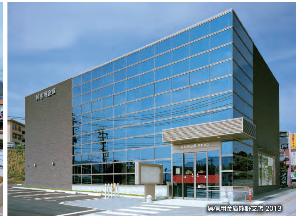
呉信用金庫熊野支店 2013