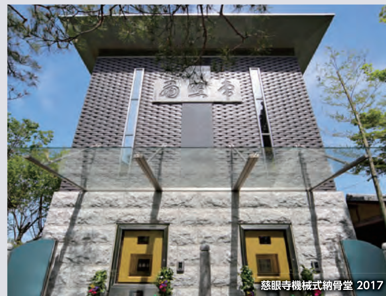
慈眼寺機械式納骨堂 2017