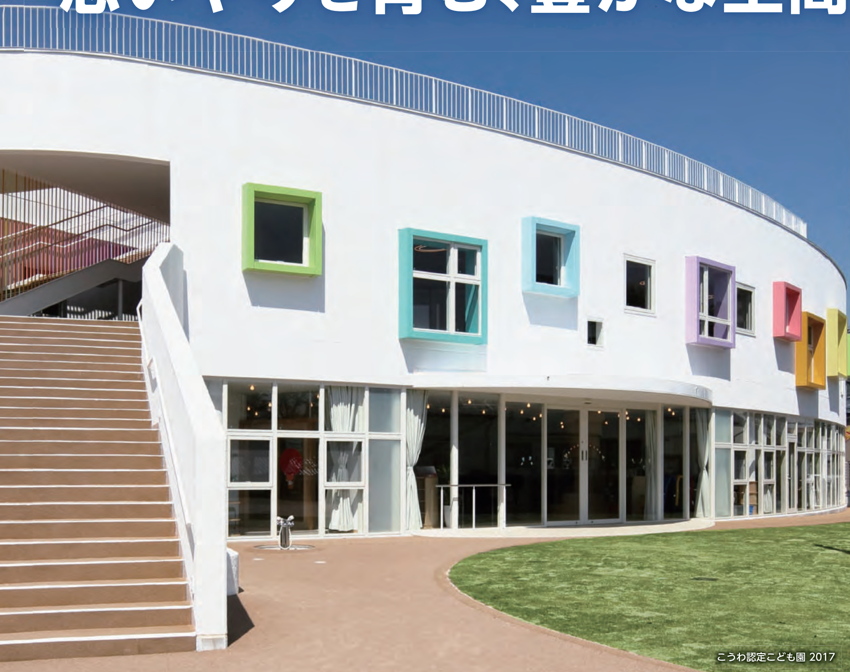
こうわ認定こども園 2017