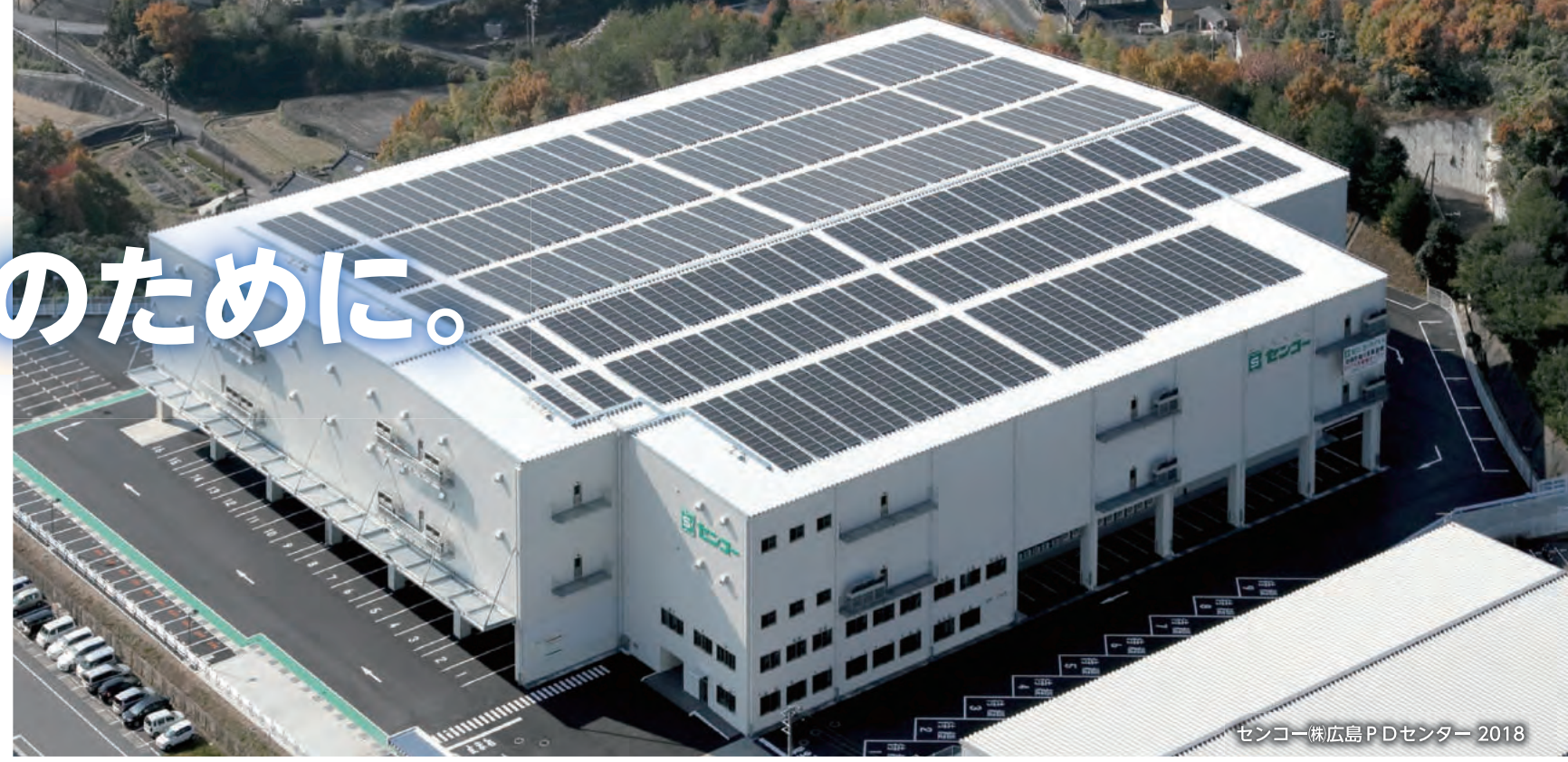
センコー株式会社広島PDセンター 2018