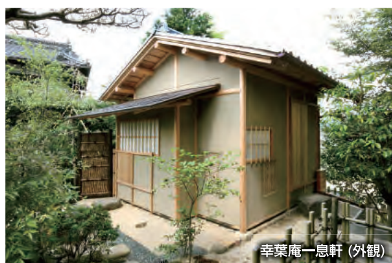
幸葉庵一息軒 (外観)

世界に誇る日本の美しい伝統建築。井本建設は、数多くの神社、仏閣の建設、改修、修復実績から培った技術力で日本の美を後世へ伝えます。伝統的な茶室やもてなしの空間としての和室の設計施工まで、様々な伝統建築の建設、再現が可能です。流派ごとの様式美に則った建築から、現代の住環境に合わせた意匠まで、豊富な経験と技術力で設計施工いたします。