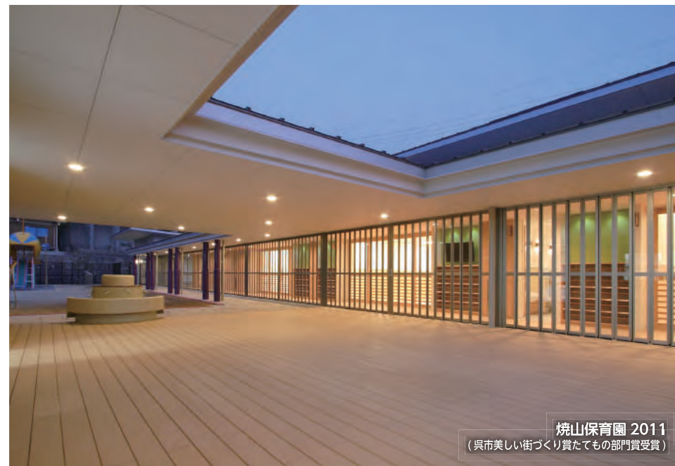
焼山保育園 2011 (呉市美しい街づくり賞たても部門賞受賞)