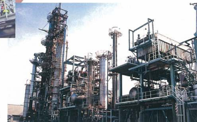
石油精製装置 (メンテナンス及び配管工事)