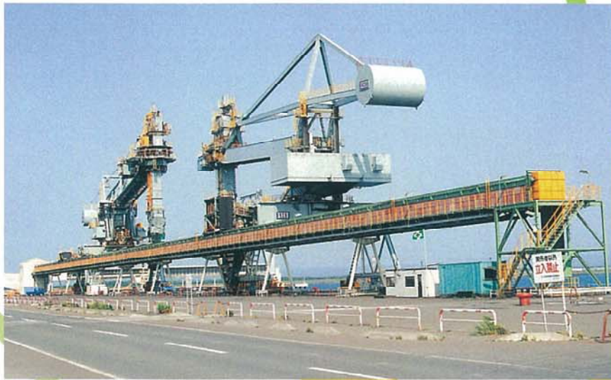
コールセンター（据付・メンテナンス）

今、産業社会はめざましい発展をとげています。 その環境の中、設計・製作・施工など、私達は責任をもって技術開発に取り組んでいます。