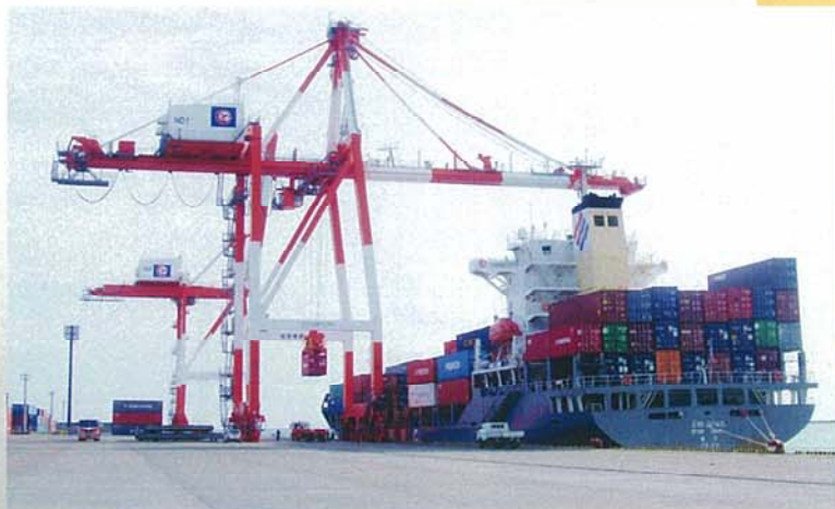
コンテナクレーン（据付・メンテナンス）