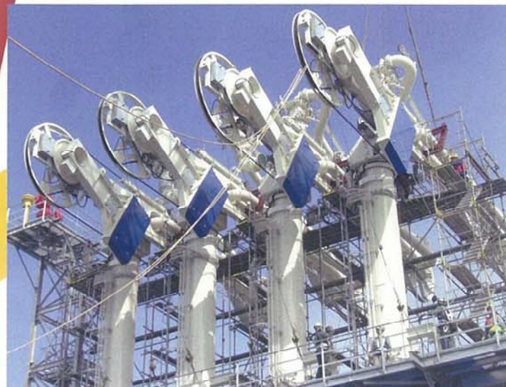
ローディングアーム据付

各種プラント機械・荷役機械・上下水道設備の据付・配管工事 石油精製プラントのメンテナンス及び定修工事