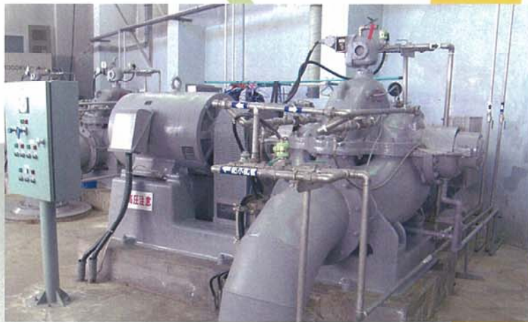
工業用水ポンプ設備（据付・メンテナンス）