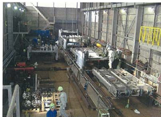
スクープ式攪拌機