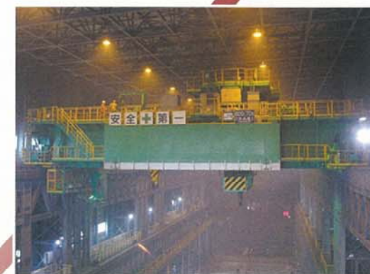
600t 天井クレーン据付