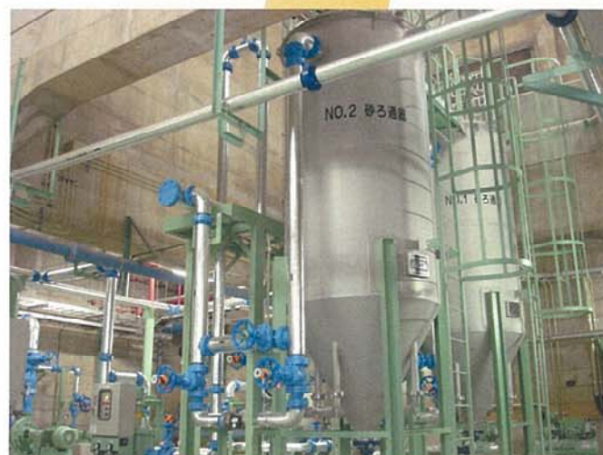
上水・下水処理場機器据付