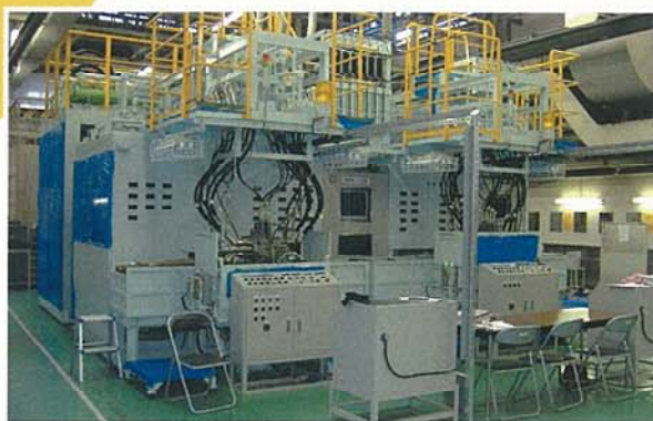
建設機械用コントロールバルブテスター