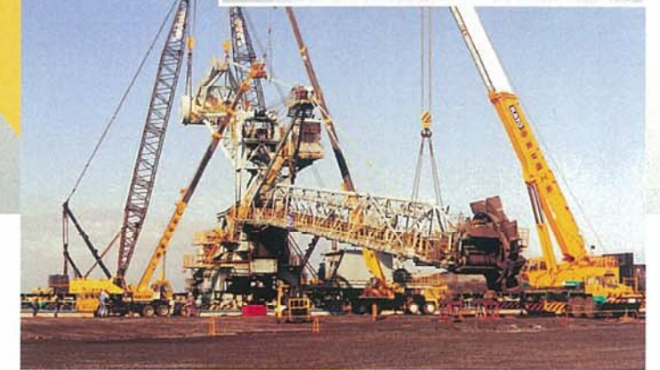
クレーンによる相吊り作業