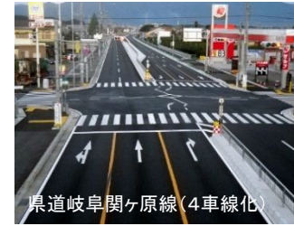
県道岐阜関ヶ原線(4車線化)