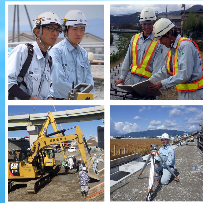
株式会社山辰組 会社案内