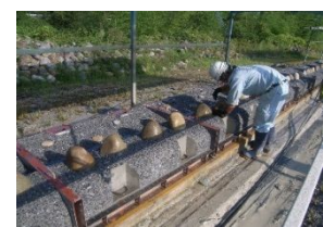
自然石魚道ブロック製作