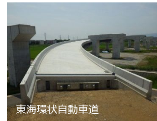
東海環状自動車道