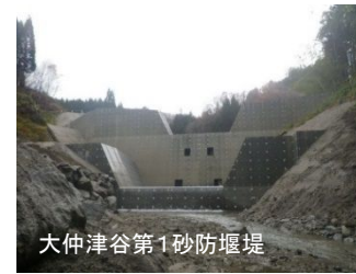
大仲津谷第1砂防堰堤