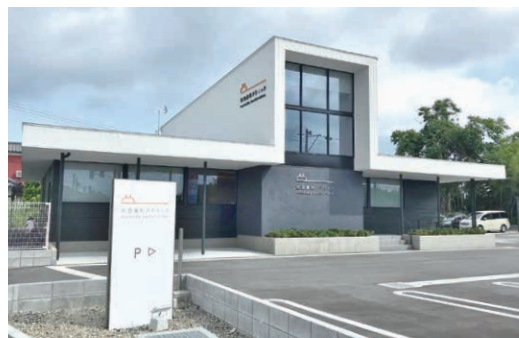
松田歯科クリニック(新潟市北区)