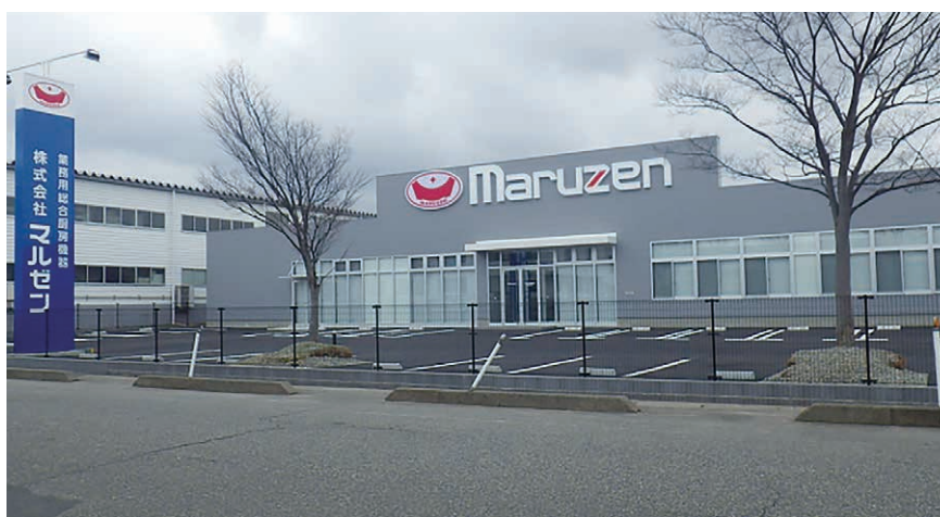
株式会社マルゼン 新潟営業所(新潟市江南区)