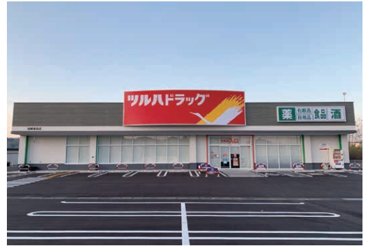
ツルハドラッグ 柏崎安田店 (柏崎市)