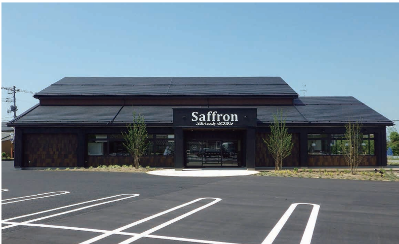
石窯パン工房サフラン 大形店 (新潟市東区)