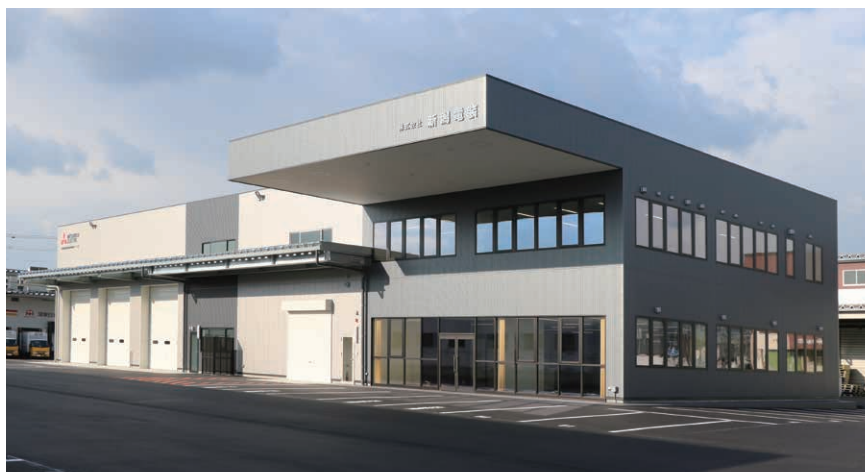
株式会社新潟電装(新潟市西区)