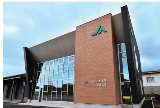
JAにいがた南蒲 上通支店(長岡市)