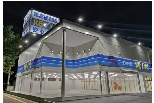
ケーユー新潟 女池店 (新潟市中央区)