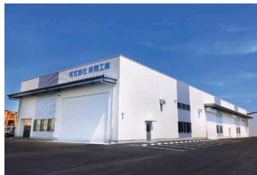
株式会社新開工業 事務所・工場(新発田市)