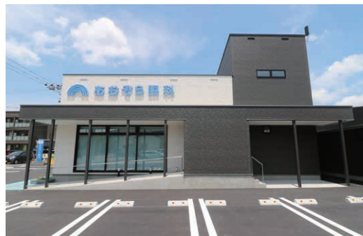
あおぞら眼科(新潟市中央区)