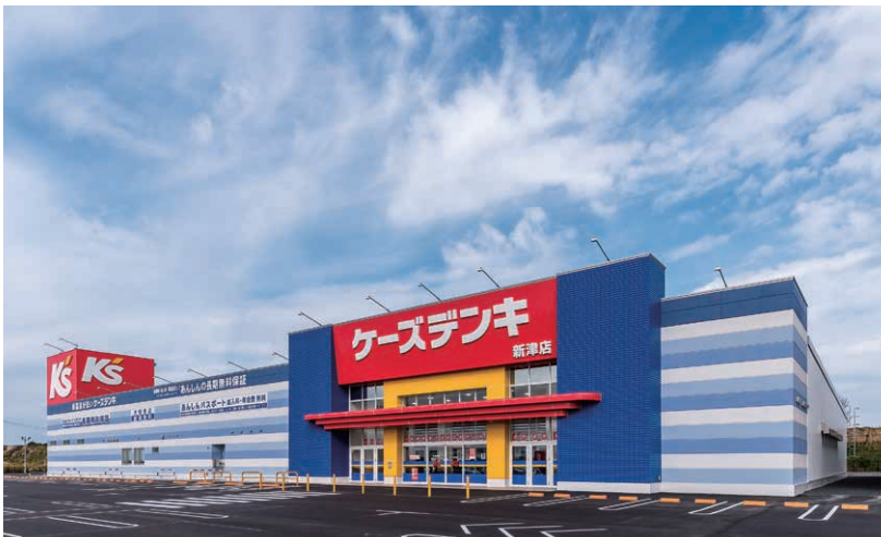
ケースデンキ新潟店 (新潟市秋葉区)