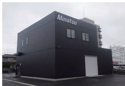
みなもと通信株式会社 新潟営業所(新潟市中央区)