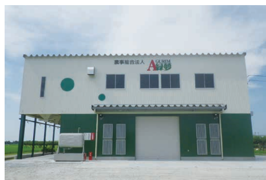
農事組合法人 緑夢ライスセンター(新潟市北区)