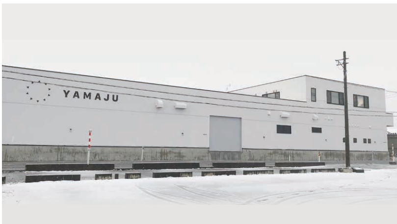
株式会社山重 本社工場(新潟市西蒲区)