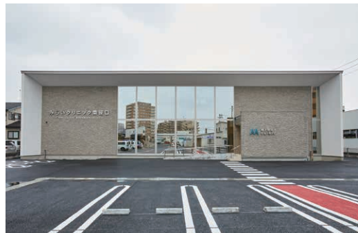
みらいクリニック南笹口(新潟市中央区)