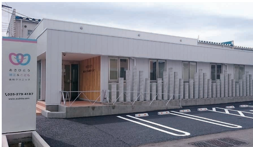
あさひとう矯正&こども歯科クリニック(新潟市東区)