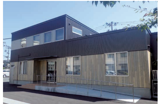
グループホームモアcotoriハウス(新潟市西区)