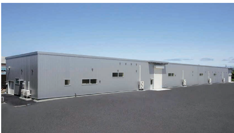
株式会社オスカー技研(新潟市東区)