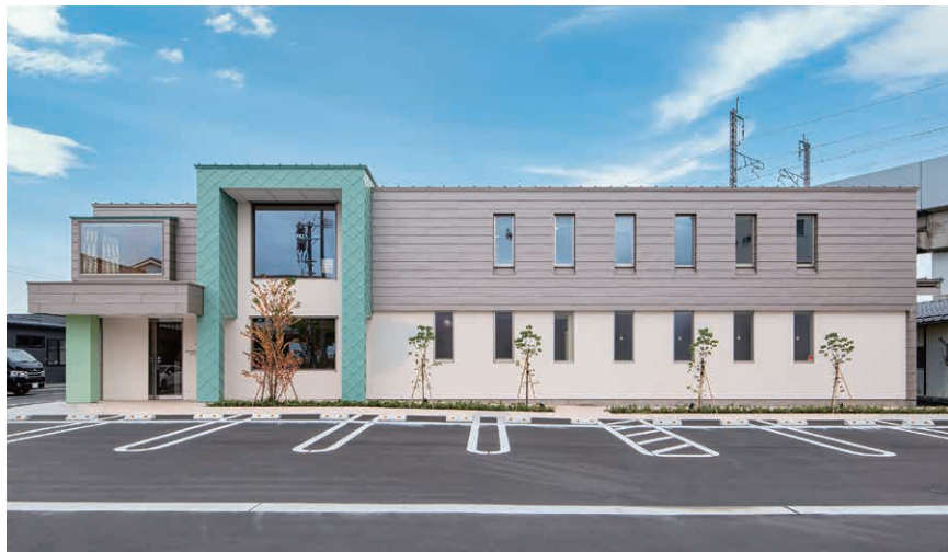
にいがた乳腺クリニック(新潟市中央区)