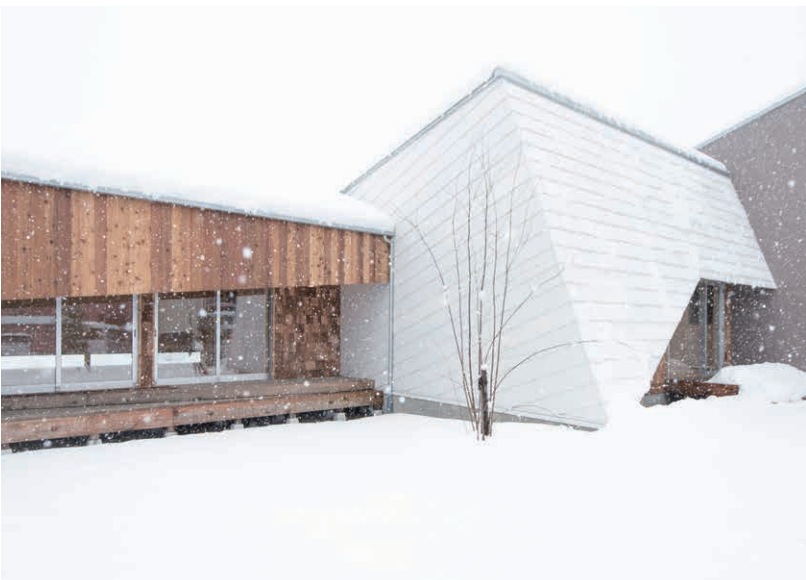
ラスマイル(新潟市秋葉区)