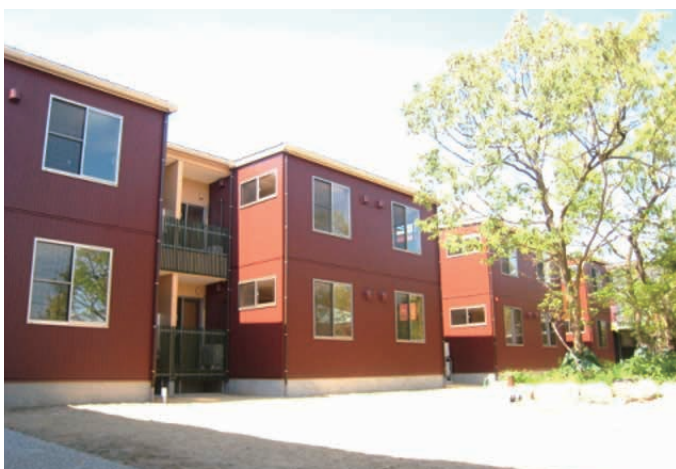
グリーンホームズII(新潟市中央区)