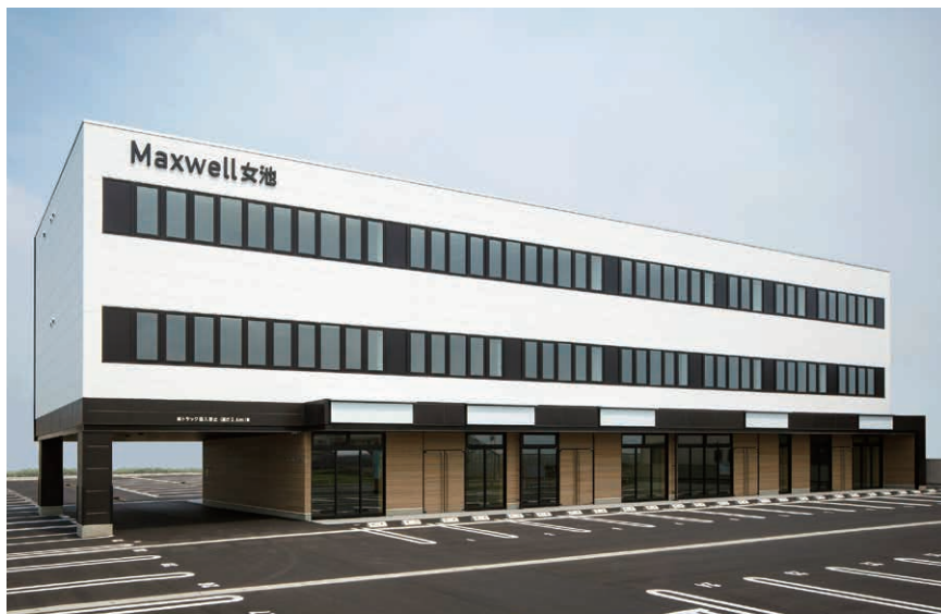
マクスウェル女池(新潟市中央区)