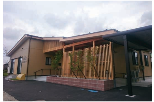
ささえ愛おうみ(新潟市中央区)