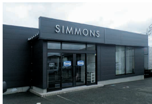
シモンズ株式会社 新潟営業所(新潟市中央区)