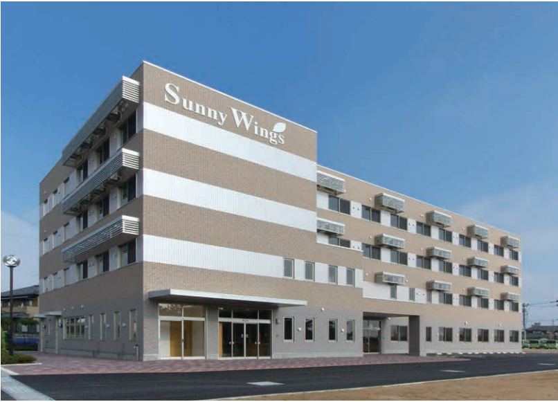
サニーウイング鳥屋野(新潟市中央区)