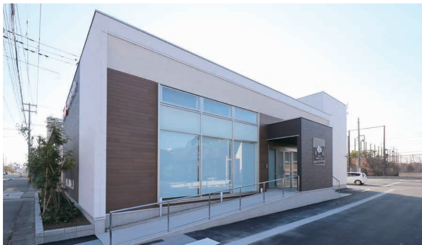
おつかこどもクリニック(新潟市中央区)