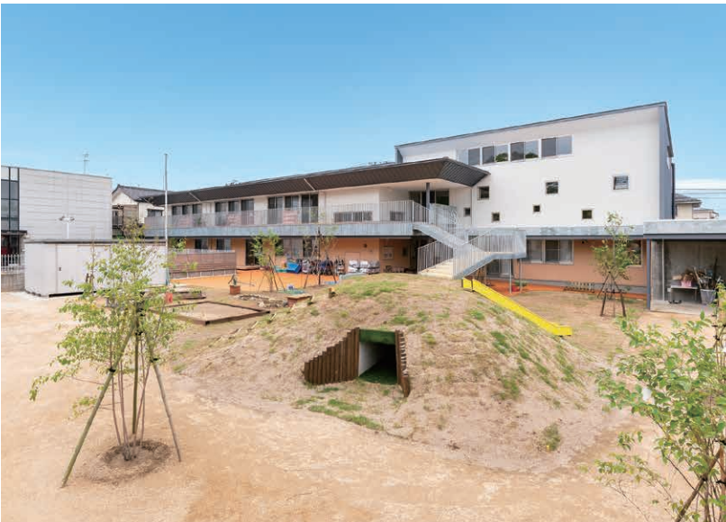
こばとこども園(新潟市中央区)