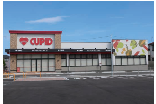
キュービット 真砂店 (新潟市西区)