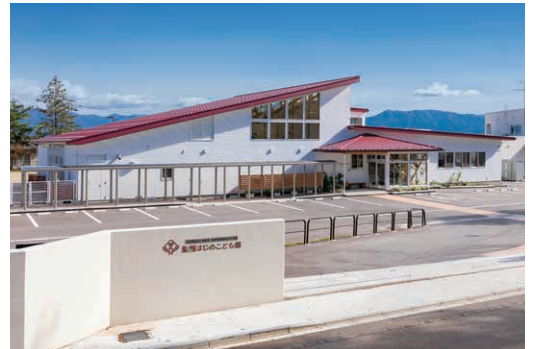
聖籠はじめこども園(新潟県北蒲原郡)