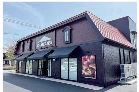
シャトレーゼ 新潟亀田店 (新潟市江南区)