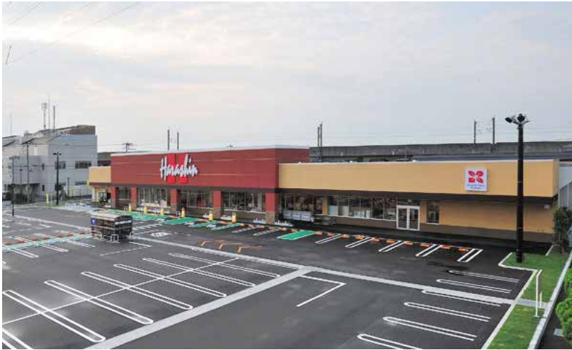
原信 近江店 (新潟市中央区)