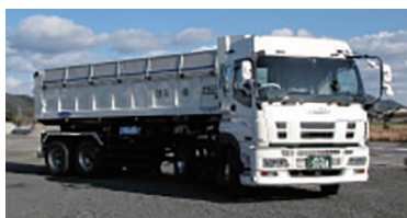
トレーラー土砂ダンプ(21t積)