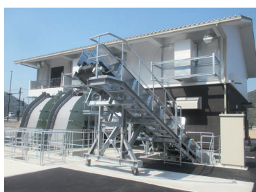
排水機場建築工事