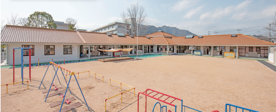
教育施設改修工事