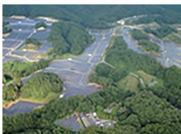
茨城県袋田太陽光発電所建設工事