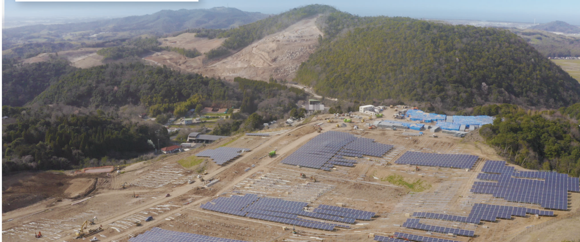
鳥取県内太陽光発電所建設工事