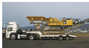
重機運搬トレーラー