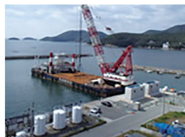
ケーソン制作据付工事