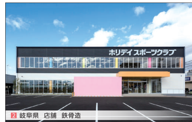
2 岐阜県 店舗 鉄骨造