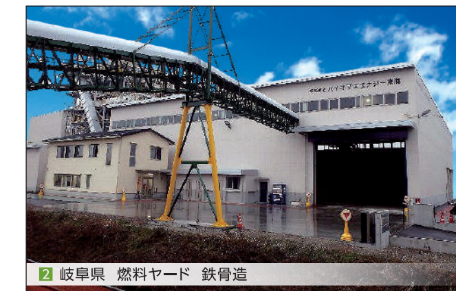
2 岐阜県 燃料ヤード 鉄骨造