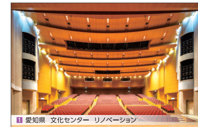
1 愛知県 文化センター リノベーション