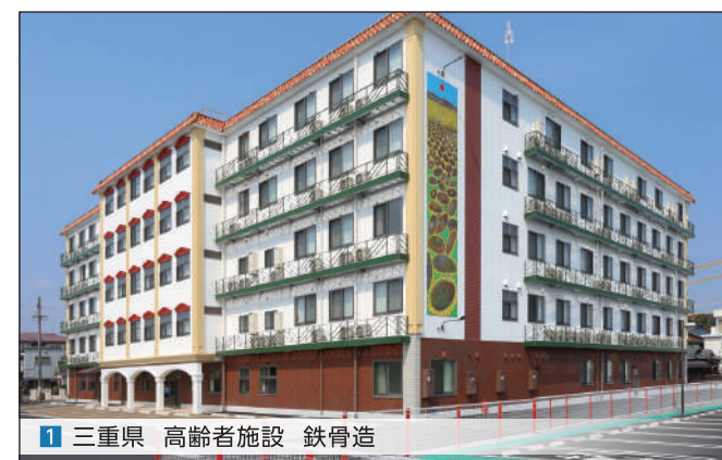
1 三重県 高齢者施設 鉄骨造