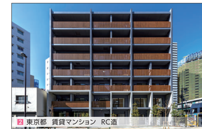
2 東京都 賃貸マンション RC造