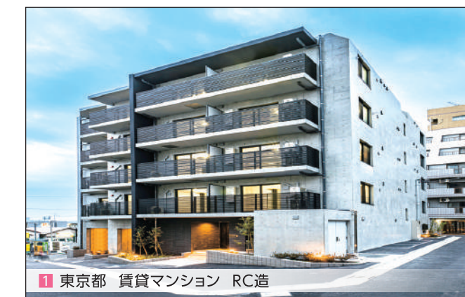
1 東京都 賃貸マンション RC造