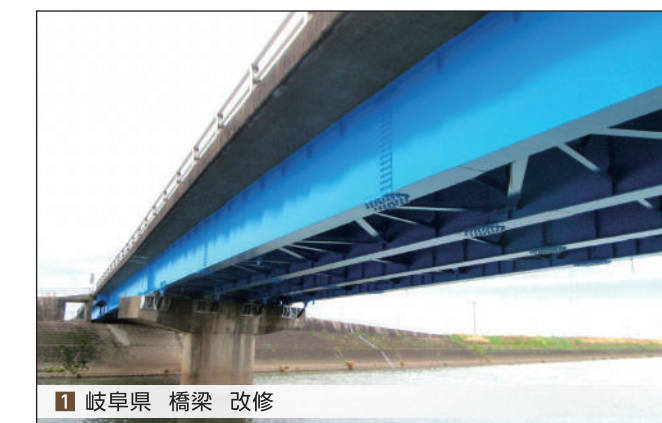
1 岐阜県 橋梁 改修