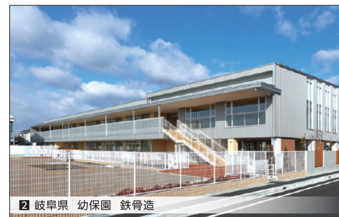
2 岐阜県 幼稚園 鉄骨造