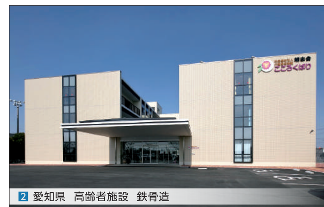
2 愛知県 高齢者施設 鉄骨造