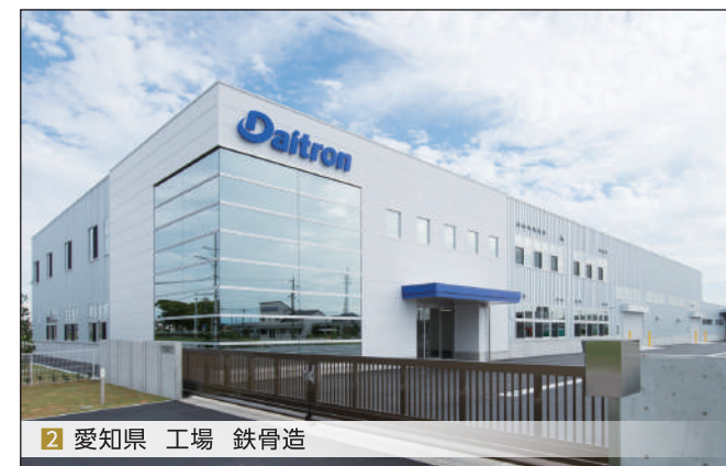
2 愛知県 工場 鉄骨造