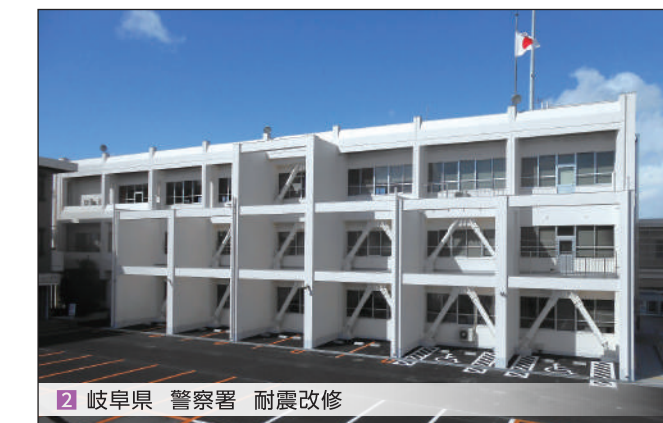
2 岐阜県 警察署 耐震改修