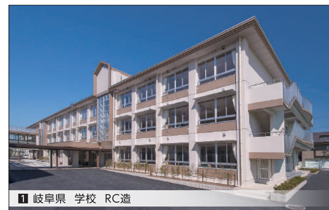
1 岐阜県 学校 RC造