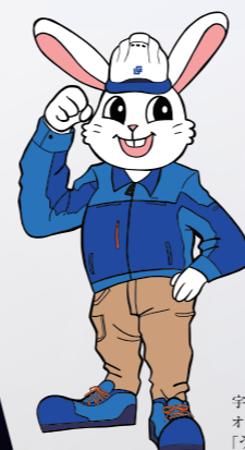
宇佐美組 オリジナルキャラクター 「ウサミン」