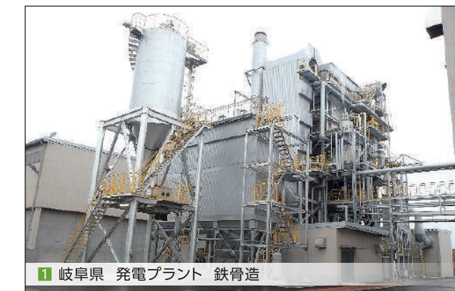
1 岐阜県 発電プラント 鉄骨造