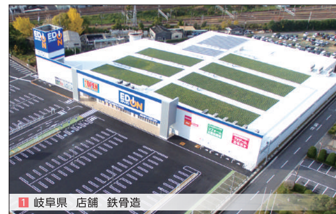
1 岐阜県 店舗 鉄骨造