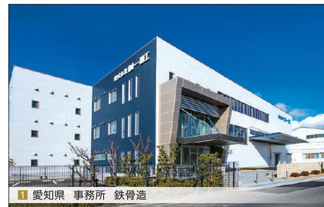
1 愛知県 事務所 鉄骨造