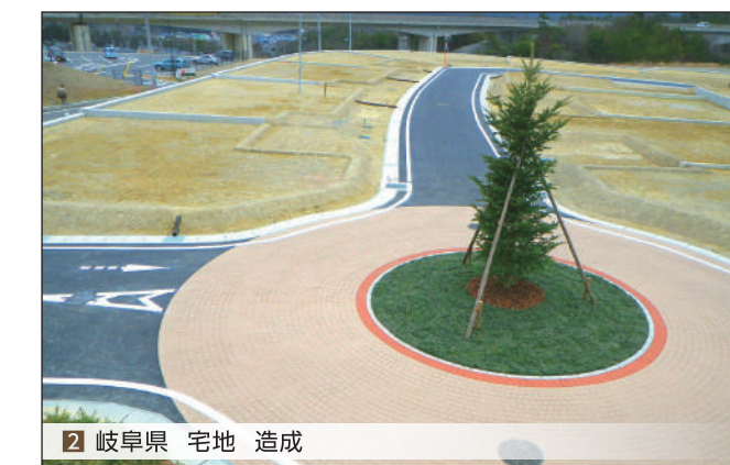
2 岐阜県 宅地 造成