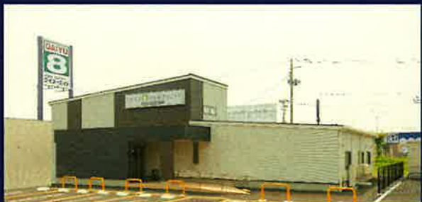
アビエスカんのクリニック新築工事