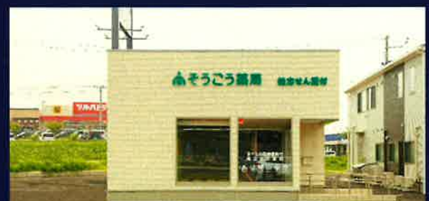
そうごう薬局一関店新築工事