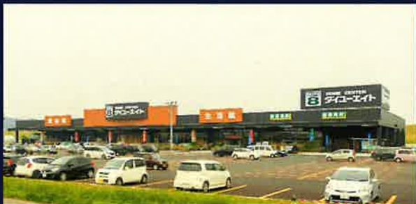
ダイソー一関店新築工事