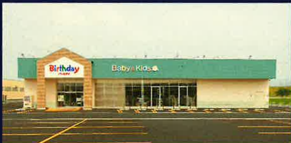
バースデー一関店新築工事