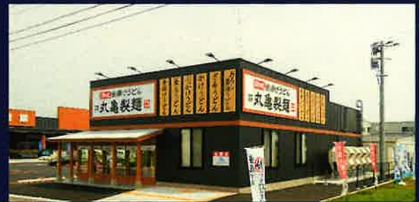
丸亀製麺一関店新築工事