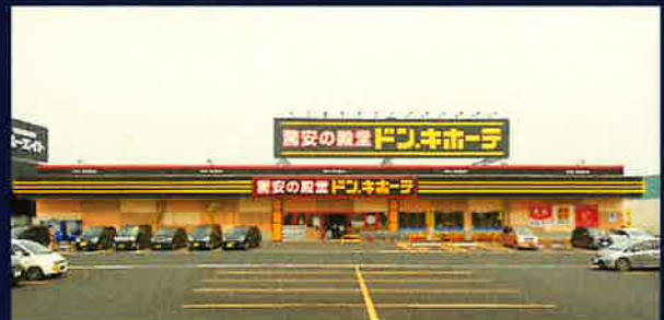
ドン・キホーテ一関店新築工事