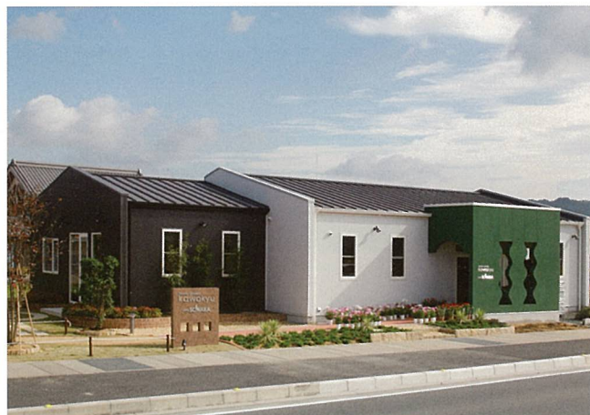
flower garden&cafe (甲賀市)