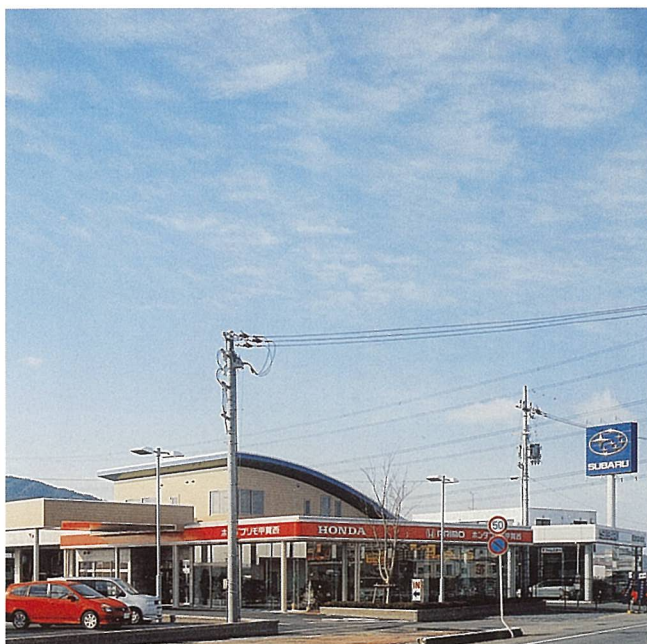
ホンダプリモ甲賀西 (甲賀市)