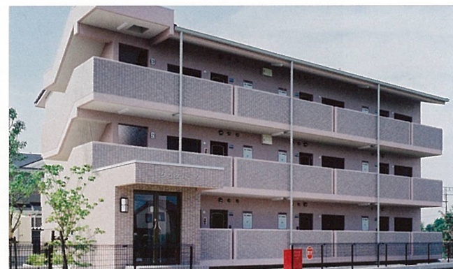
グランパーク (守山市)