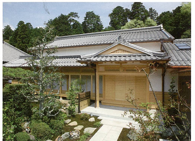
大池寺居宅新築工事(甲賀市)