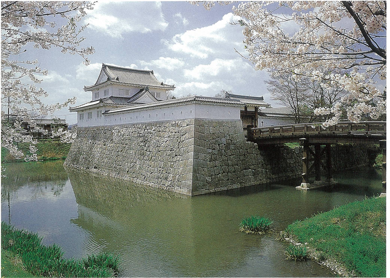
水口城角櫓建築工事(甲賀市)