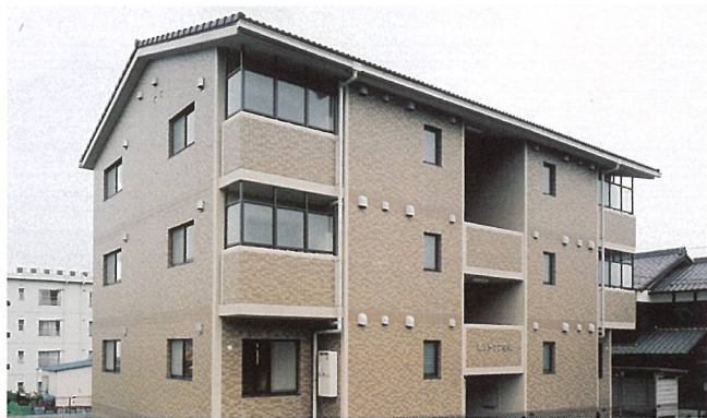
ヒルトップ名坂 (甲賀市)