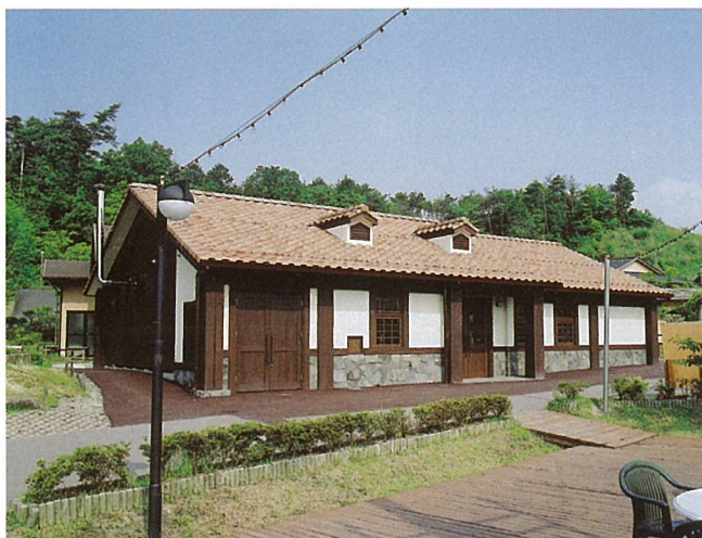
乳製品製造加工販売施設