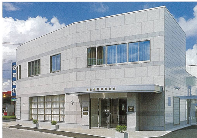
滋賀銀行綾野支店 (甲賀市)