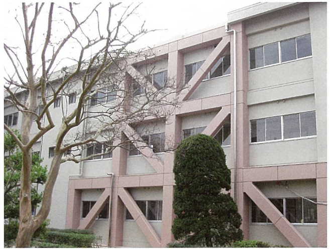
国立大学法人滋賀大学耐震（大津市）