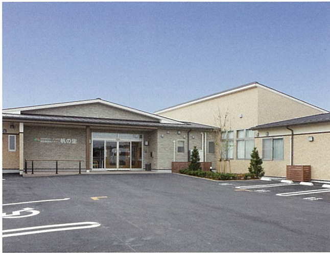
社会福祉法人よつば会特別養護老人ホーム帆の里 (草津市)