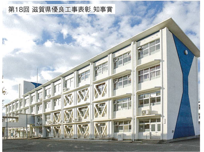
水口東中学校・高等学校耐震（甲賀市）