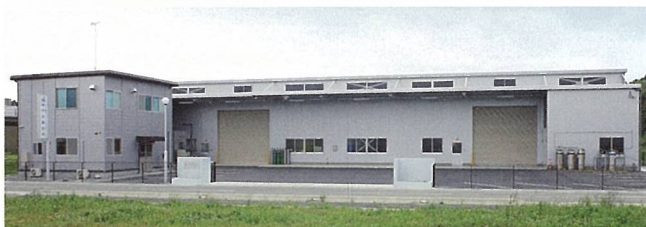
中谷製作所 (甲賀市)