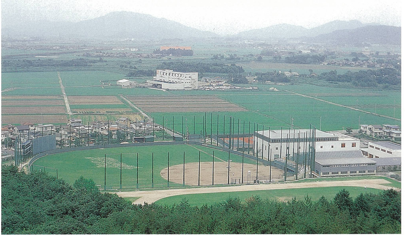
前日本I・B・M(株)関西グランド造成工事(野州市)