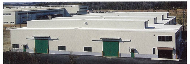
(株) 榎木製作所滋賀工場 (甲賀市)