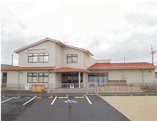
あやめ保育所 (野洲市)