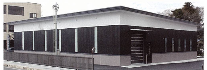
島本微生物工業(株) 本社工場 (甲賀市)