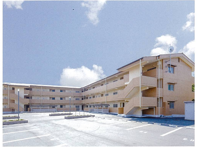
市営住宅寺庄団地（甲賀市）