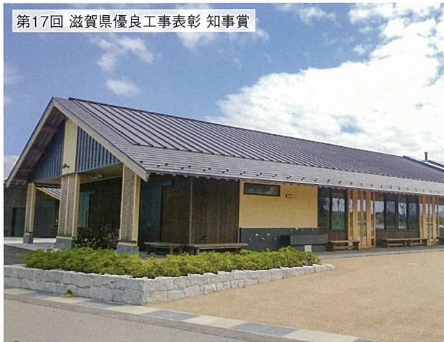
びわこ地球市民の森 森づくりセンター（守山市）