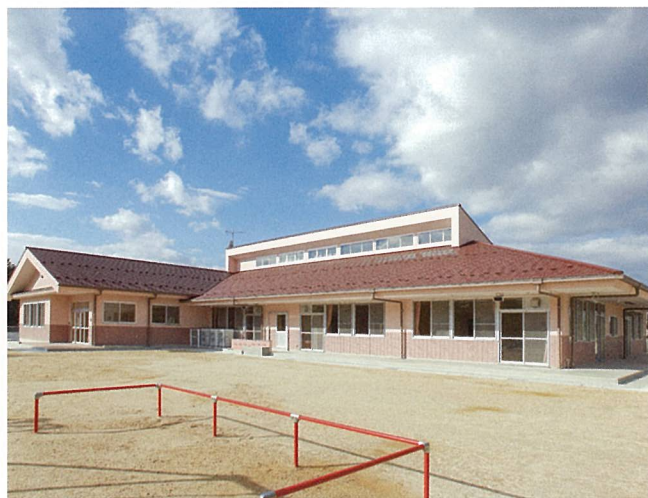
コスモス保育園 (竜王町)