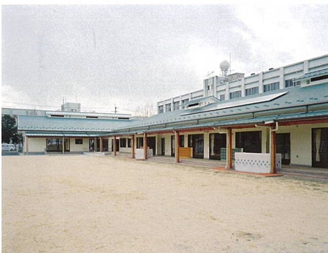
草津市立老上幼稚園 (草津市)