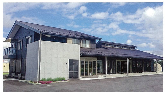
青木自動車部品株式会社 (甲賀市)