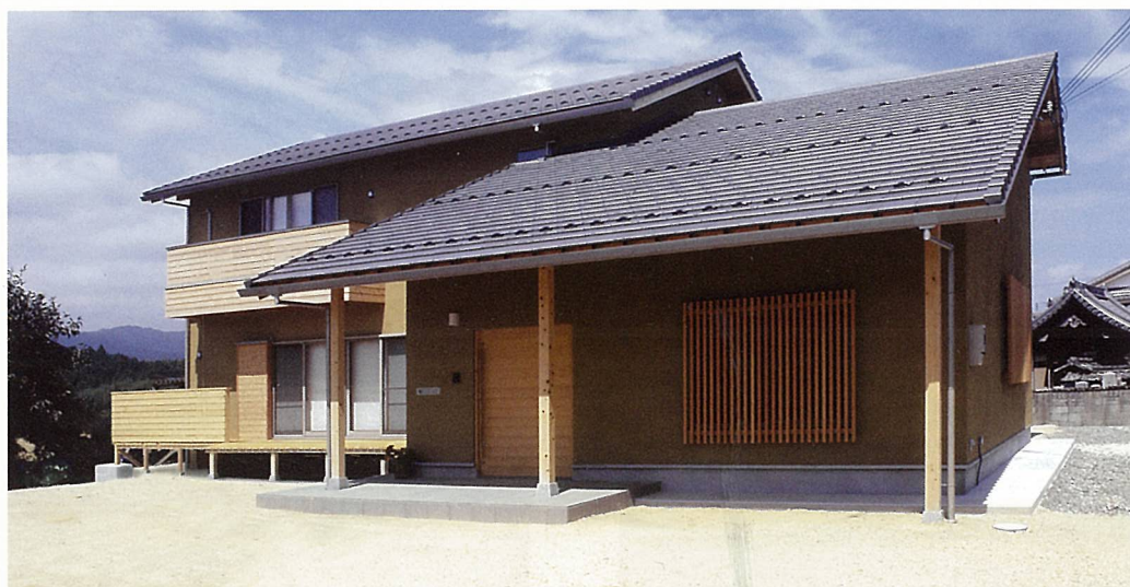
甲賀市甲南町 A様邸