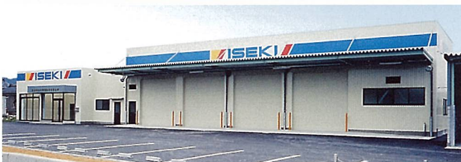
京滋中セキ販売(株) 湖東営業所 (東近江市)