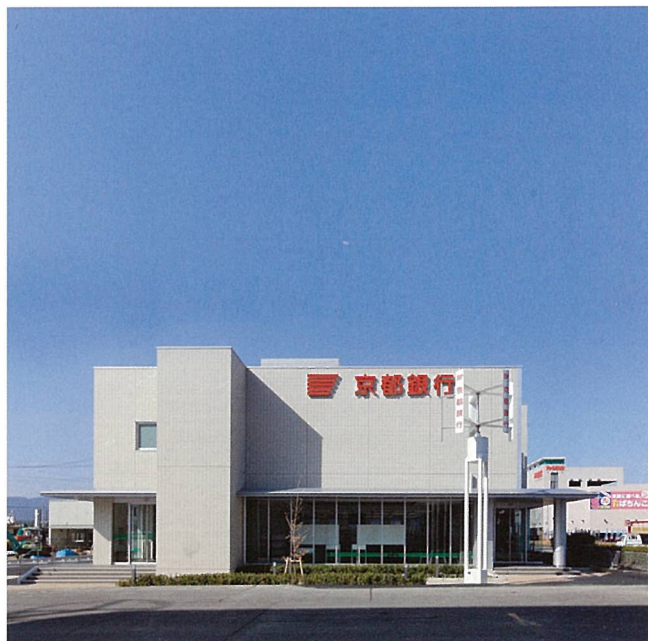
京都銀行水口支店 (甲賀市)