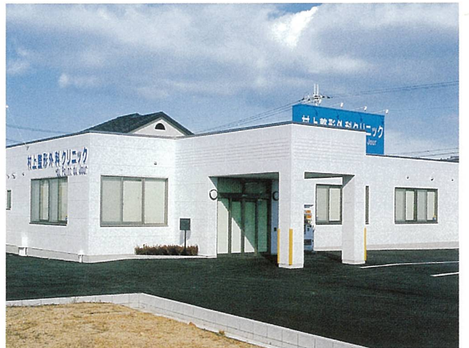
村上整形外科クリニック (甲賀市)