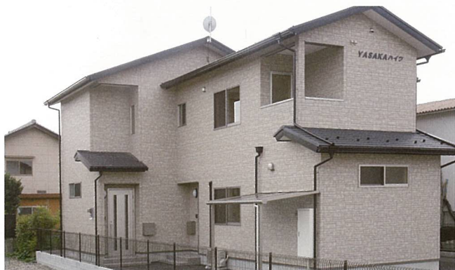
八坂ハイツ (甲賀市)