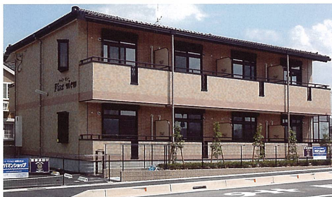
ファインビュー (甲賀市)