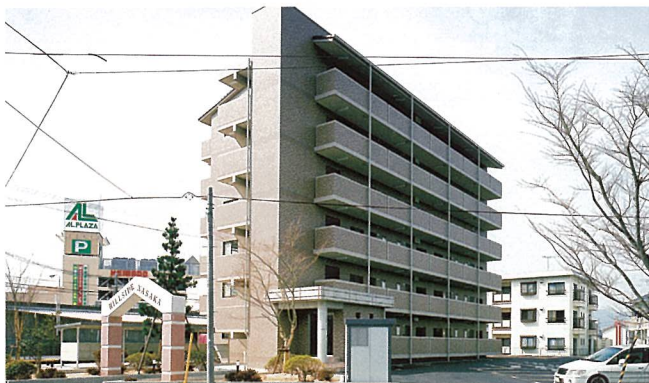
ヒルサイド名坂 (甲賀市)