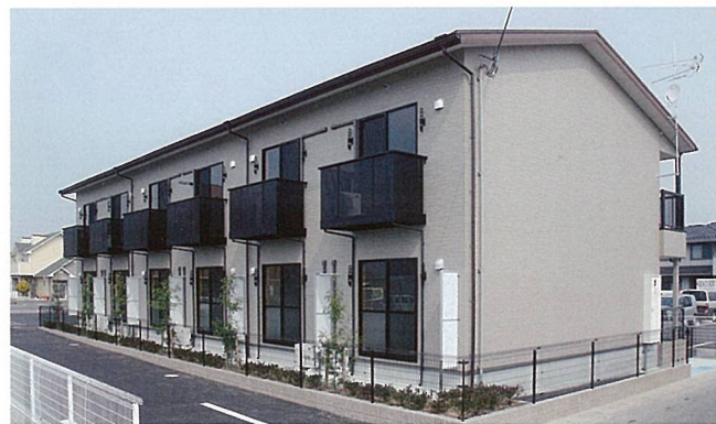
フィーノ南林口 (甲賀市)