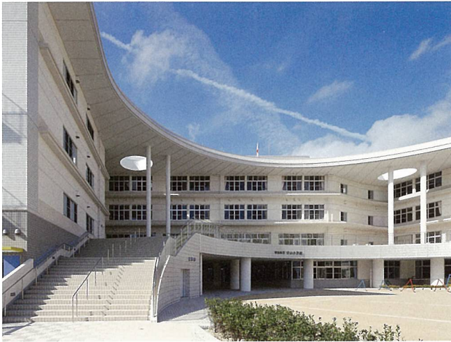
守山小学校（守山市）