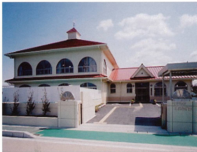
守山市立速野幼稚園 (守山市)