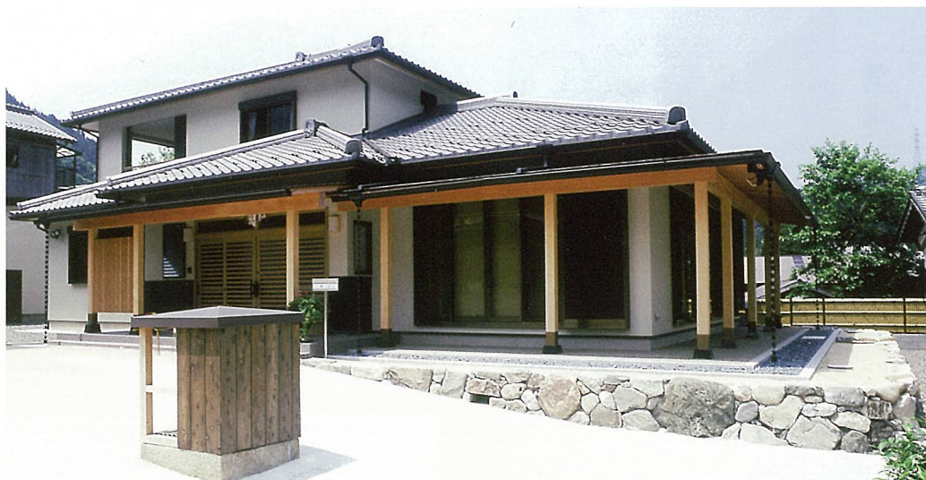
甲賀市土山町 M様邸