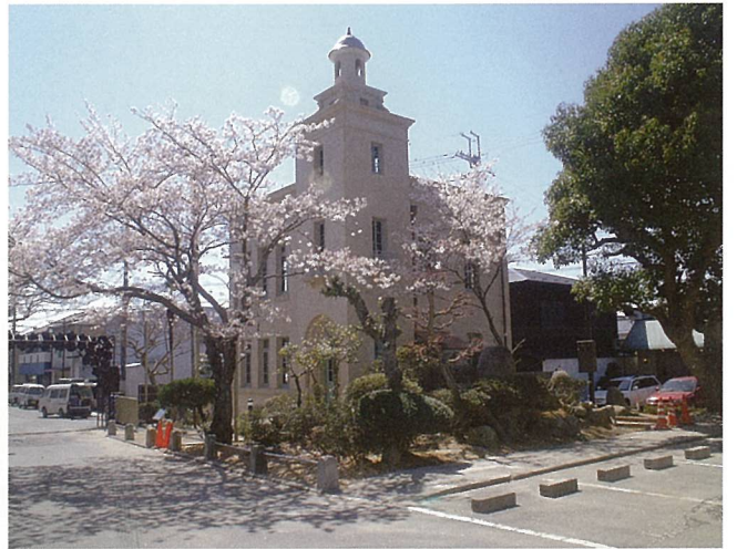
国登録文化財建造物 旧水口図書館保存整備（甲賀市）