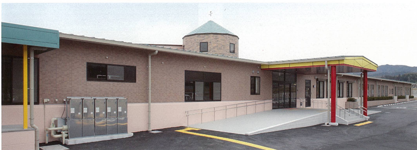
貴生川認定こども園 (甲賀市)