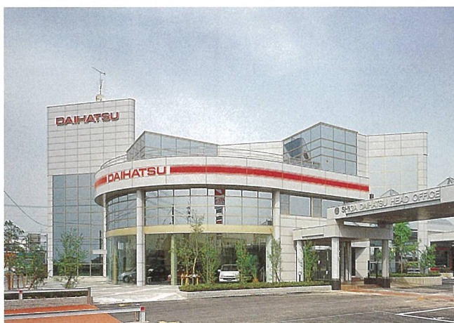
滋賀ダイハツ販売本社社屋 (栗東市)