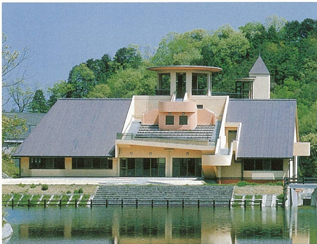
みなくち総合公園子どもの森（甲賀市）