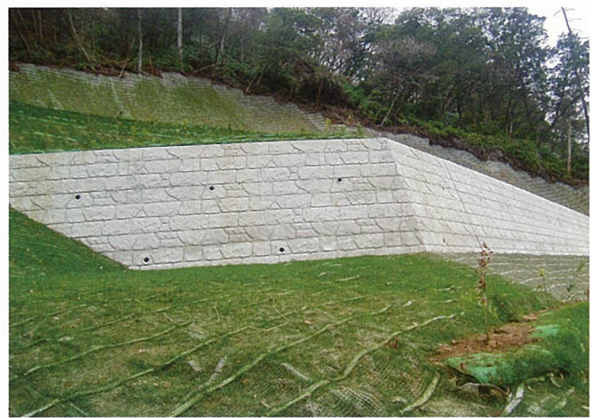
復旧治山工事(栗東市)