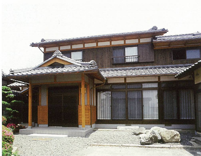
甲賀市水口町 T様邸