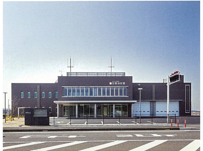
日野消防署（日野町）