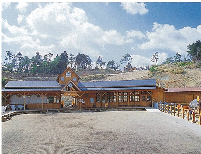
小さなのんびり牧場