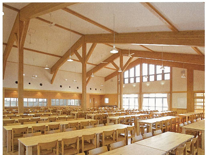
豊日中学校ランチルーム（豊郷町）