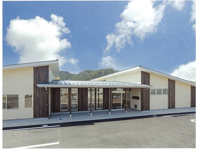
グループホームまごころ・土山 (甲賀市)