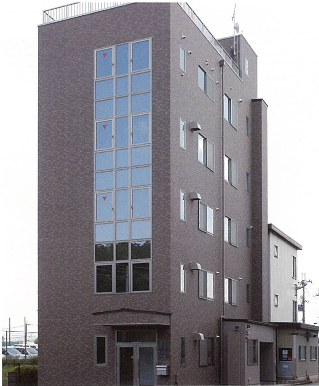
イチイ産業 (甲賀市)