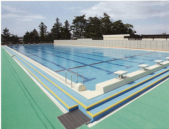
日野中学校プール（日野町）