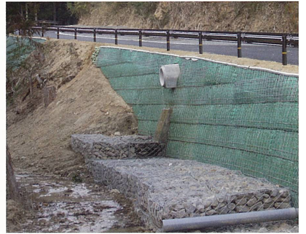
野洲川ダム(甲賀市)