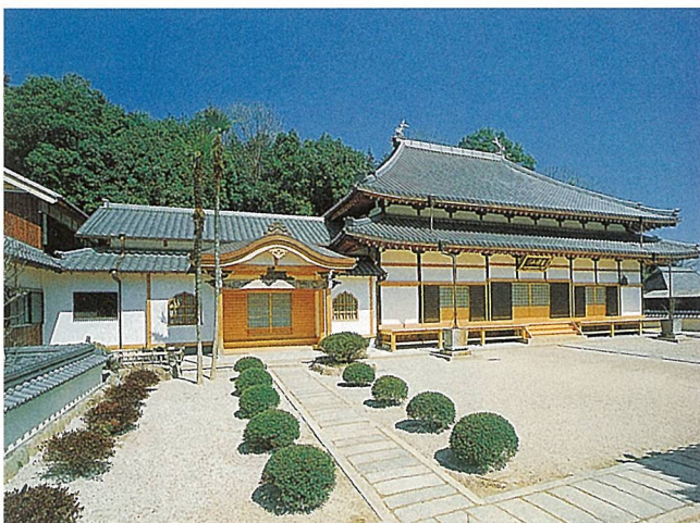
玉龍寺改築工事(三重県)