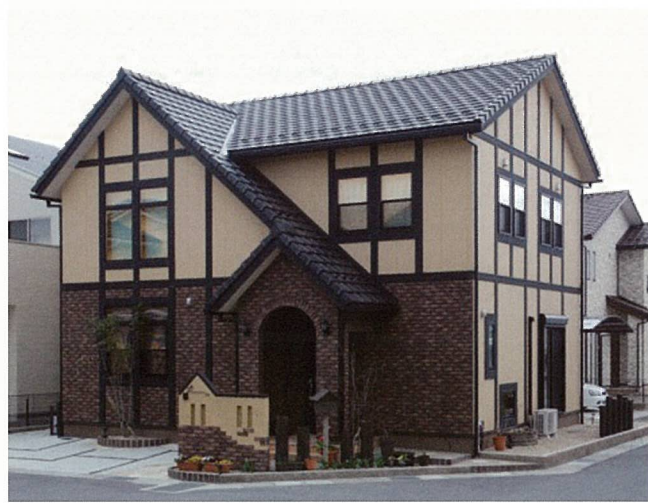
甲賀市水口町 K様邸