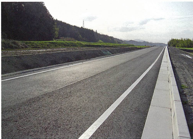
県道和野嶺峨線 道路整備(甲賀市)