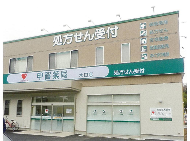
レークメディカル調剤薬局 (甲賀市)