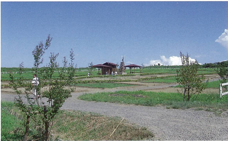
モクモク市民農園(三重県)