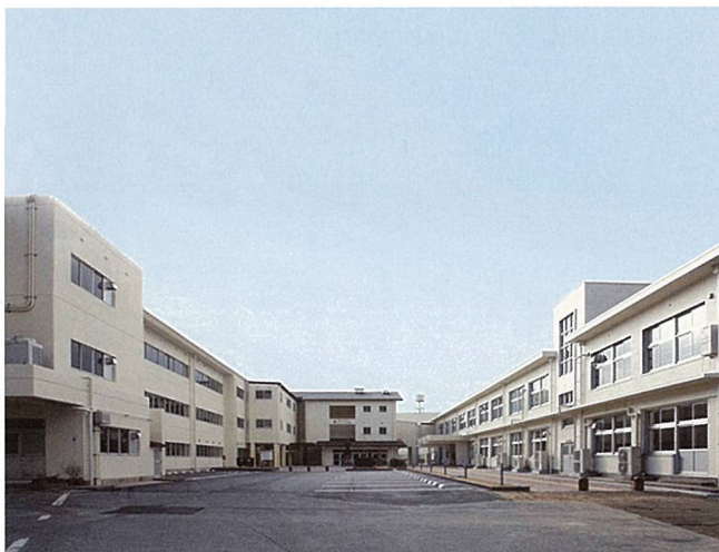
三上小学校（野洲市）