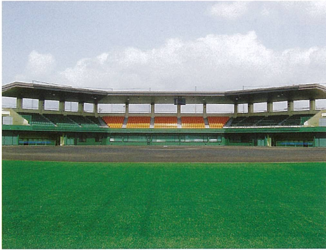
甲賀市民スタジアム（甲賀市）