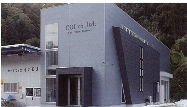
株式会社COI事務所 (甲賀市)