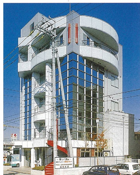
プライムスポット (甲賀市)