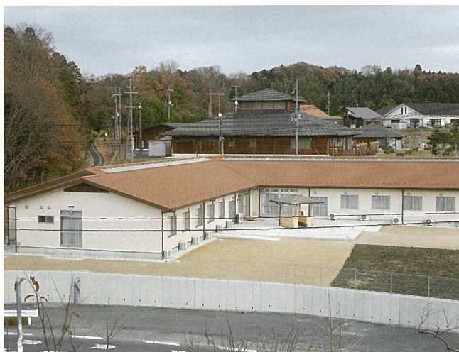
グループホームせせらぎ (甲賀市)