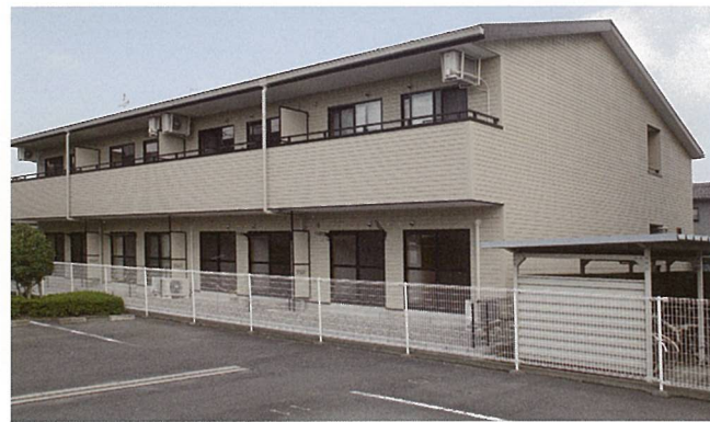
クレールあい (甲賀市)