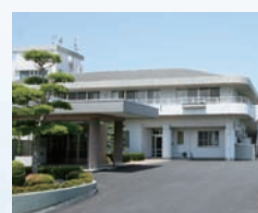
社会福祉法人 今山会 福岡県福岡市西区田尻2705-1 TEL 092-806-8822 FAX 092-806-9001 http://www.imyamakai.or.jp/