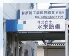
株式会社 水栄設備 福岡県糸島市二丈武118-3 TEL 092-323-4606 FAX 092-323-5892 http://www.suieisetsubi.com/