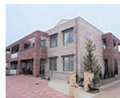
株式会社 新希望 福岡県糸島市南風台7-1-7 TEL 092-324-9600 FAX 092-329-0024 http://www.117294.jp/