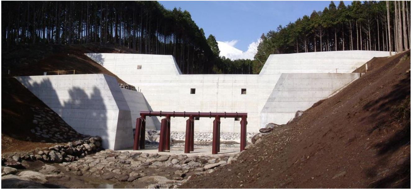
富士山凡夫第1えん堤工事 平成16年 3月完成