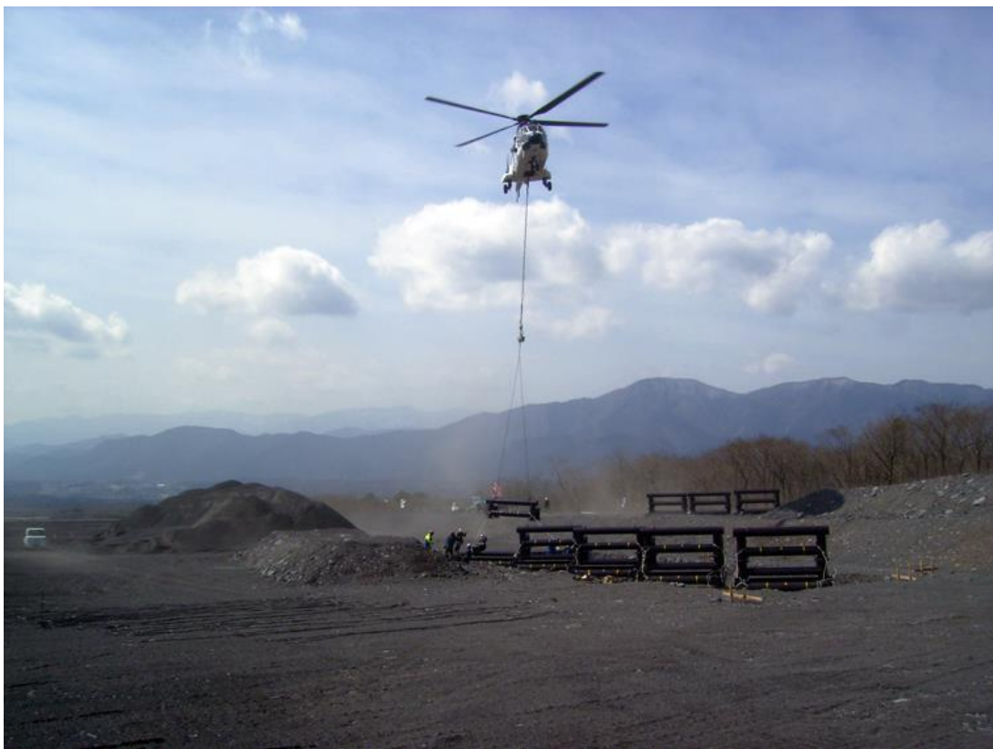
富士山火山防災調査工事 平成 2 2 年 3 月完成