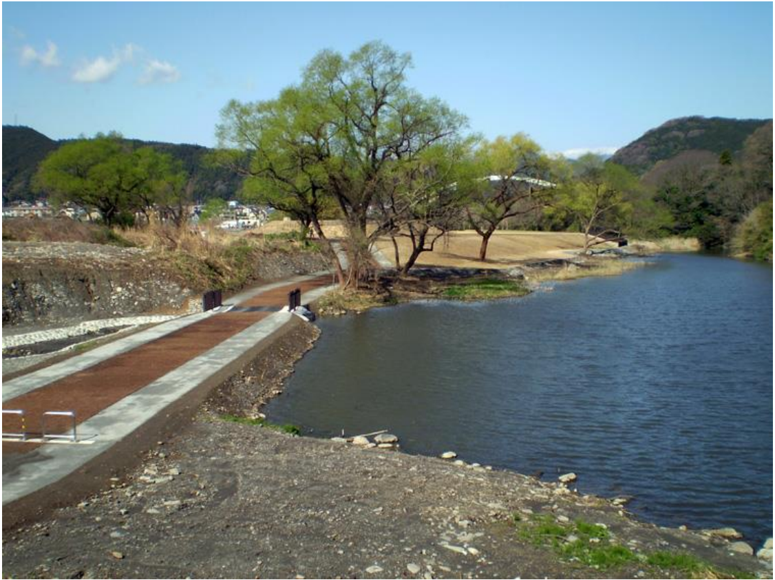
沼久保環境整備工事（富士川） 平成21年 3月完成