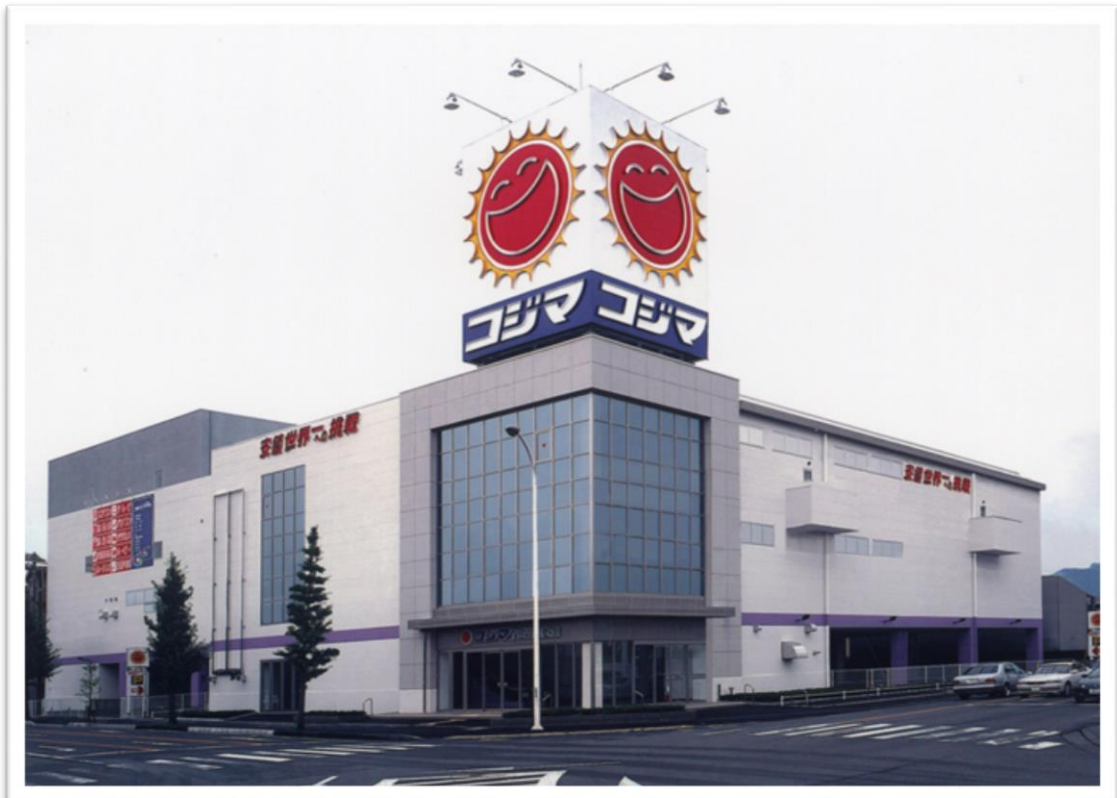
コジマNEW富士店新築工事 平成17年 9月完成