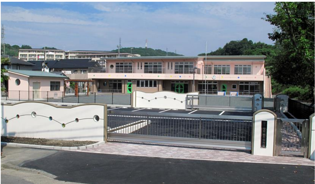
富士市立岩本保育園改築主体工事 平成22年 9月完成