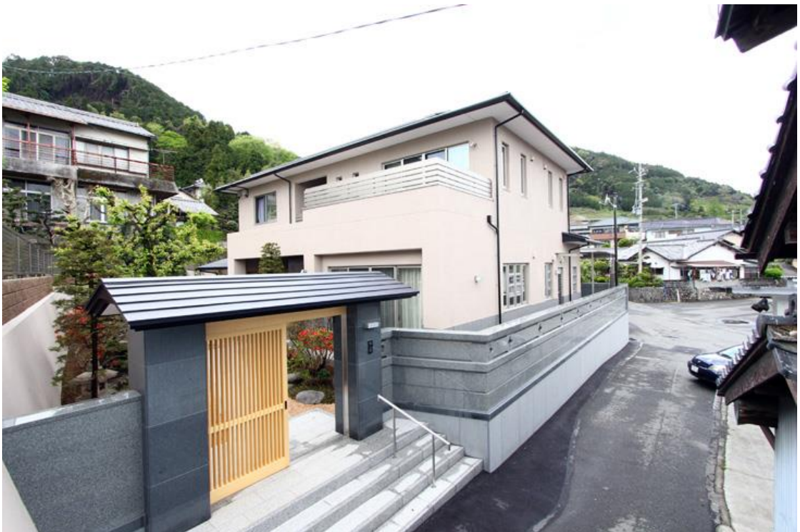
佐藤邸新築工事 平成24年 4月完成