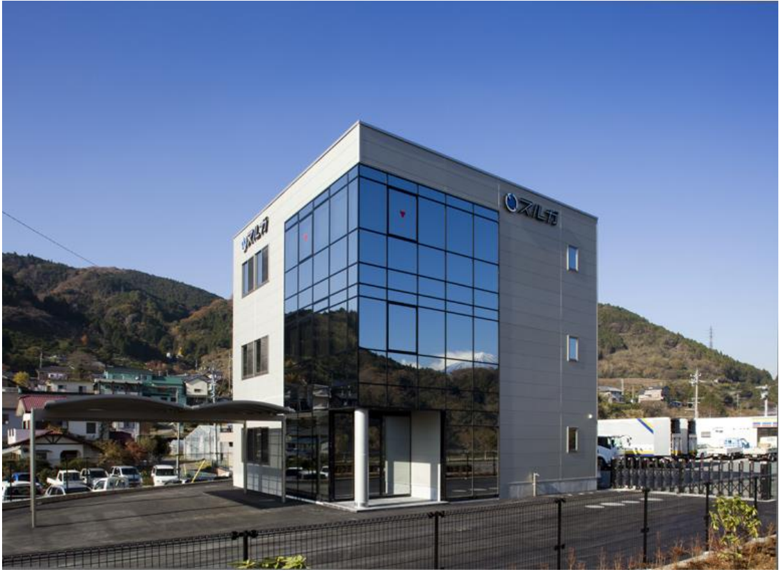
スルガ新社屋新築工事 平成23年12月完成