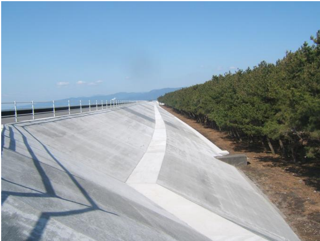
H 2 1 富士海岸柏原地区堤防被覆工事 平成 2 2 年 3 月完成