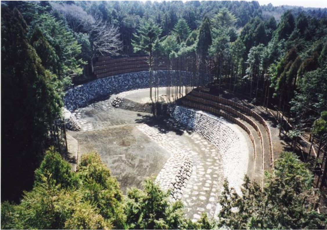
富士山足取川溪流保全工工事 平成14年 3月完成