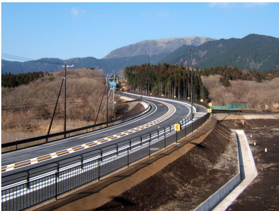
平成 17 年度富士管内道路整備工事(国道 1 3 9 号根原) 平成 1 8 年 1 2 月完成