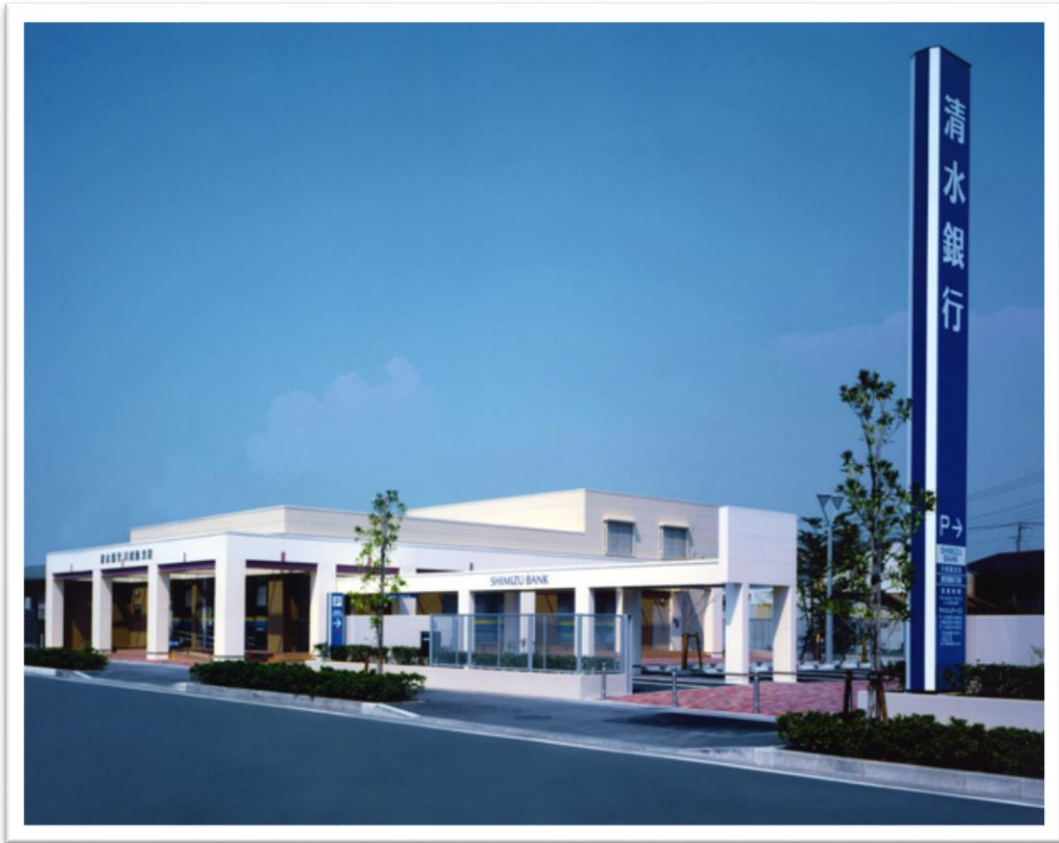
清水銀行川成島支店新築工事 平成11年 8月完成