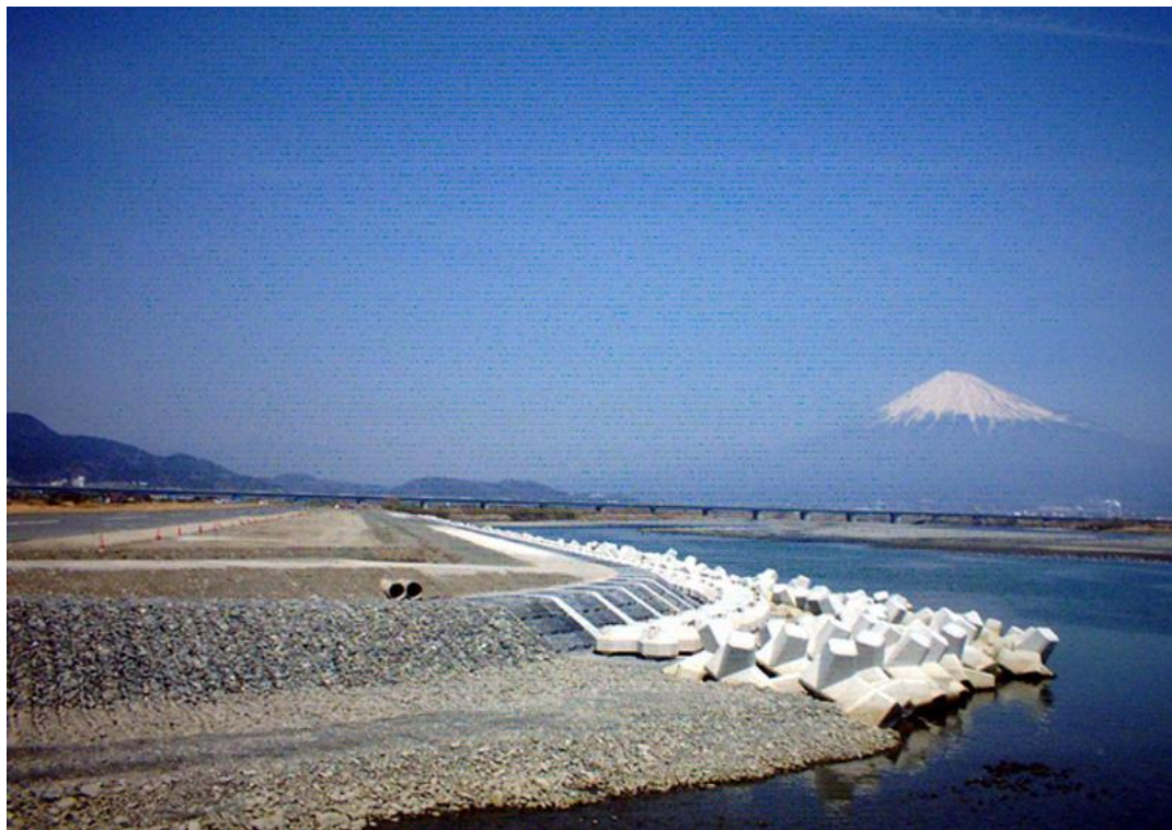
蒲原護岸災害復旧工事 平成17年 5月完成