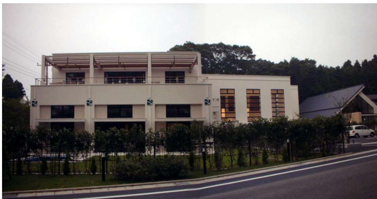
ブヶ東海御殿場新築工事（結婚式場） 平成18年7月完成