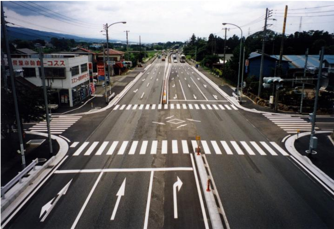
国道246号矢場居交差点改良工事 平成14年 6月完成