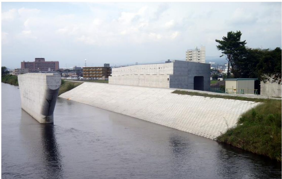
平成20・21年度国道139号 蓼原高架橋下部工事 平成21年8月・平成22年9月完成