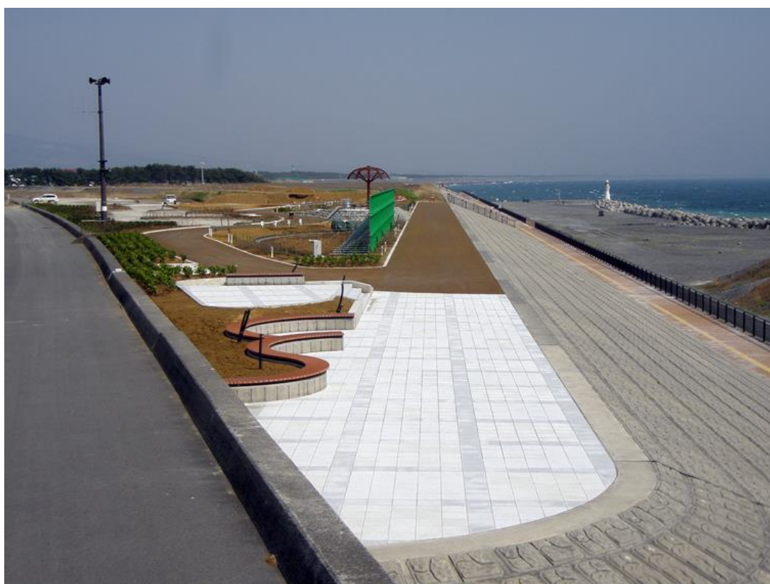
H 1 9 田子の浦港富士緑地整備工事 平成 2 0 年 3 月完成