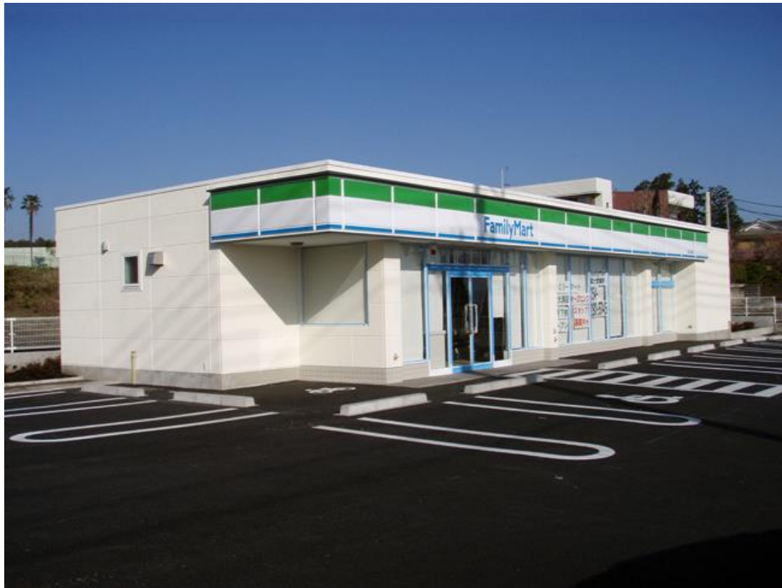
ファミリーマート富士大淵店新築工事 平成21年 3月完成