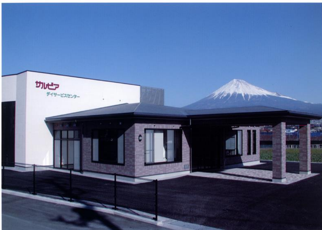
駅北デイサービスセンター（カルビア）新築工事 平成14年12月完成