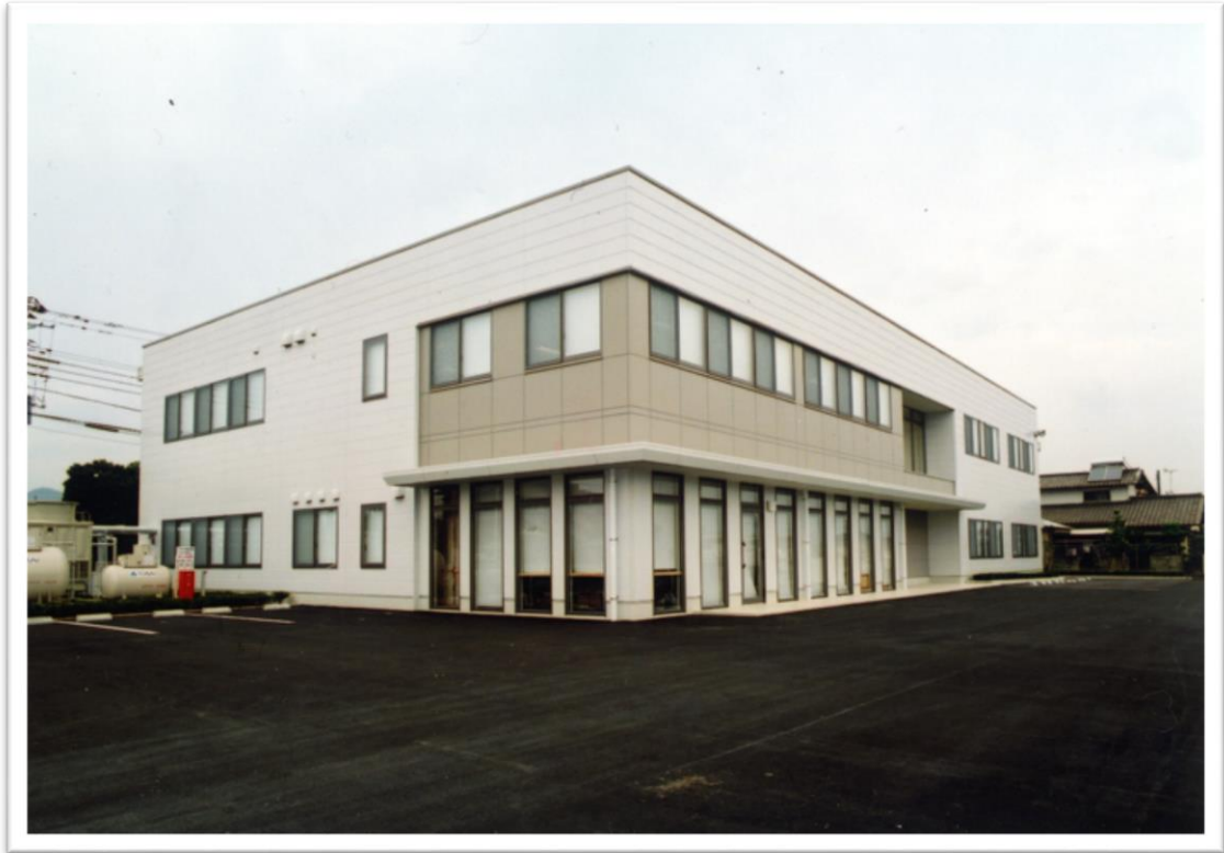
TOKAI 新富士支店新築工事 平成17年 9月完成