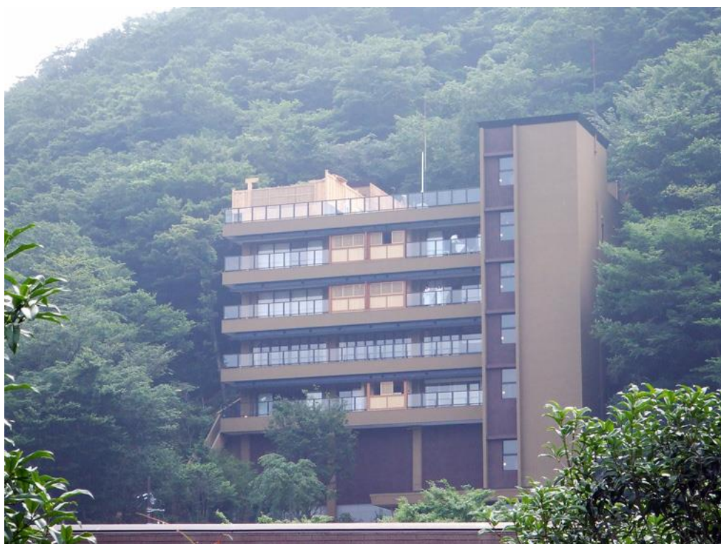
箱根 時の雫改修工事（建築工事） 平成18年 6月完成