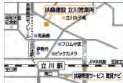
扶桑建設・立川営業所 扶桑管理サービス・賃貸ナビ ご案内図