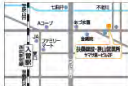
扶桑建設・狹山営業所 ご案内図