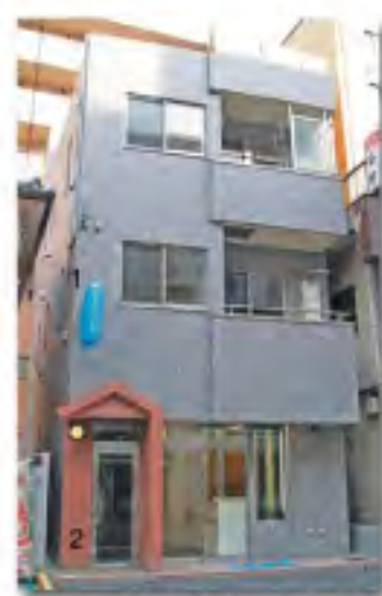
狭小立地・店舗併用