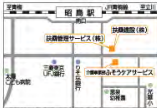
扶桑建設・扶桑管理サービス・ふそくケアサービス ご案内図