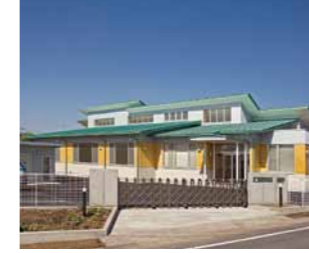
住宅・マンション