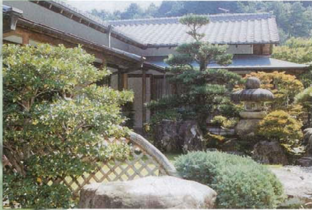
◀ 浅野邸 入賞作品