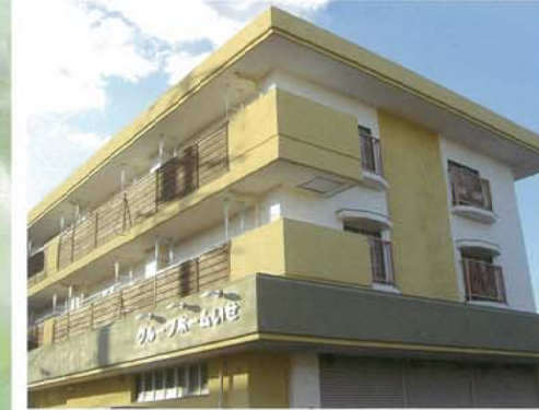
▶ グループホームいせ