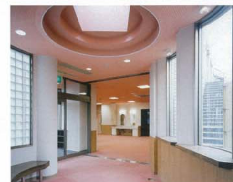
御薊老人福祉施設 外観と内部 ▲▶