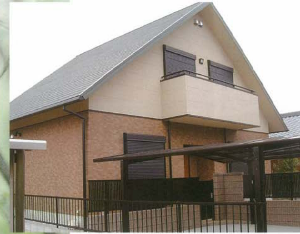
◀1階鉄筋コンクリート・2階鉄骨造