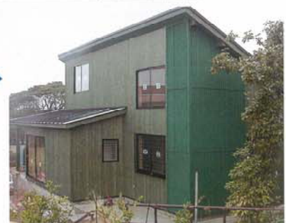
▶ Y邸 別荘地に建つセカンドハウス