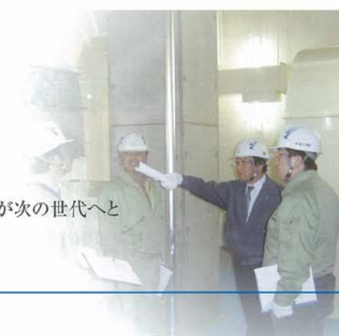
宮川浄化センター第1プロワー棟 ▼▶

住みよい私たちの街、利用する人たちが安心して快くふれあえ、その笑顔が次の世代へと 繋がっていく様な公共施設を造ることを心がけています。