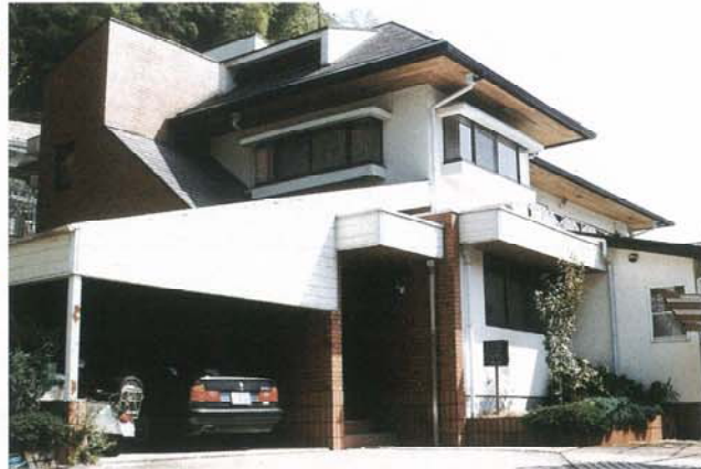
▶ 平田邸 入賞作品