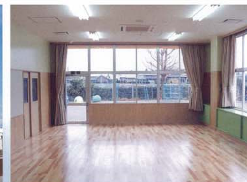
◀▲小俣町保育園 外観と内部