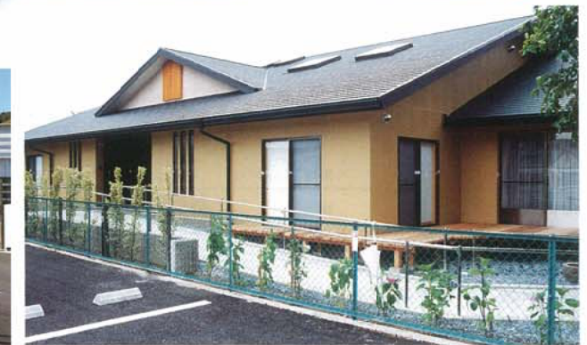
▶ グループホーム一色