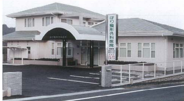
▶ ほり整形外科医院 入賞作品