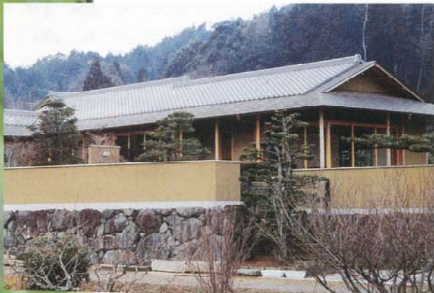
◀ 伊勢旭町の家 入賞作品