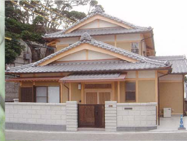
◀ U邸 入母屋屋根の本格和風住宅