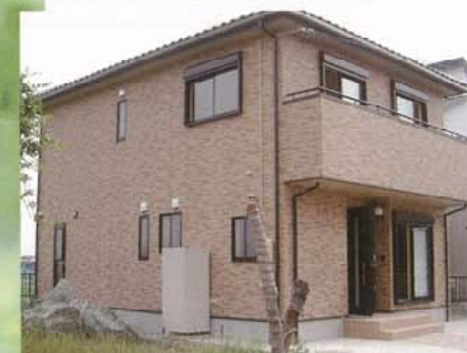
▶ U邸 明るい外壁の機能的な家