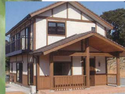
◀ M邸 若夫婦のこだわりの家