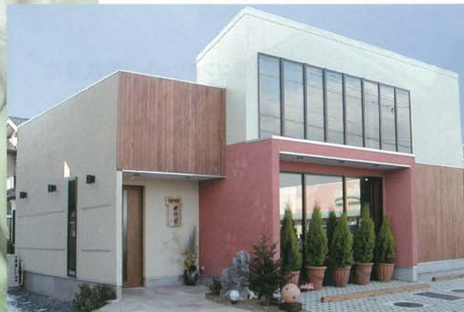
料理工房 縁彩 外観と内部 ▲▶