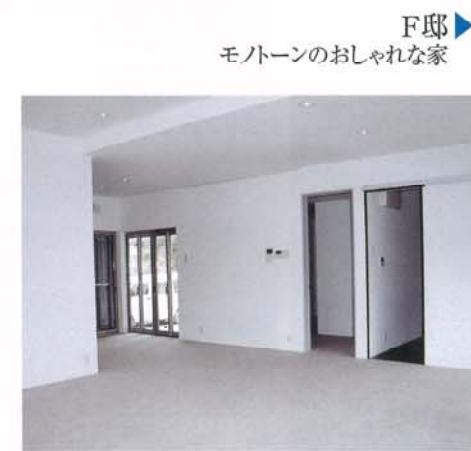
▶ F邸 モダンなおしゃれな家