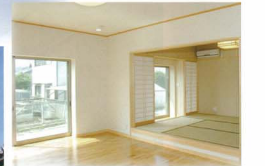
◀モデルハウス 1階鉄筋コンクリート・2階木造