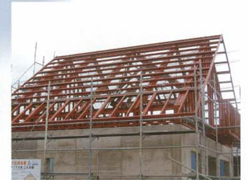
1階鉄筋コンクリート・2階鉄骨造 壁全体で家を支える中間無柱工法