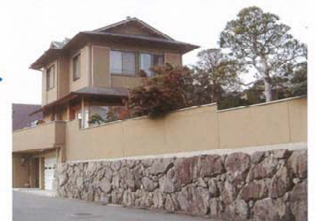
▶ A邸 外構にマッチした家