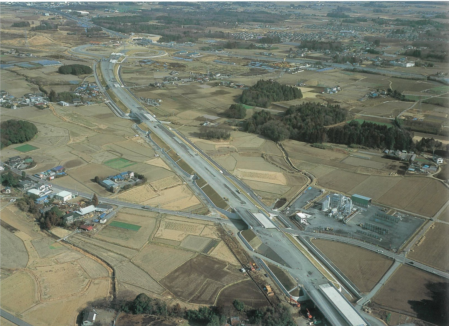
北関東自動車道宇都宮東