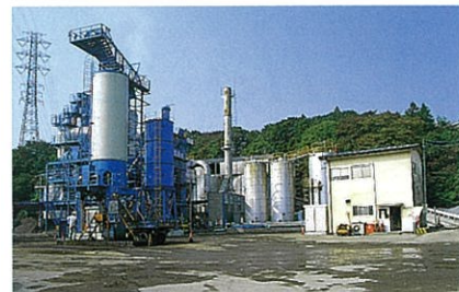
宇都宮アスファルト合材工場