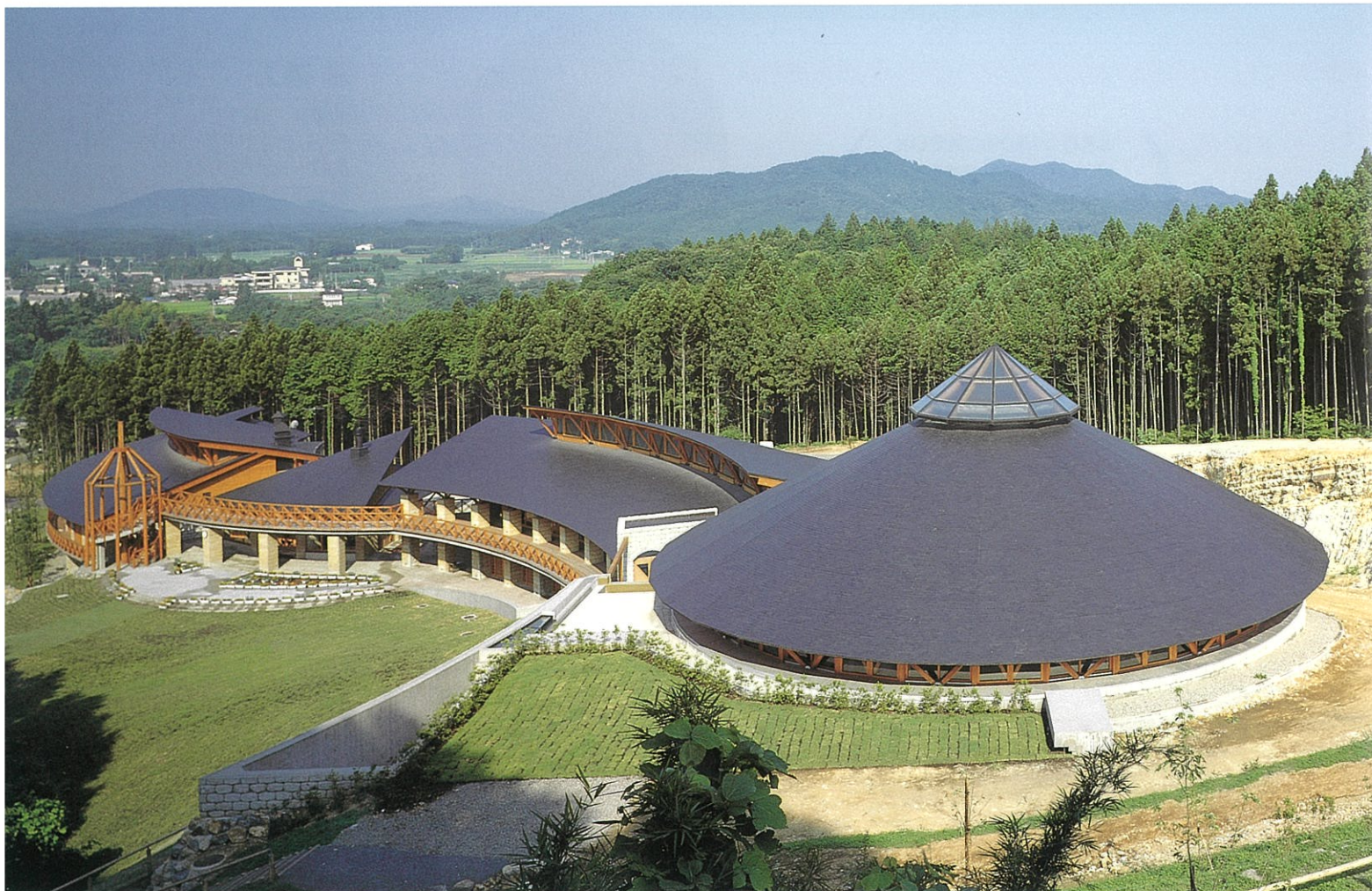
うつのみや平成記念子供のもり公園センターハウス