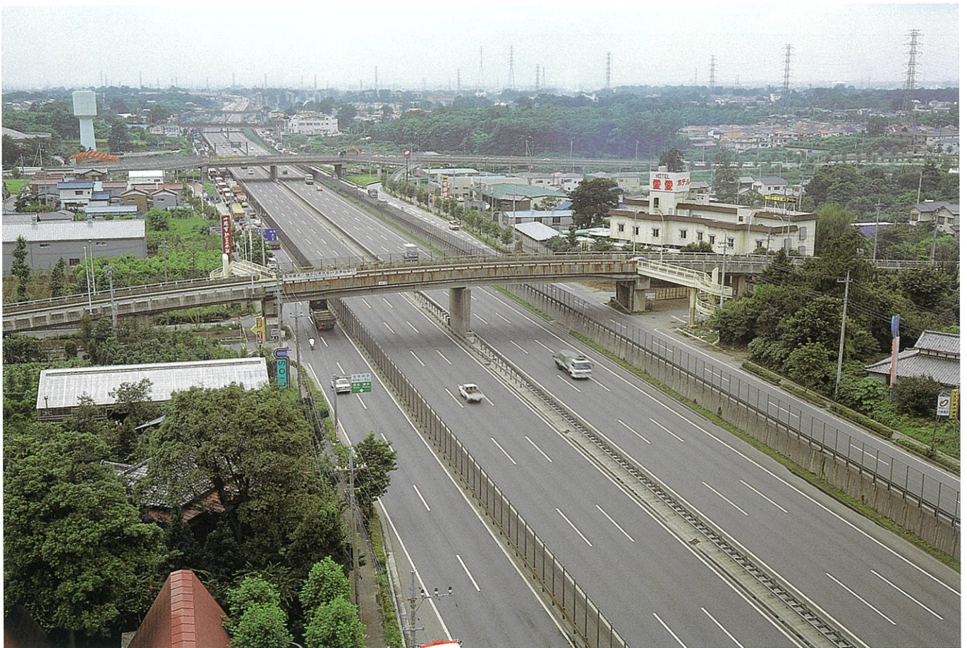
東北自動車道・浦和～川口舗装（東北道～首都高速連結区間）