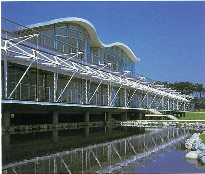
システムソリューションセンターとちぎ 本社社屋