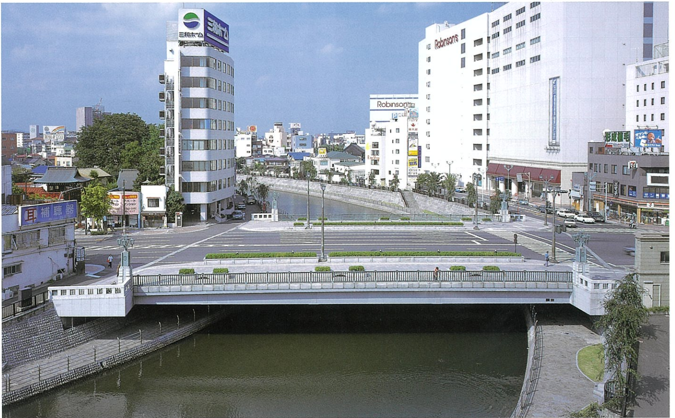
宇都宮市大通り 宮の橋