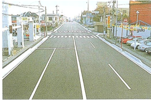
国道4号排水性舗装

【舗装】 社会の発展と共に、複雑かつ高速化する交通網。当社では創業以来積極的な活動を展開し、県内はもとより、東北自動車道を始めとする関東一円の舗装工事を数多く手掛けてまいりました。その高い技術力と品質管理、そして舗装工事にかける情熱は他社の追従を許しません。