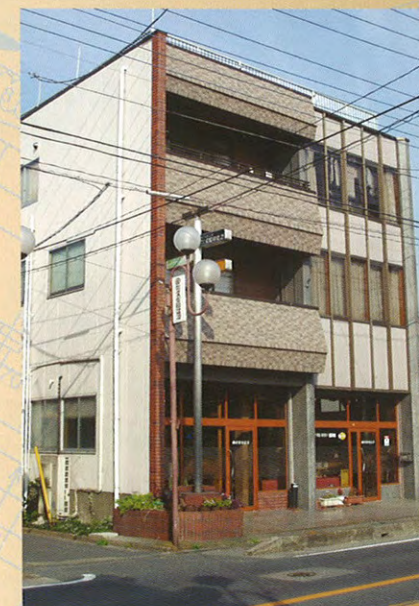
(株)久保田建設事務所

また、土木工事では宅地の造成や下水道工事、官公庁発注の管路施設工事、治水対策河川工事、舗装工事、橋梁築造、駐車場工事等に従事しております。