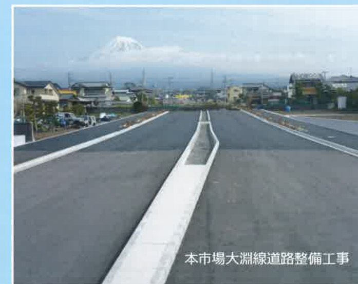
本市場大淵線道路整備工事