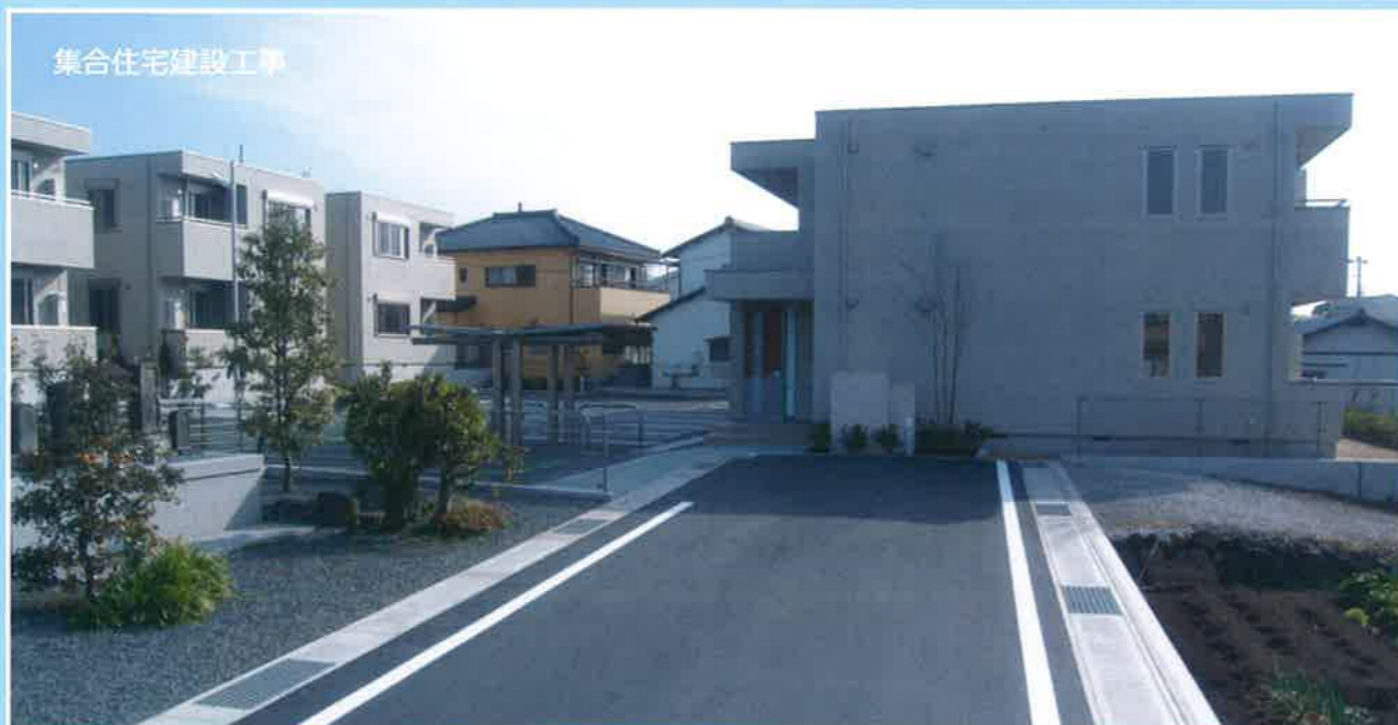
集合住宅建設工事