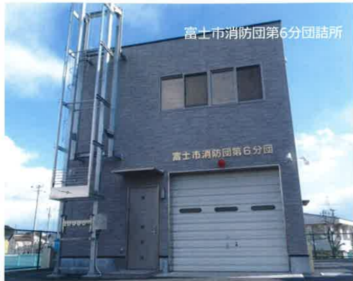
富士市消防団第6分団詰所