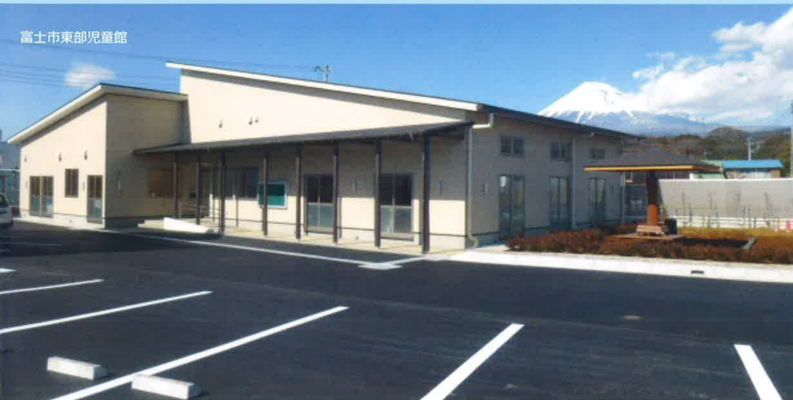
富士市東部児童館