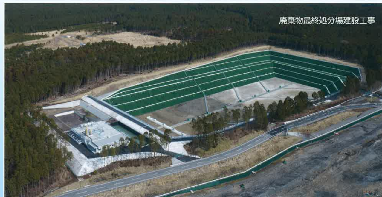
廃棄物最終処分場建設工事