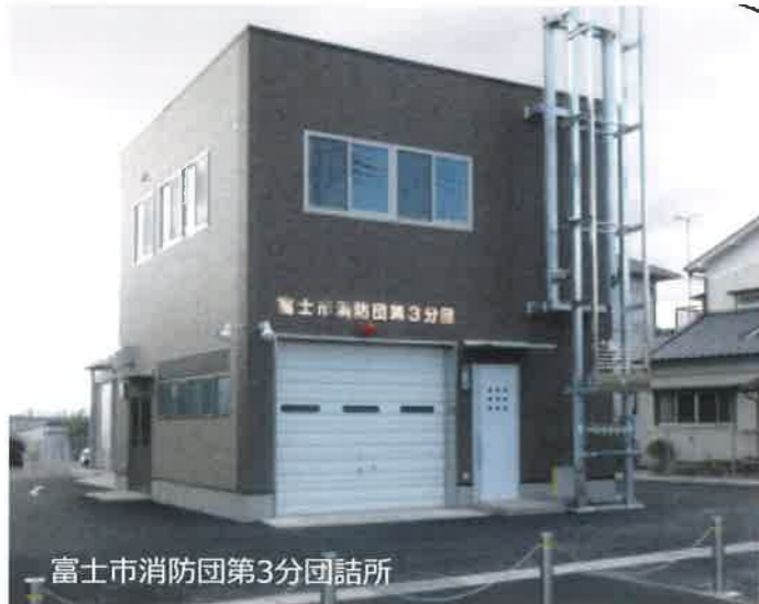
富士市消防団第3分団詰所