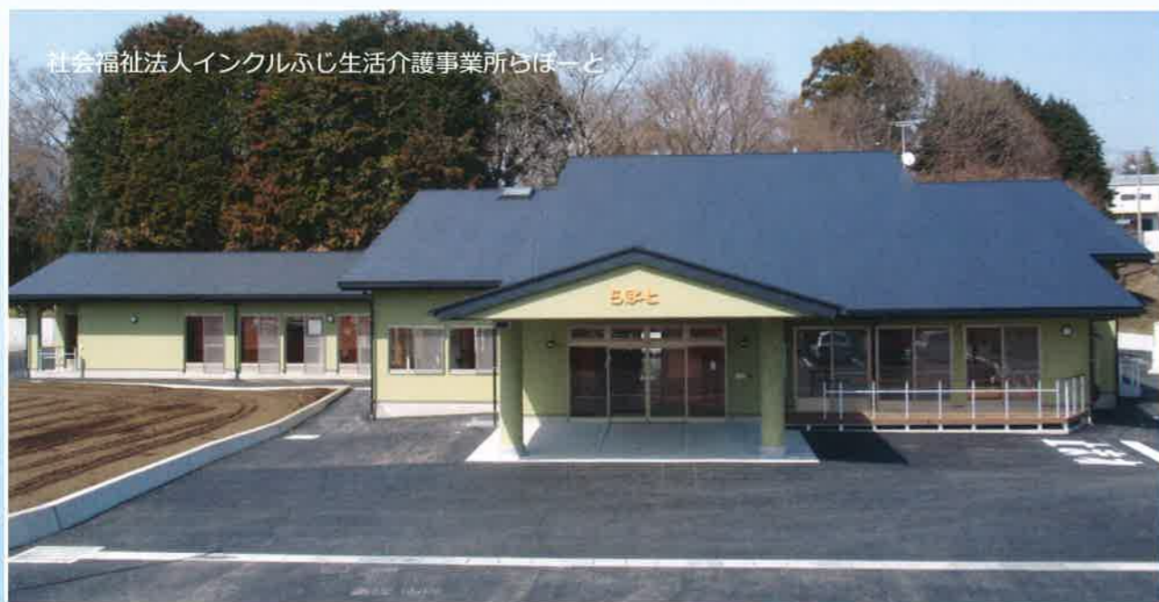
社会福祉法人インクルふじ生活介護事業所らぼーと