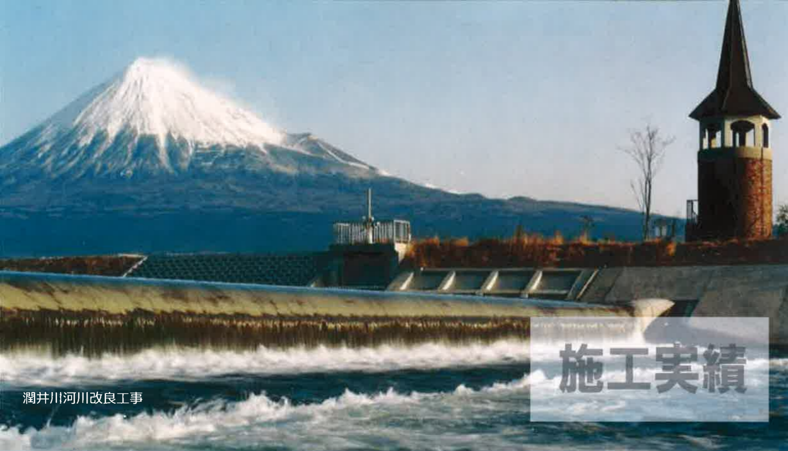
潤井川河川改良工事