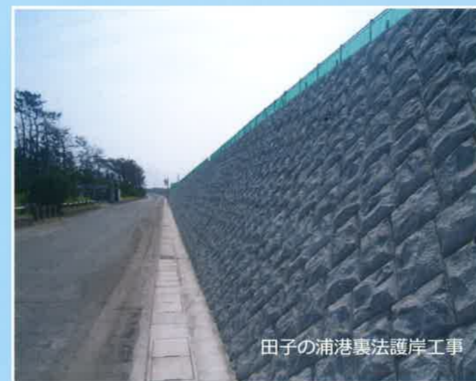
田子の浦港裏法護岸工事