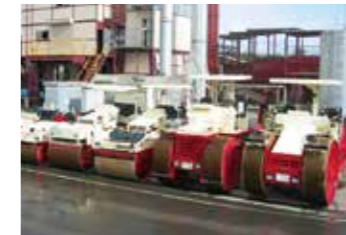
マカダム、タンデムローラ(転圧する機械)