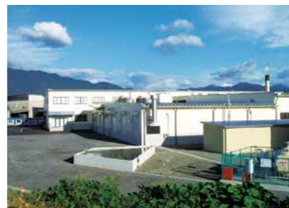
食品製造工場(揖斐川町)