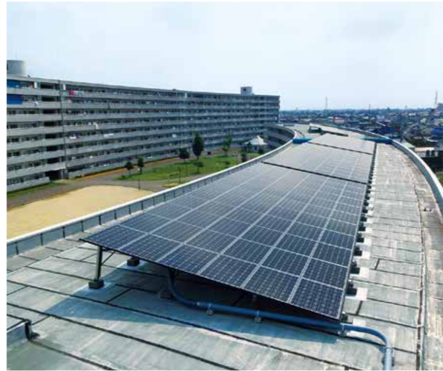
松竹住宅(愛知県江南市)