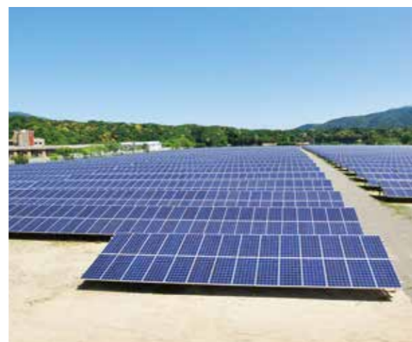
メガソーラーいなべ(三重県いなべ市)

地元密着の企業として、地域環境の発展に取り組んでおり、太陽光発電事業を皆様に広くご提案出来る事は、私たちにとっての誇りです。これからも責任ある施工・販売を続けていき、ハウスエネルギーソリューションを中心に、「環境」「リサイクル」事業をより一層育てていきたいと考えています。