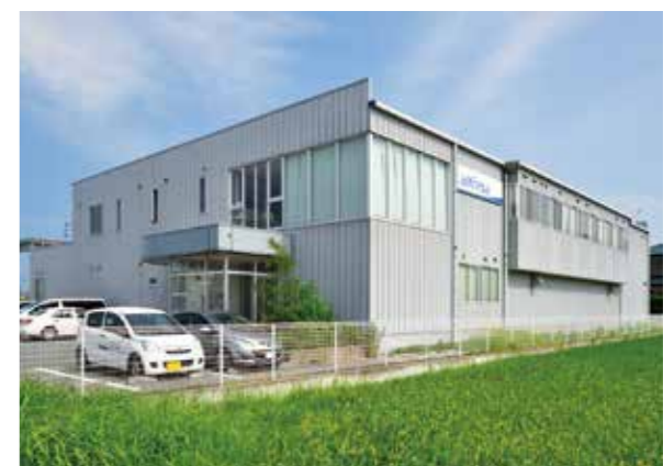
医薬品卸流通センター(三重県津市)