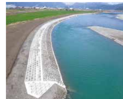
国土交通省 木曾川上流 / 揖斐川白鳥護岸 (池田町)