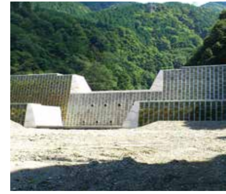
岐阜県／足打谷えん堤 (揖斐川町)