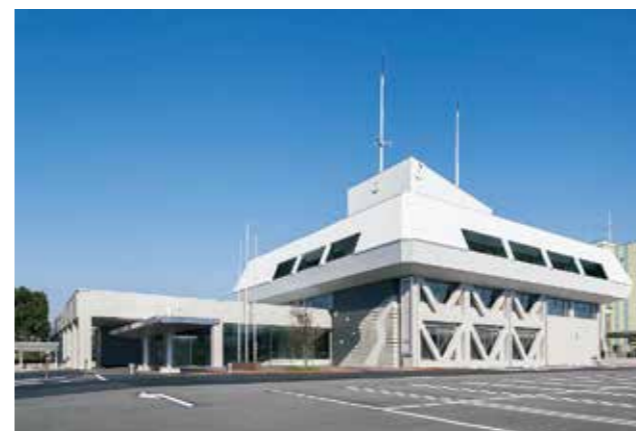
海津市統合庁舎(海津市)