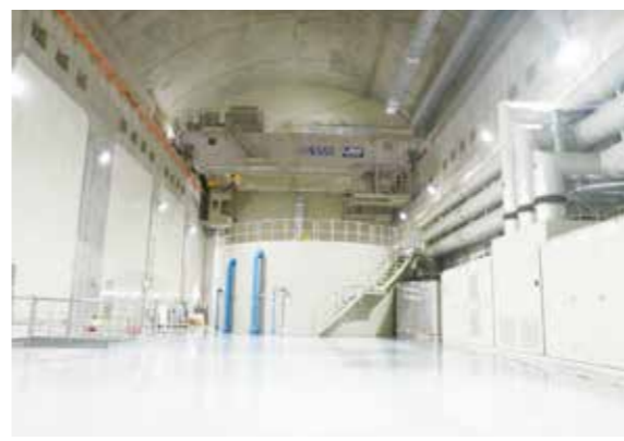
中部電力(株)／徳山地下(発) (揖斐川町)