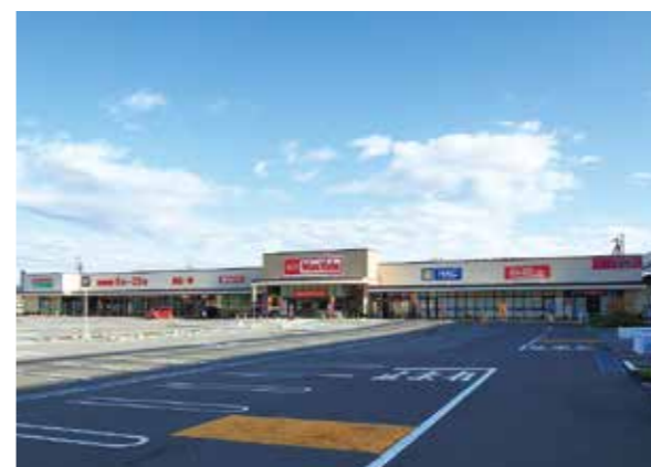
大矢知開発事業(三重県四日市市)