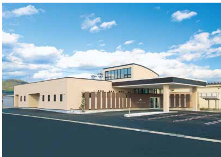
セレモニーホールむらき(大野町)