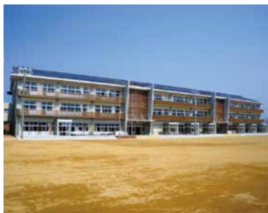
池田町立八幡小学校(池田町)