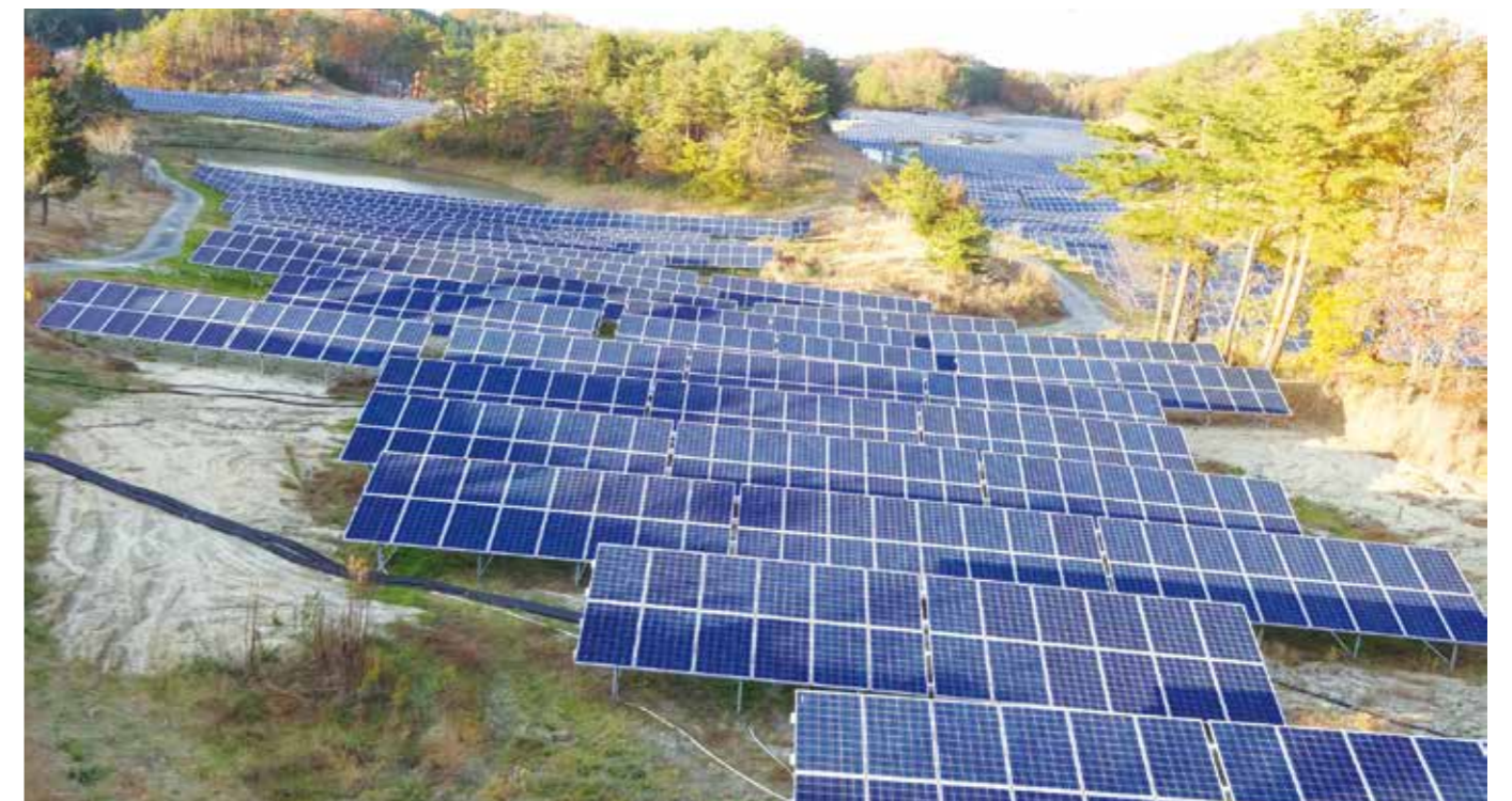
ロンググランドスクリュー杭

グランドスクリューは、コンクリート基礎に代わる鋼管スクリュー杭です。地上設置の太陽光施設で、基礎杭として日本全国で採用されています。特長として、SPEEDY(スピーディー)・STRONG(ストロング)・COMPACT(コンパクト)・ECOLOGY(エコロジー)・LOWCOST(ローコスト)が挙げられます。