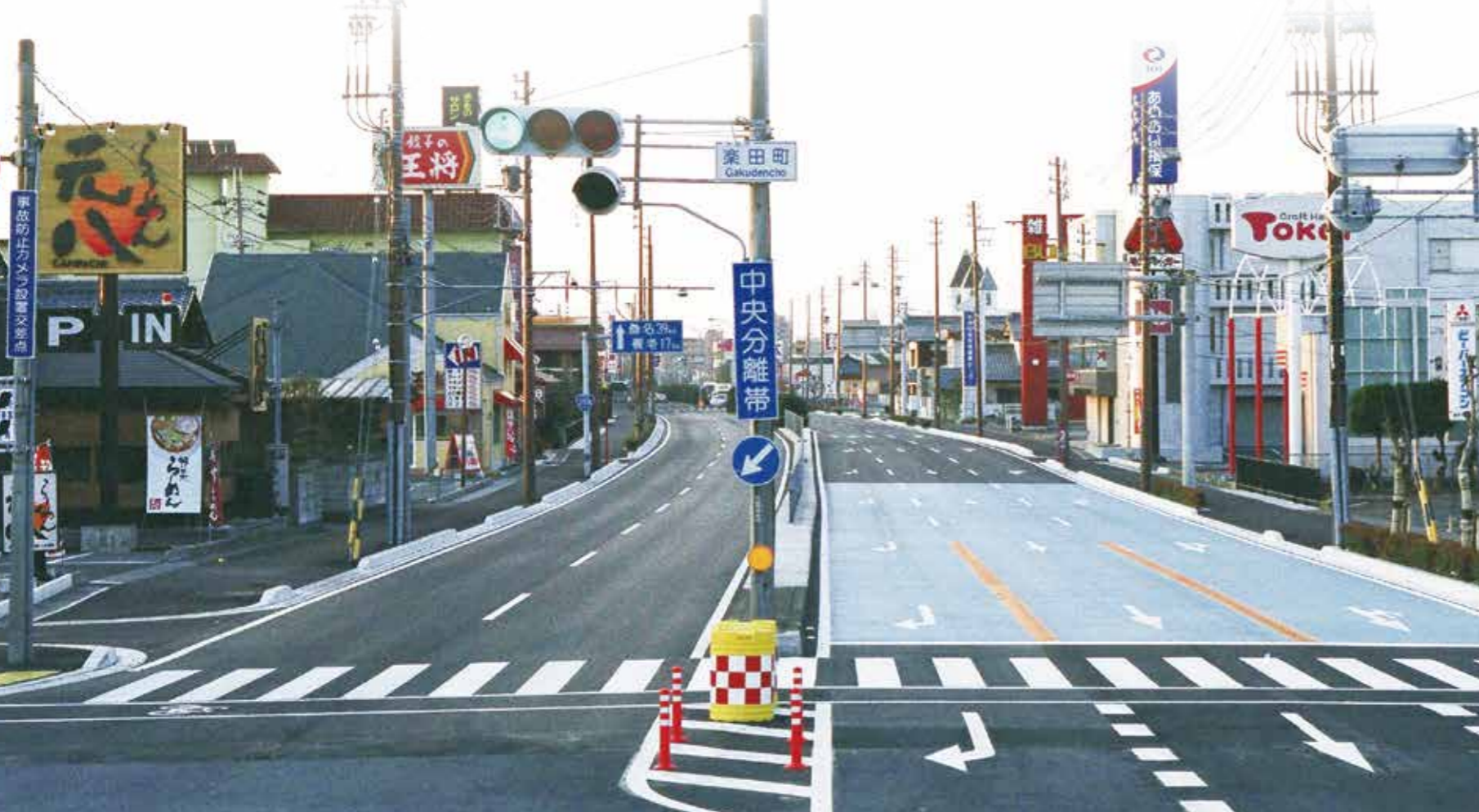
国道258号林町(大垣市)

都市景観や自然環境に配慮した 舗装技術を開発し、全国へ向けて ノウハウや最新情報を発信しています。