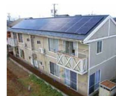
共同住宅 鉄骨造(大垣市)