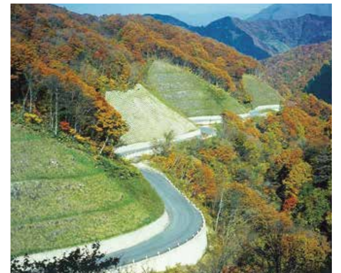
大規模林道 関ヶ原八幡線(揖斐川町)