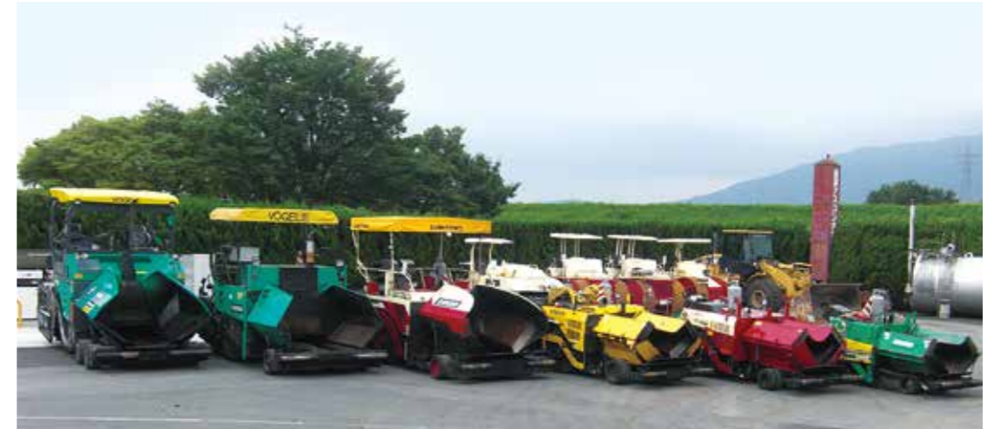
アスファルトフィニッシャー(合材を敷均す機械)