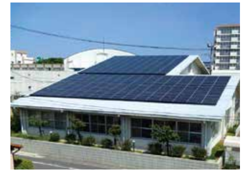
楠図書館(愛知県名古屋市)