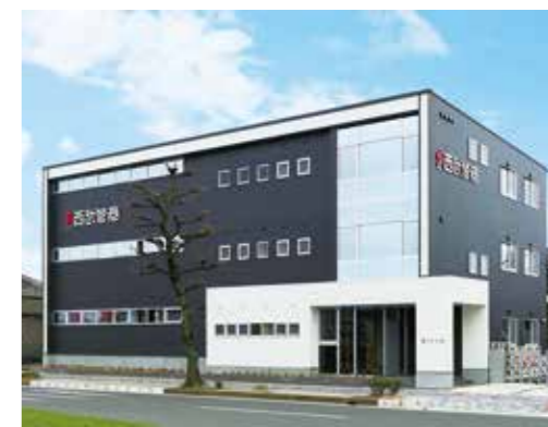
(株)西武管商 一宮支店(愛知県一宮市)