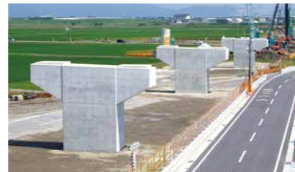
東海環状高田下部 (養老町)