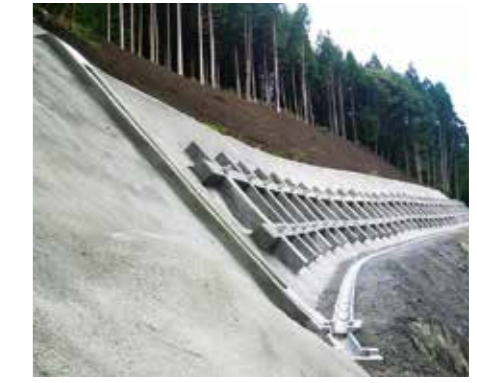
岐阜県／上ヶ流法面 (揖斐川町)