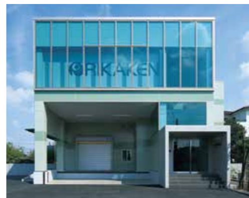
理科研(株)岐阜営業所(岐阜市)