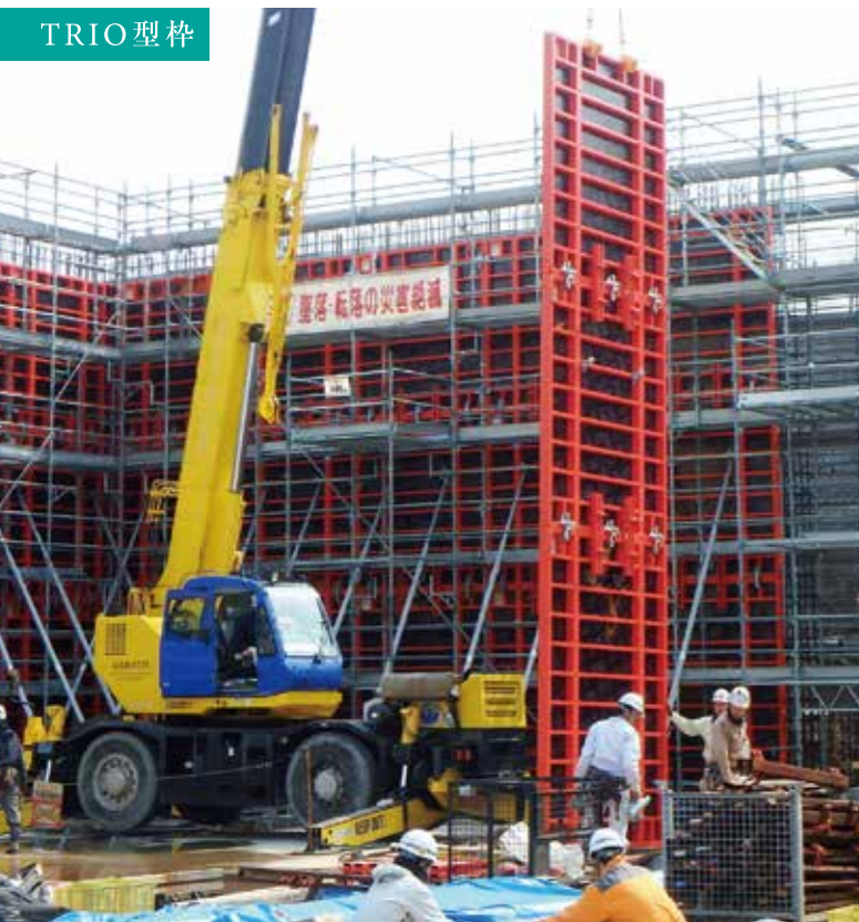
TRIO型枠 西濃環境整備組合／廃棄物最終処分場(大野町)

最小部材で施工可能なシステム型枠。生産性(1人当りの施工量)が大幅に向上し、更には安全性・工期の短縮を実現する「現場を変えるシステム」です。国家的大型プロジェクトに提案しています。