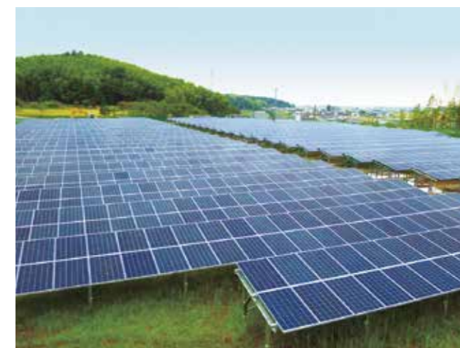
山添(三重県松阪市)