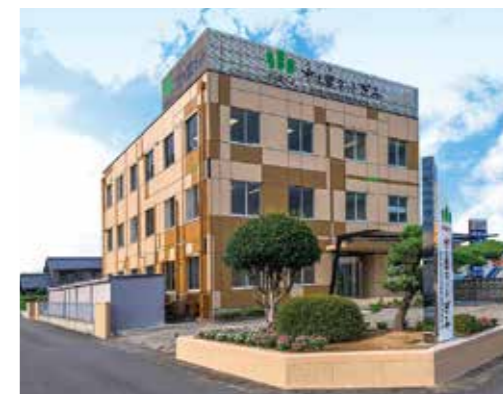
県土連ビル(岐阜市)