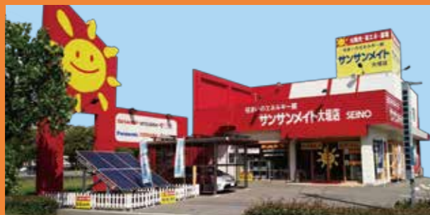
サンサンメイト大垣店