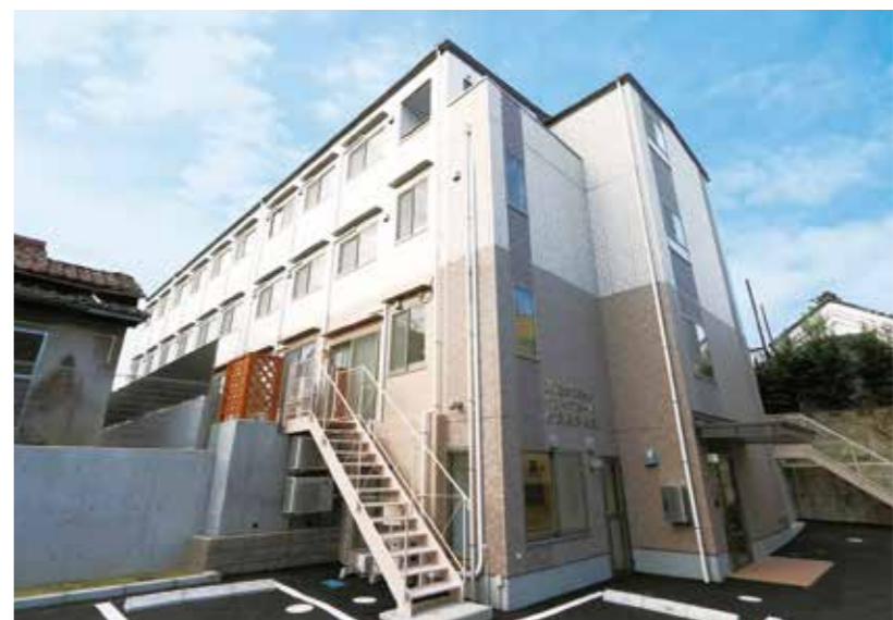
(株)サカイグループホームあじさいのまい (愛知県名古屋市)