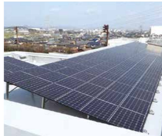
岩倉南部中学校(愛知県岩倉市)