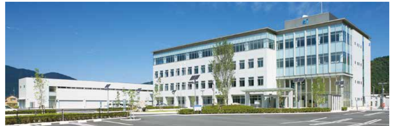
損斐川町庁舎(損斐川町)

西濃建設の建築事業は最適な「技術力」を駆使し、時代のニーズに合った地球環境に優しい街づくりをカタチにしています。