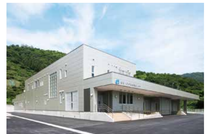
損斐川町学校給食センター(損斐川町)