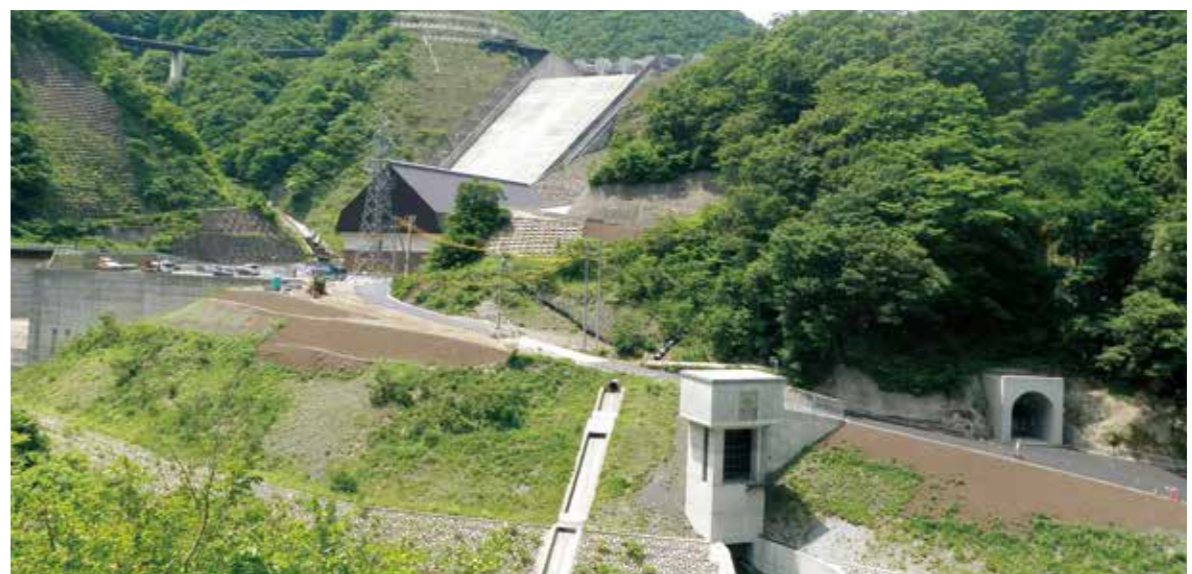
中部電力(株)／徳山地下(発) (揖斐川町)