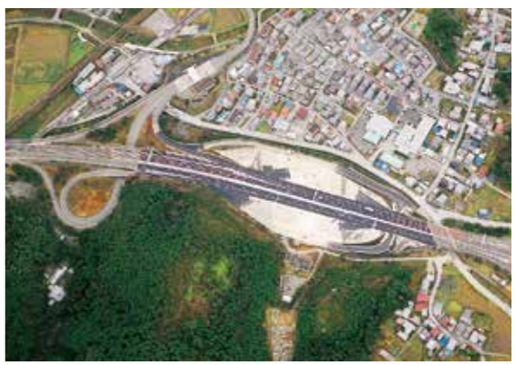
NEXCO中日本／米原JCT改良(滋賀県米原市)