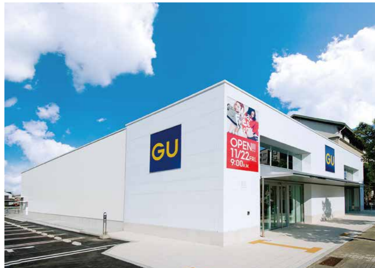
岐阜茜部開発事業(岐阜市)