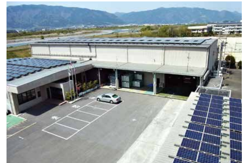
(株)東洋スタビ(大野町)