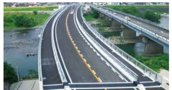
岐阜県／新岡島橋 (揖斐川町)

事前に橋脚間の上部桁をワイヤーソーにて切断します。右岸左岸の施工ヤードには、大型のクレーン360tが配置されていますが、両岸から直接吊る事ができない場合(河川上の解体)に、この工法を用います。この工法は、橋脚の張出部に移動式油圧門構クレーンを設置し、切断した上部桁を2か所の吊上げ機にて吊上げ、施工ヤードのクレーンが届く位置まで横移動させることが可能です。油圧式のため、騒音もほぼ無く、河川内作業もないため、周辺及び河川環境にも配慮した工法です。