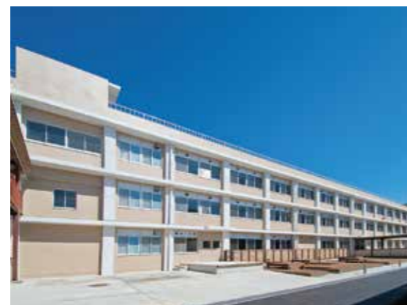
国立岐阜工業高等専門学校(本巣市)