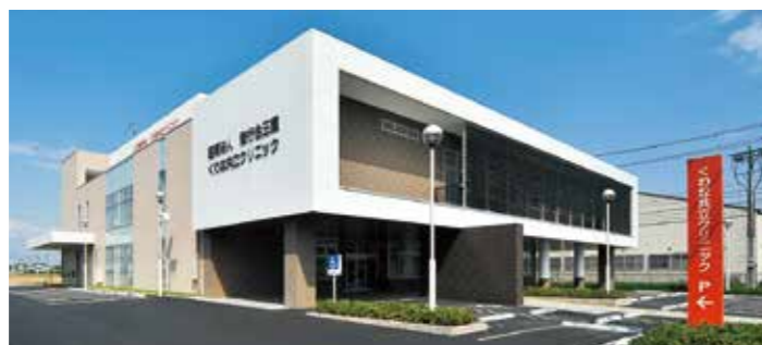
くわな共立クリニック (三重県桑名市)