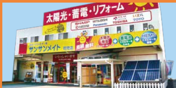
サンサンメイト可児店