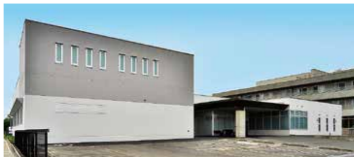
光寿会リハビリテーション病院透析センター (愛知県北名古屋)