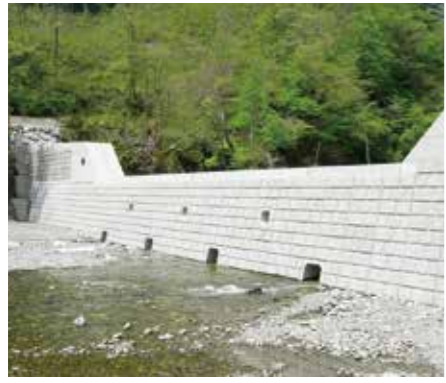
林野庁 岐阜営林署／海ノ溝谷えん堤(関市)