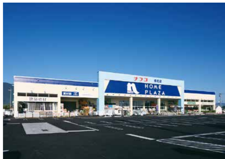
ホームプラザナフコ養老店(養老町)