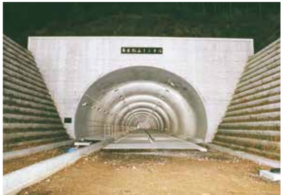
揖斐川町／長良松山トンネル (揖斐川町)