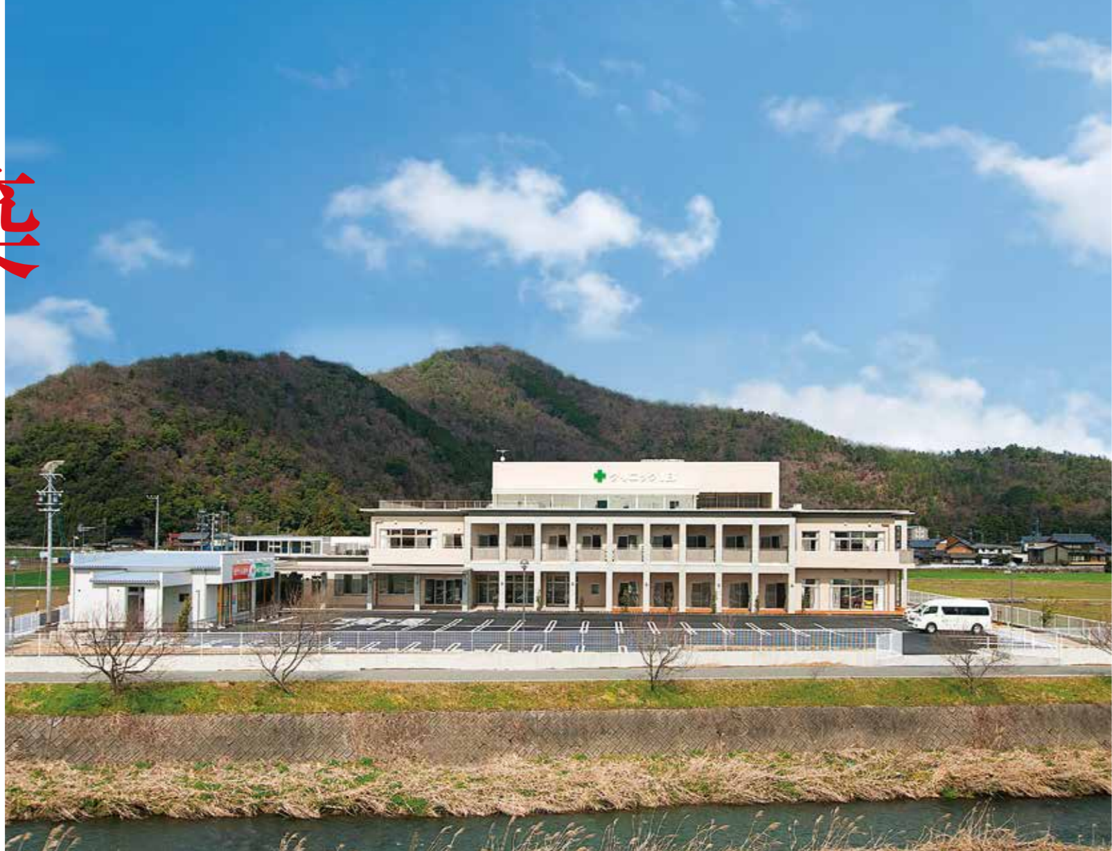
メディカルケアセンターIB・クリニックIB (揖斐川町)

より安全で安心な医療・福祉施設を築き、 人と社会に貢献し続けることをお約束いたします。