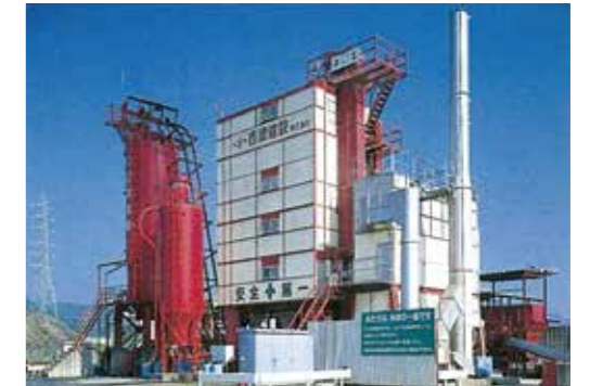
アスファルト合材プラント