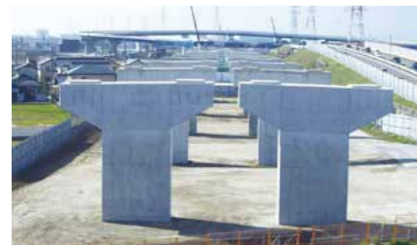
東海環状赤坂下部 (大垣市)