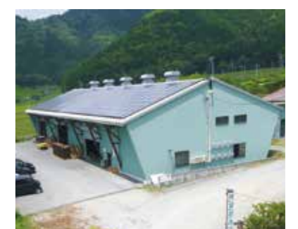
揖斐郡森林組合(揖斐川町)