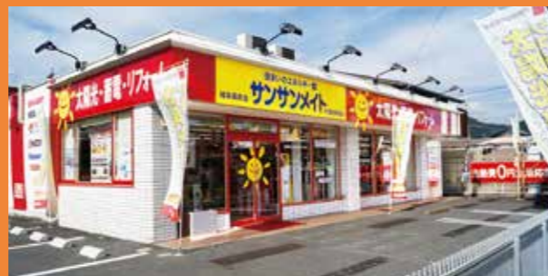
サンサンメイト岐阜長良店