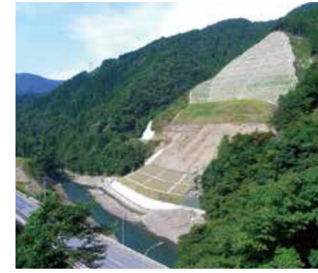
岐阜県／東横山災害復旧 (揖斐川町)