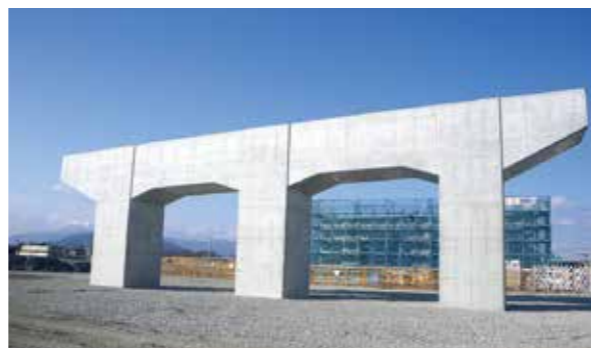
東海環状ヶ島下部 (養老町)