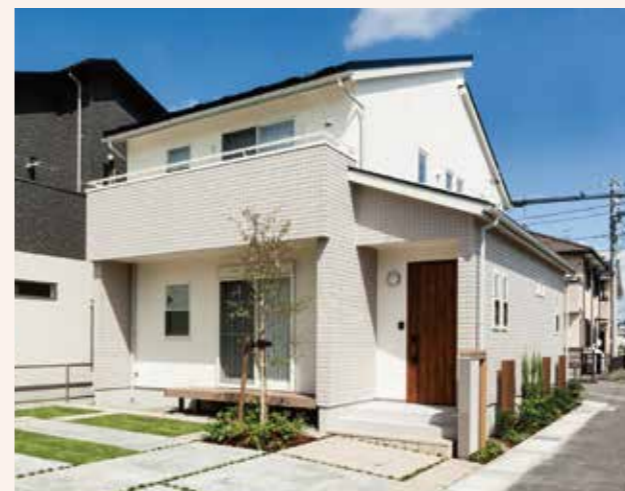
うずらの家(岐阜市)