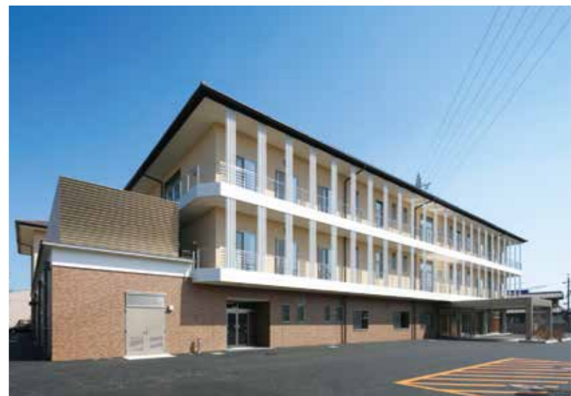
特別養護老人ホーム優・悠・邑 (大垣市)