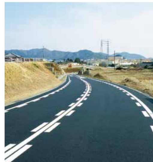
町道33号線(揖斐川町)

これからも、有効利用できる廃材資源の可能性を模索し、環境に配慮した新しい技術の開発に取り組み、幅広い分野、用途への視野に技術を高めていきます。