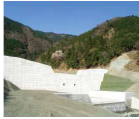
岐阜県／大津谷砂防事業 (池田町)