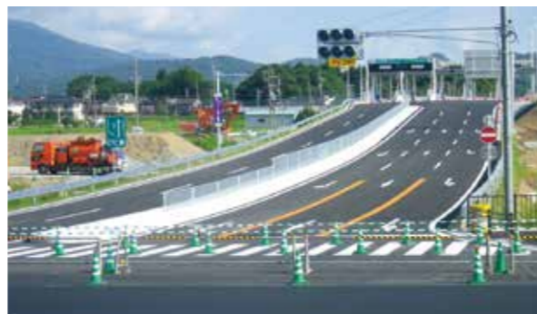
東海環状国道21号 検道路改良 (大垣市)