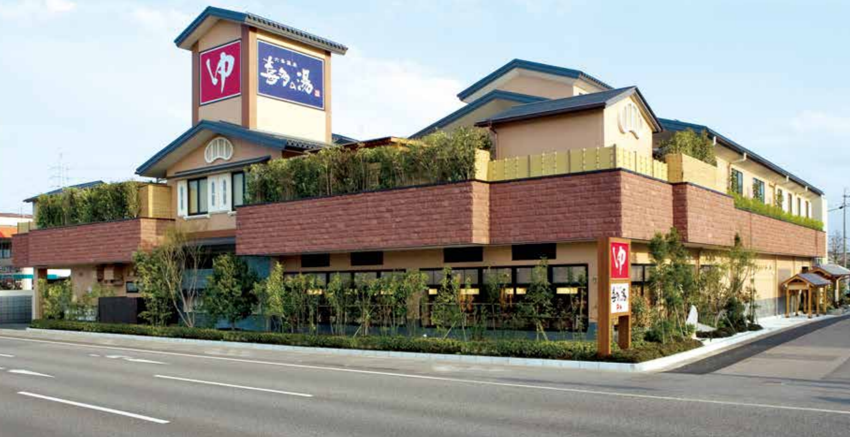
六条温泉 喜多の湯(岐阜市)