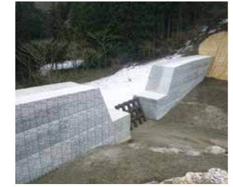
国土交通省 越美砂防／和佐谷えん堤 (揖斐川町)