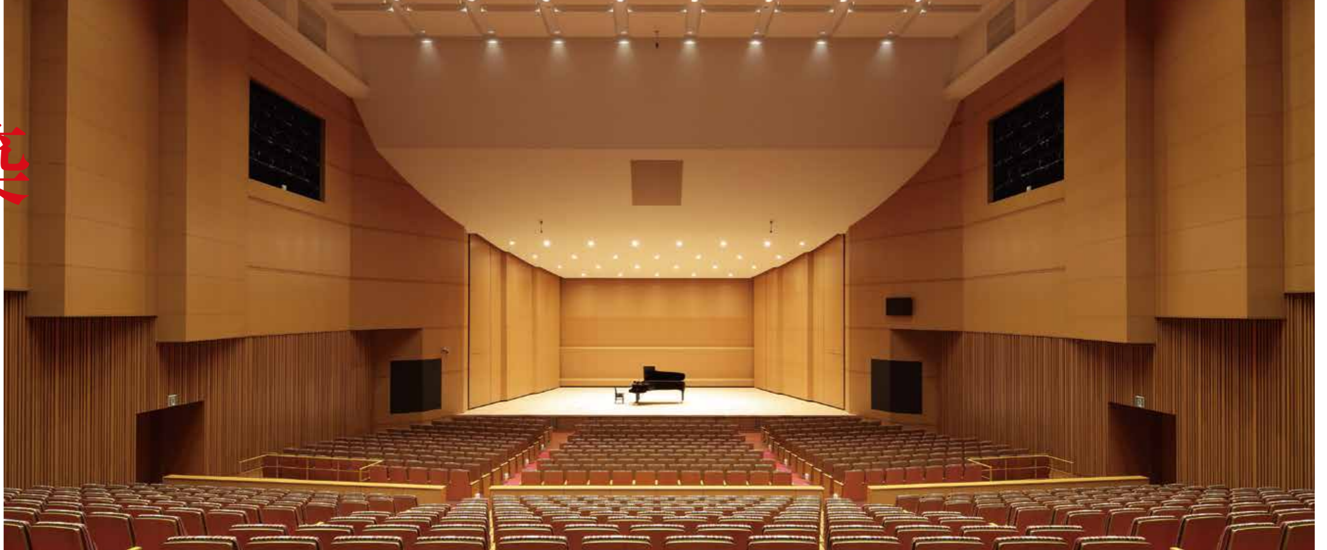
損斐川町地域交流センターはなもも(損斐川町)

「地域密着の文化創造」を新しいテーマに、 単なる器にとどまらない空間づくりを提案します。