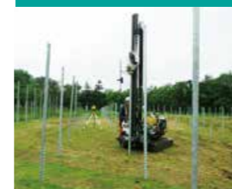
グランドスクリュー杭