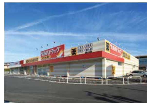
栗東開発事業(滋賀県栗東市)