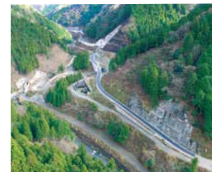
国土交通省 越美砂防 / 高地谷道路 (揖斐川町)