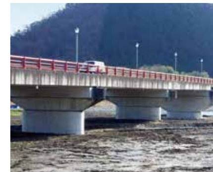
岐阜県 / 谷汲大橋 (揖斐川町)