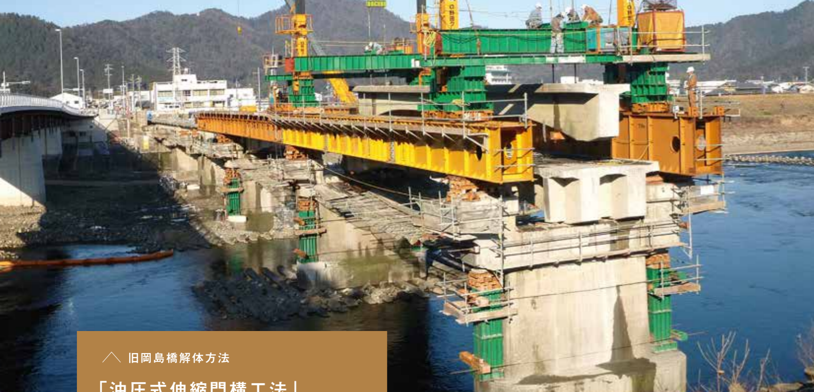
岐阜県／旧岡島橋解体 (揖斐川町)