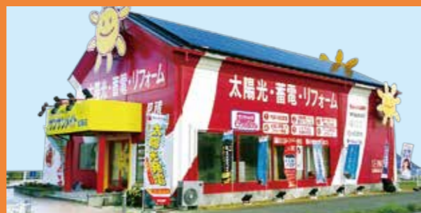
サンサンメイト松阪店