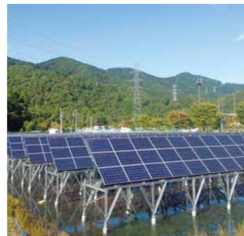
大野町運動公園/調整池(大野町)