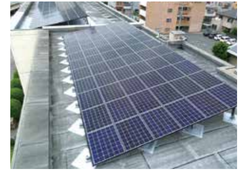
新栄小学校(愛知県名古屋市)