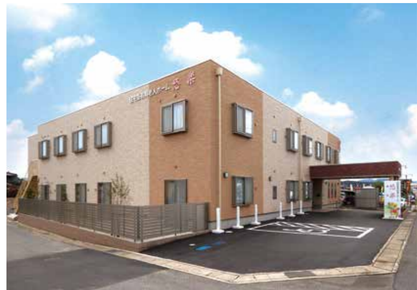
住宅型有料老人ホーム 悠楽 (可見市)