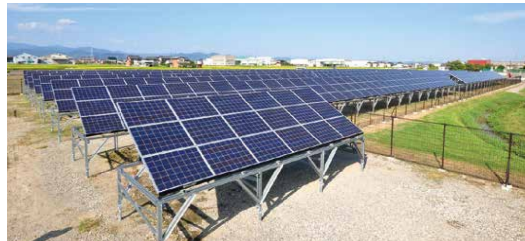
池田町浄化センター(池田町)