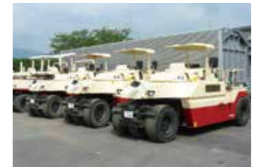
タイヤローラ(転圧する機械)