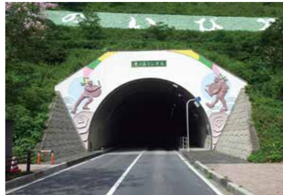
岐阜県／東ノ山トンネル (揖斐川町)