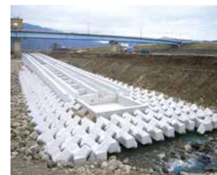
農林水産省 東海農政局 / 揖斐川岡島頭首工改良 (揖斐川町)