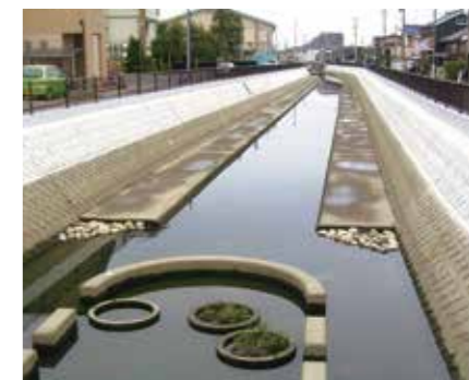
農林水産省 東海農政局 / 大江川改修 (愛知県一宮市)