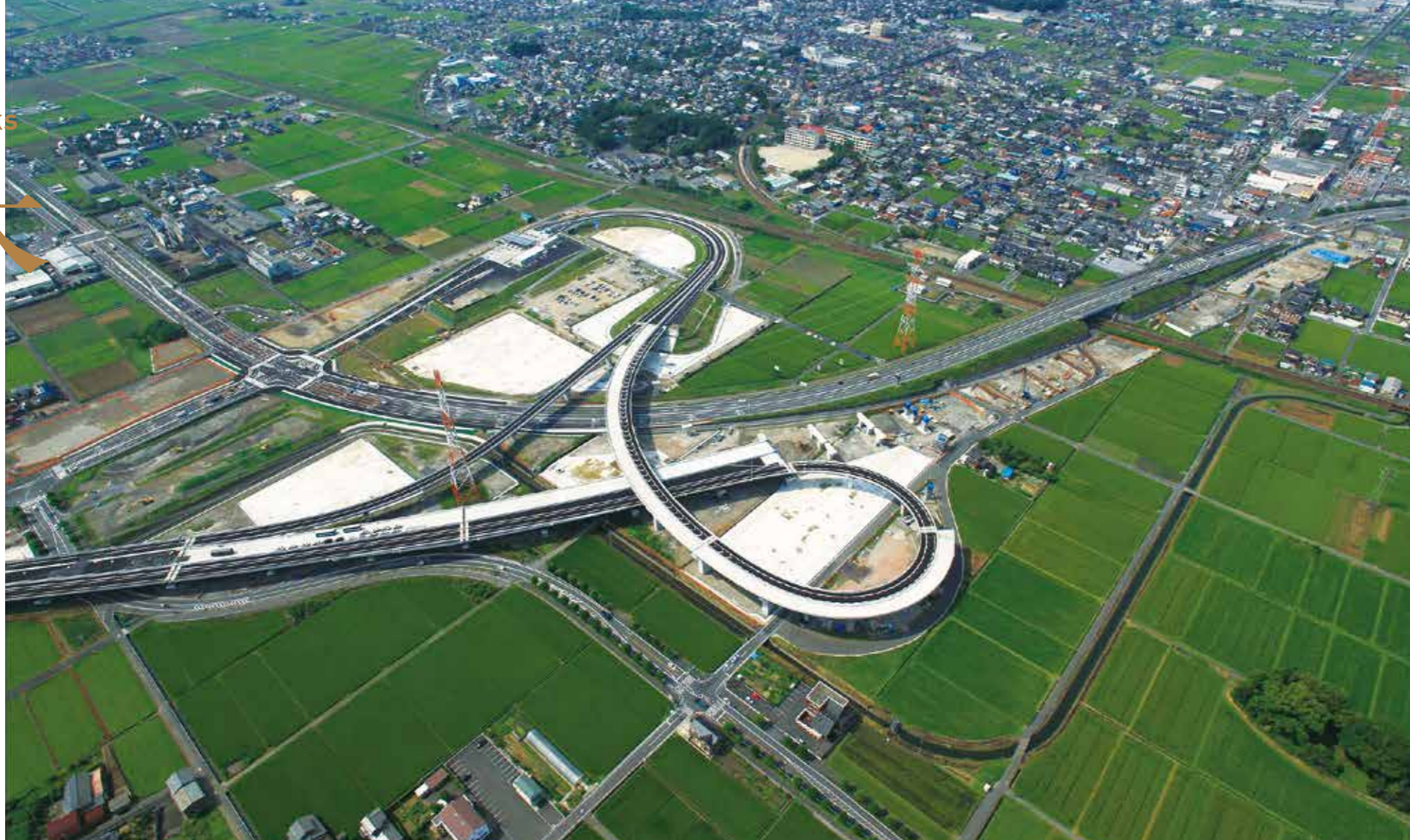
国土交通省 / 東海環状大垣西IC (大垣市)

土木事業は地域環境に影響を及ぼすスケールの大きな仕事のため、自然環境と人々の暮らしを大切に考えながら、確かな技術で地域・社会を守り続けて行きます。