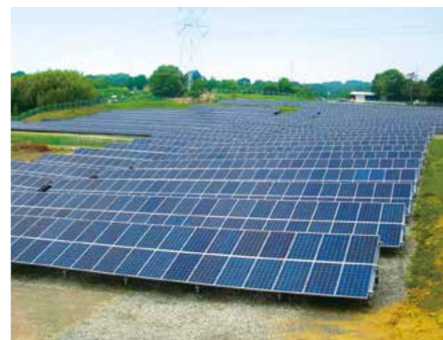
阿久比(愛知県知多郡阿久比町)