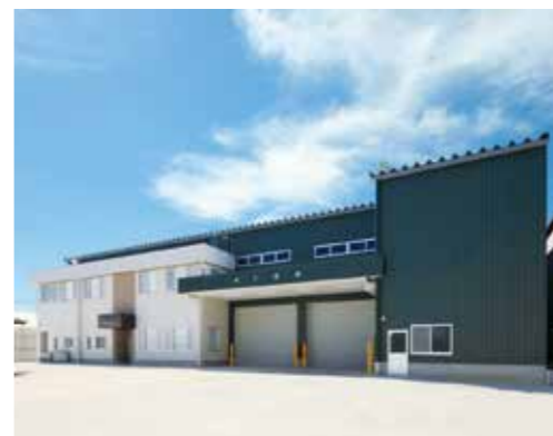
福江営農ライスセンター(海津市)