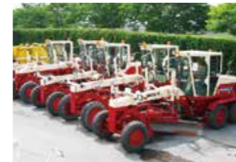
モーターグレーダー(砕石を敷均す機械)