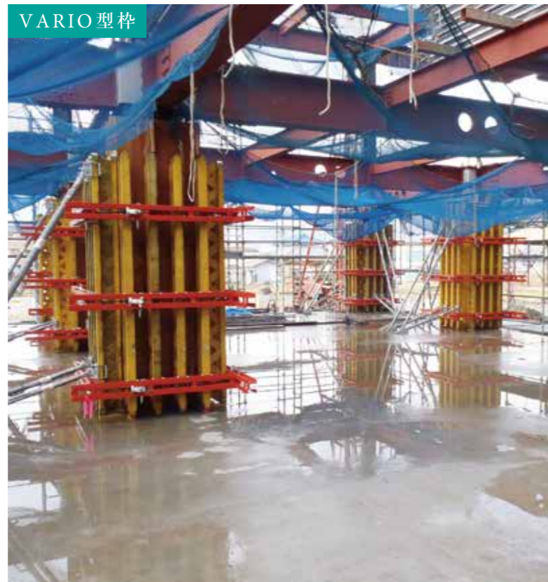
VARIO型枠 西濃建設(株)新社屋(揖斐川町)