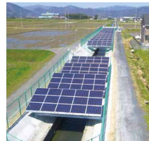
粕川一ノ井水土地改良区(池田町)