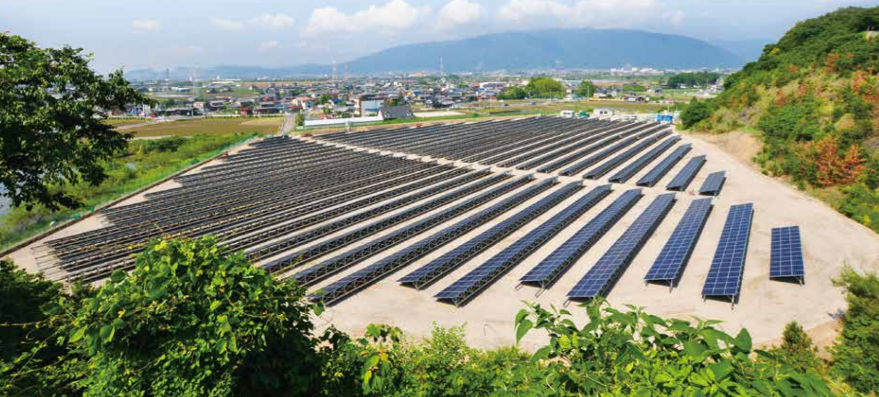
メガソーラーきよみず(揖斐川町)