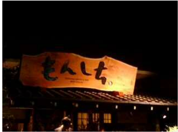
もんじち改装工事