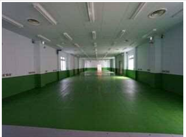
旭ダイヤモンド工業株式会社千葉鶴舞工場第3棟増築工事