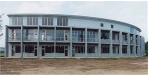
二宮福祉センター