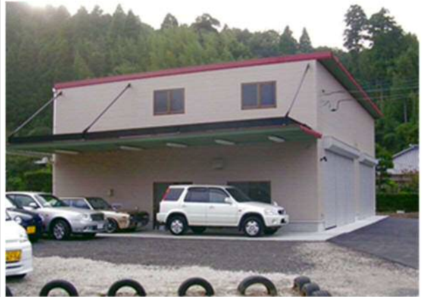
サンアイクカンパニー自動車修理工場新築工事