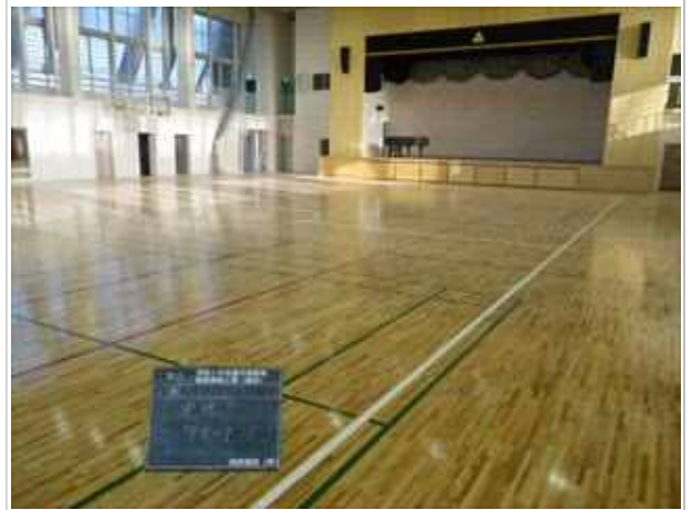
茂原小学校屋内運動場耐震補強工事