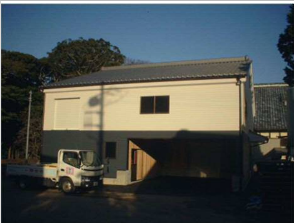
吉野酒造株式会社倉庫新築工事