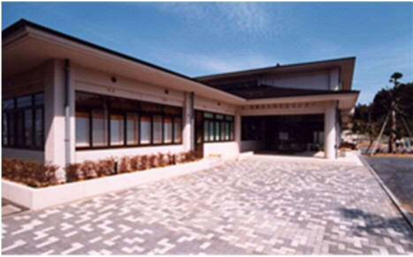
五郷福祉センター