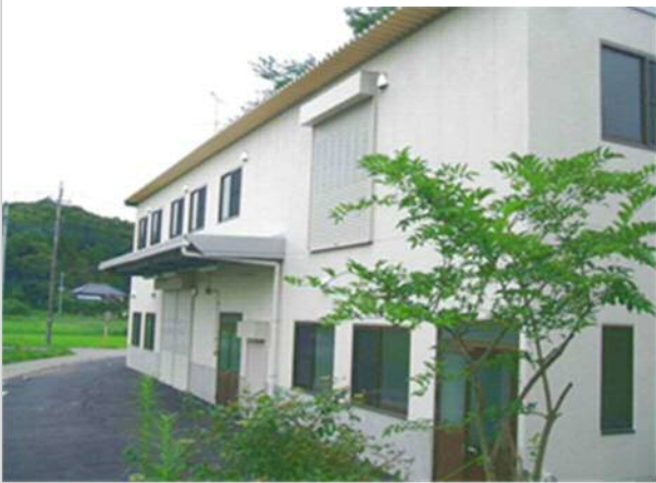
株式会社中興社製作所茂原工場新築工事