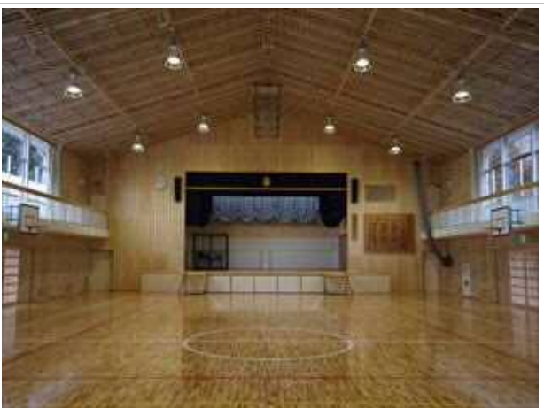
豊田小学校屋内運動場耐震補強工事