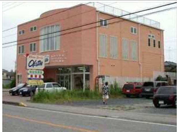
おくだ写真館新築工事