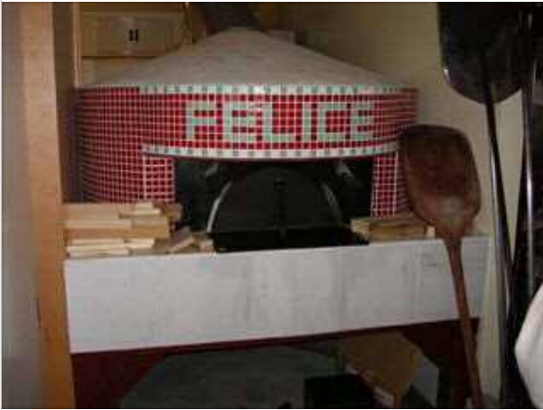
ピッツェリアフェリーチェ改装工事