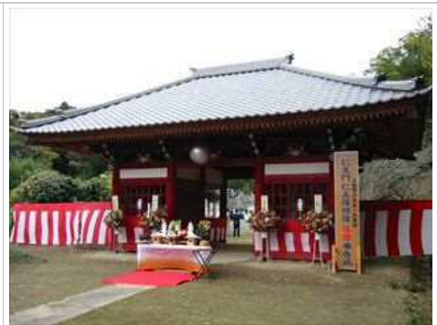
妙楽時仁王門大規模改修工事