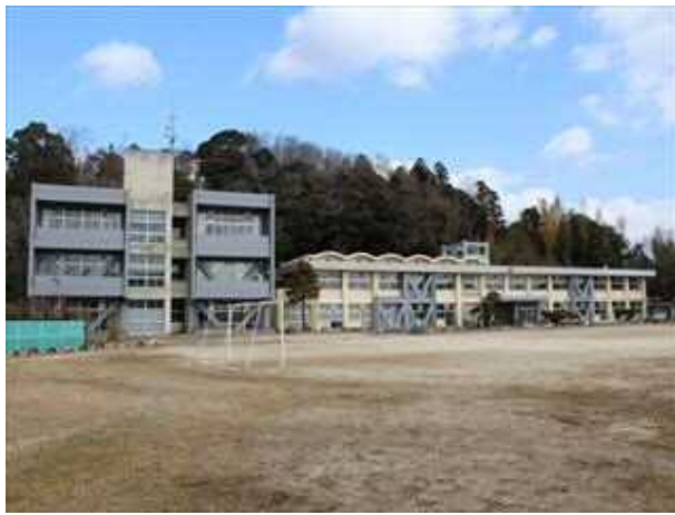
二宮小学校管理普通教室棟外 1 棟耐震補強工事