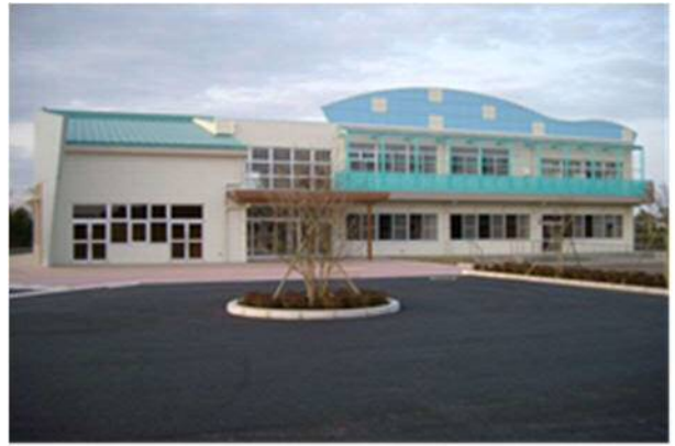
東郷福祉センター