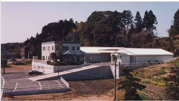
株式会社日総紙器印刷工業所新築工事