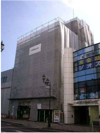
明陽ビル改修工事