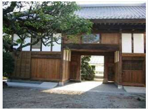
I邸長屋門改修工事