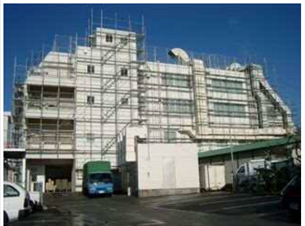
茂原エレクトロニクス大規模改修工事