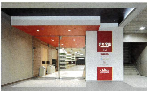
セルバ守山[ 地下施設整備事業 ]

収支計画、設計プランニング、建築、土木、造園、エクステリアまで一貫責任施工で推進します。