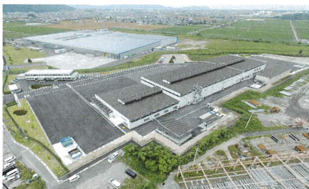
オリベスト能登川工場[ 新築工事 ]