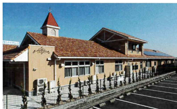
さくら坂南保育園[ 新築工事 ]