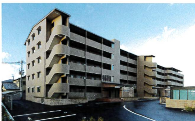
コテージ千秀[ 新築工事 ]