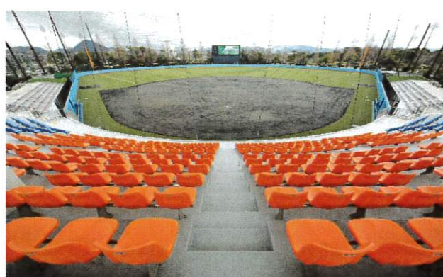
守山市民球場 管理棟[ 改修工事 ]