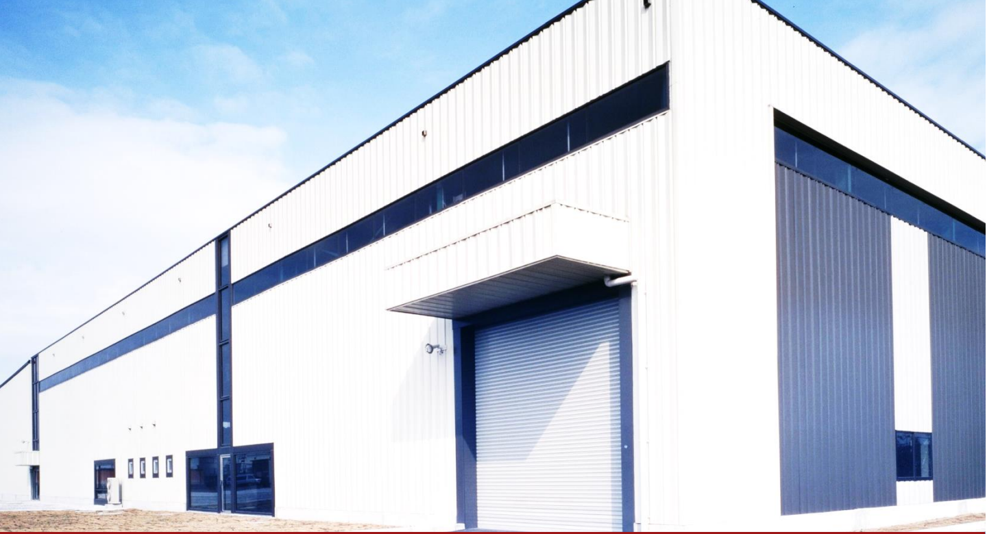
明星生コン工場 構造：鉄骨造平屋建て 建築場所：新潟県糸魚川市