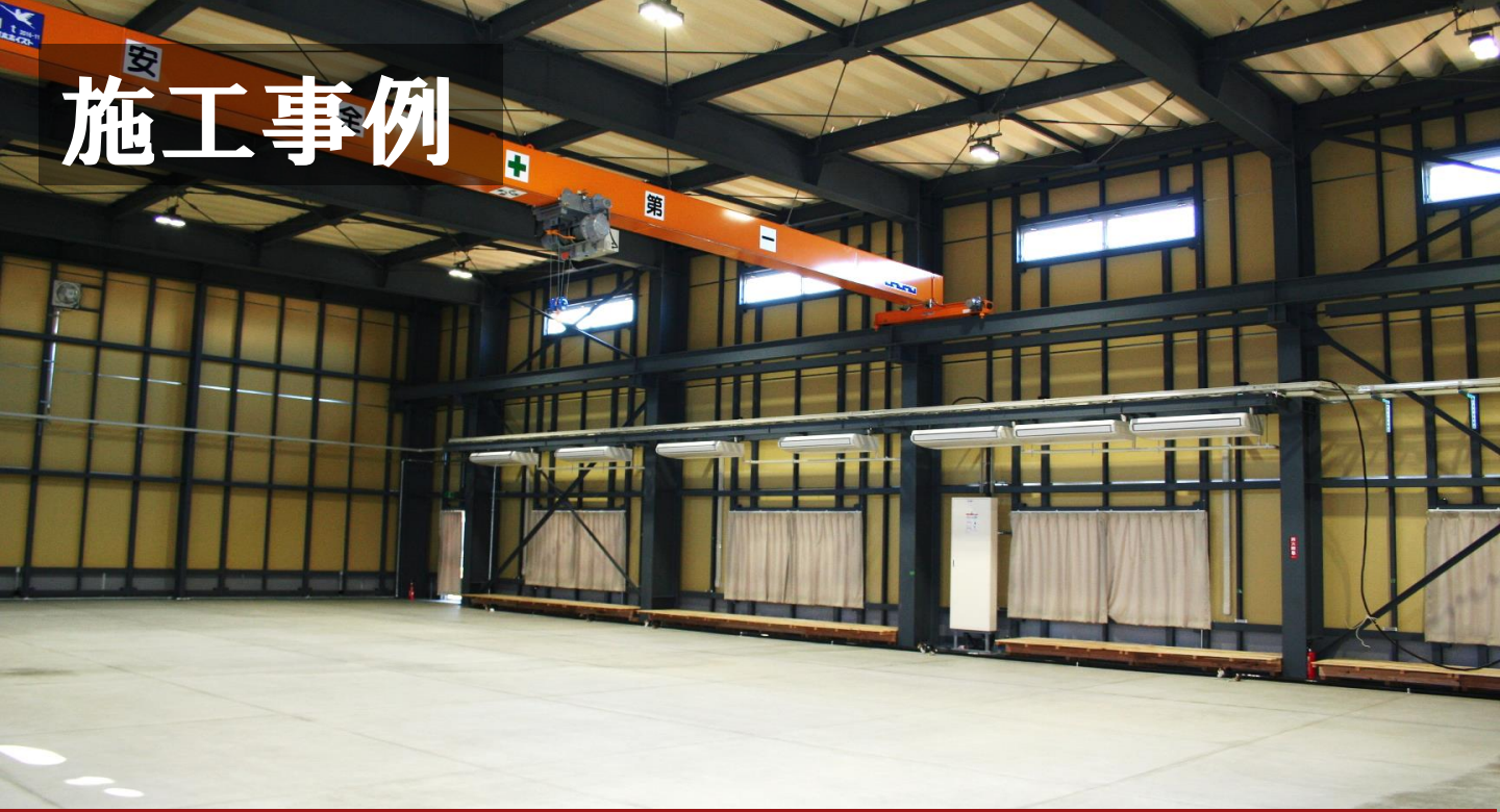
シンコーテック樹脂プレス工場 構造：鉄骨造平屋建て 建築場所：新潟県糸魚川市