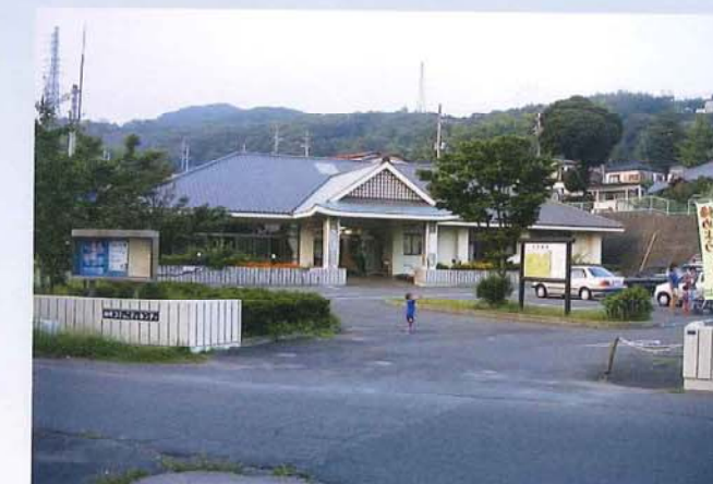
仲町コミュニティセンター建設工事 (日立市)