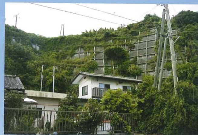
東町急傾斜地防災工事(茨城県)