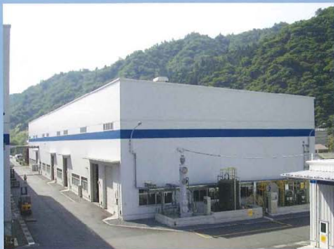
HMC工場第Ⅱ期工事(日鉱金属)