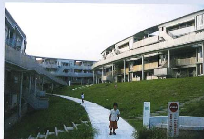
滑川アパート建設工事(茨城県)