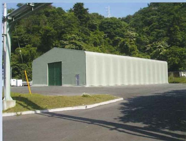
ジャパンエナジーテントハウス新設 (ジャパンエナジー)