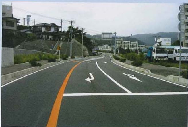
下桐木田高野線舗装整備工事(日立市)