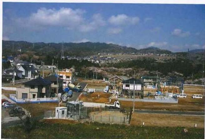
ヒルタウン桜ヶ丘宅地造成工事 (日鉱不動産)