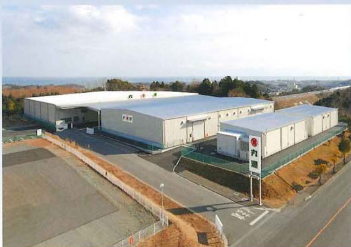
日立北倉庫新設工事(丸運)