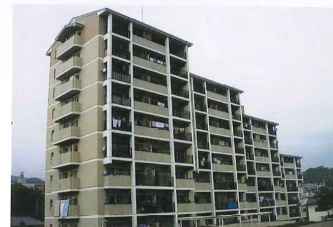
桐木田住宅建設工事(日立市)