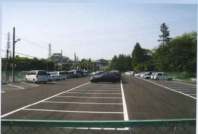
工場駐車場拡張工事(日鉱金属)