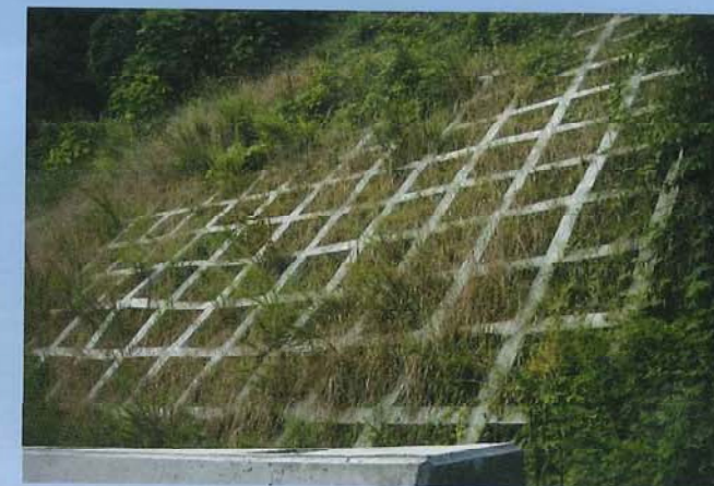
白銀急傾斜地(茨城県)