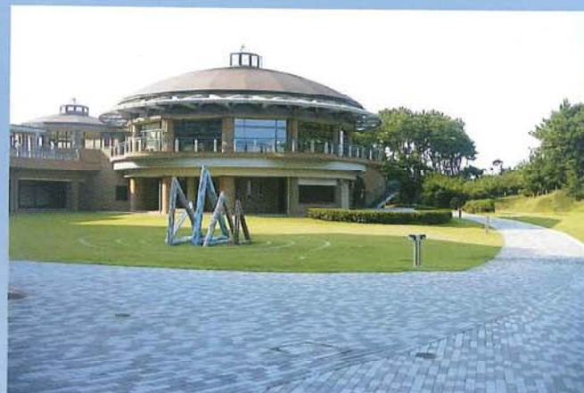
鵜の岬外構工事(茨城県立国民宿舎)