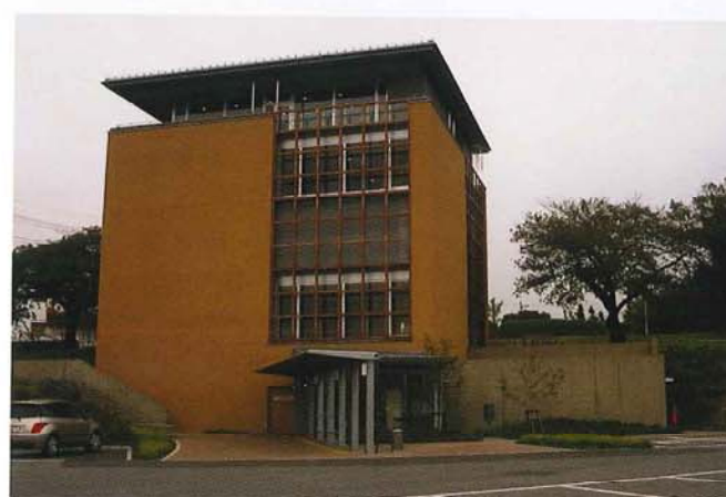
吉田正記念館建設事業建築工事(日立市)