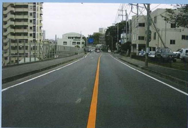
日立山方線道路改良工事(茨城県)