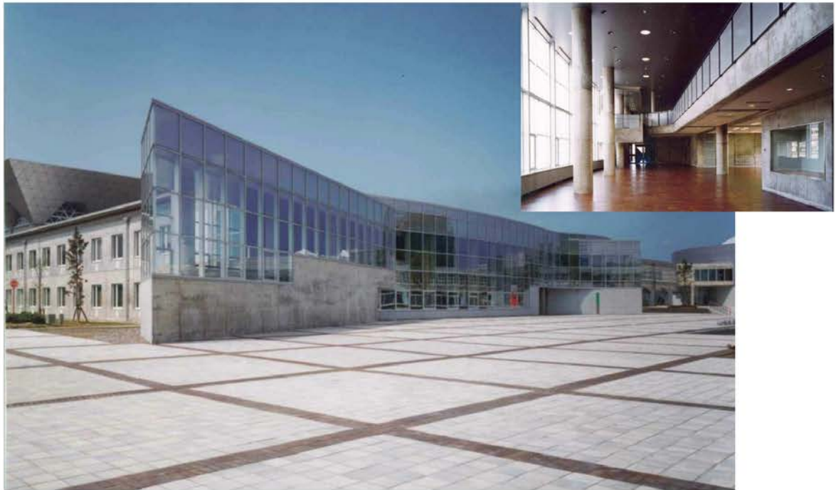
福井県立大学学生会館建築工事