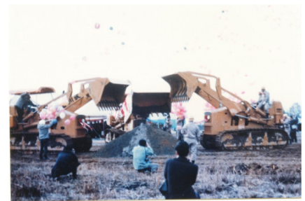
北陸自動車道着工