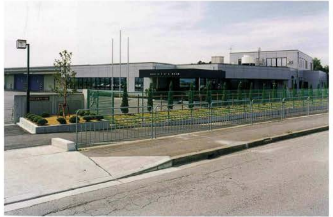
(株)にしばた 坂井工場