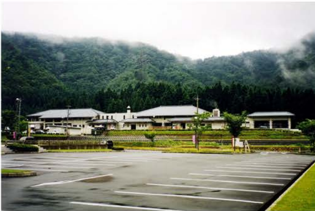
花はす温泉そまやま増築・改築工事