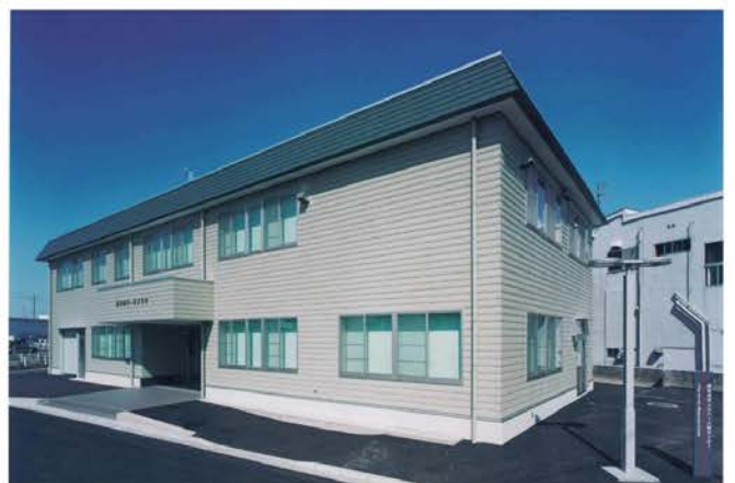
福井市ワークプラザ