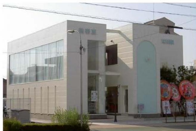
サッスーン美容室新築工事