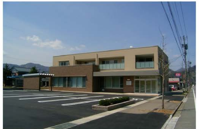
こせ整形外科新築工事