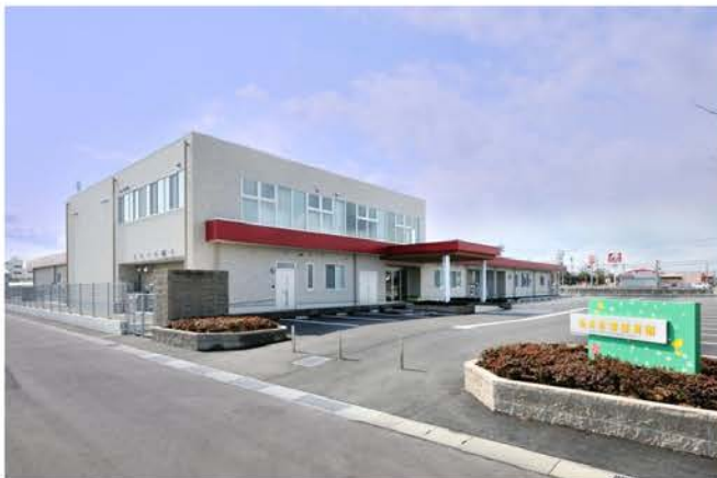
坂井松涛保育園新築工事