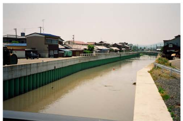
中小河川改修工事 底喰川