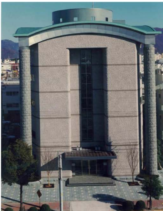
福井銀行福井中央支店新築工事