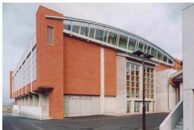
南条小学校屋内運動場他建設工事