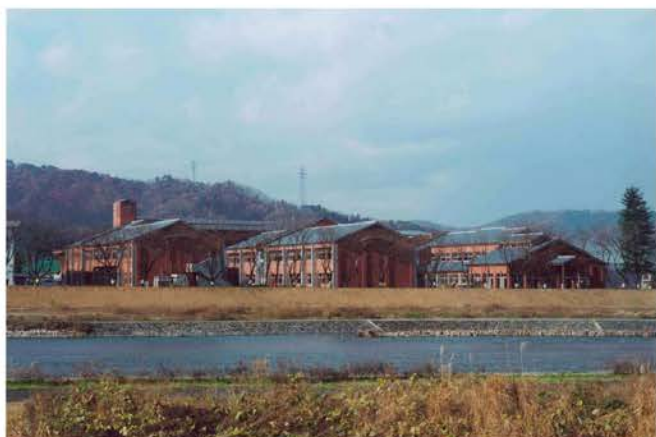
南条小学校校舎新築工事

学校をはじめとした教育施設の建築内容は、社会の変化や子供たちの意識の変化とともに、その内容も大きく変わってきています。とりわけ重要視されているのが、環境を考えた資材の利用や、耐震・対価などの安全性、そして毎日の学校生活を楽しく過ごすことができるような快適性です。特に日常頻繁に利用する場所においては、当社の長年の経験と実績によって培われたさまざまなノウハウが活かされています。