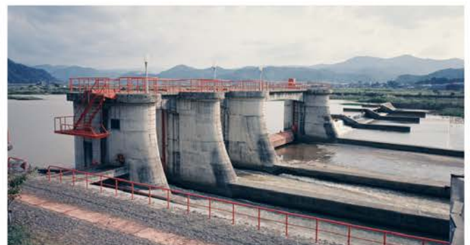
松ヶ鼻頭首工工事