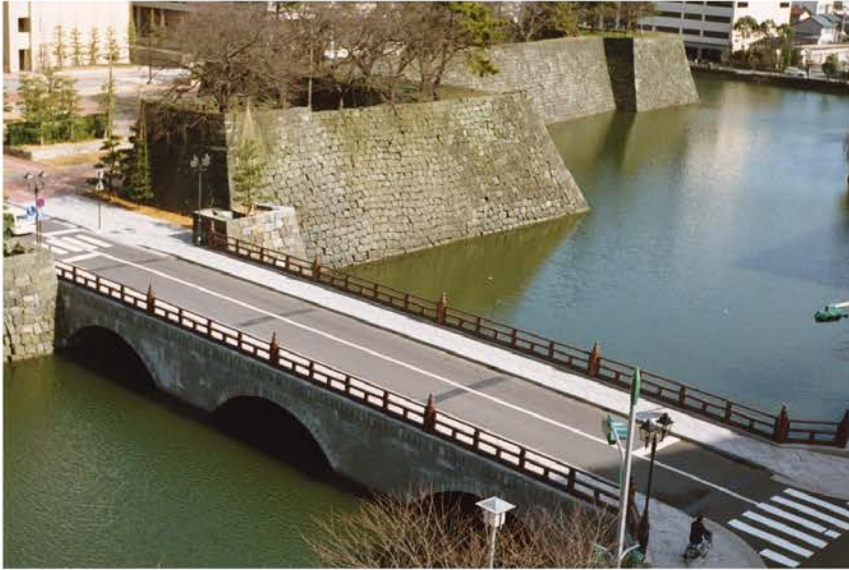
御本城橋架替工事（福井県庁）

海峡や航路を横断する渡海橋ばかりでなく、立体交差や高架橋など、陸上交通網の整備にとって橋梁の建設技術は不可欠なものとなっています。安全で経済的な設計・施工はもちろんのこと、最近では、わが国ならではの起伏に富んだ景観とも調和しながらも、地域の特性を生かしたグレードの高いデザイン性が求められています。