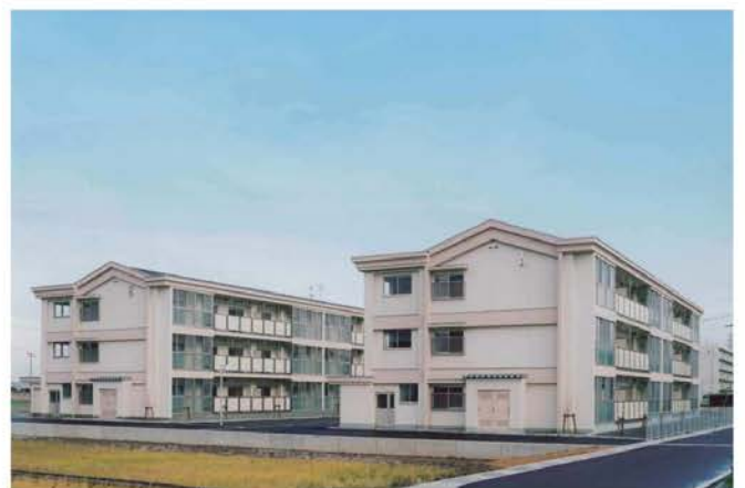
気比庄南団地 新築工事