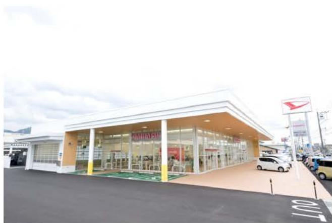
福井ダイハツ新浅水店新築工事

シンプルでありながらも、たくさんの人々の目を楽しませるようなデザインをコンセプトに…当社では、独創的なデザインはもちろんのこと、周辺環境の調和を最優先に考えた建築を基本にしています。特に商業施設の建築においては、デザインの良し悪しが、集客に影響することも少なくなく、十分なりサーチを行い、デザイン立案・設計・建築、そして、場合によってはプロデュースに至るまで総合的な視野に立ち提案し、建物と街づくりを目指しています。