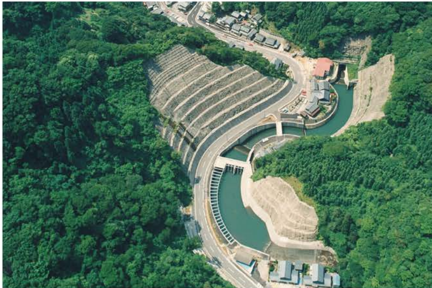
小規模河川水路トンネル改修道路改良合併工事

河川の水量確保や水害防止などを目的とした河川護岸工事は、さまざまな建設技術が必要とされる難易度の高い土木工事です。当社は、地盤改良技術や斜面安定技術、治水・利水技術、特殊杭打功法などの諸技術において、数々のダム建設で蓄積したノウハウを駆使し、質の高い工事を実施しています。また徹底した工事管理による合理化で安全性の高い作業体制も特色のひとつ。独自の技術と作業システムで、河川環境の整備を着実に進めています。