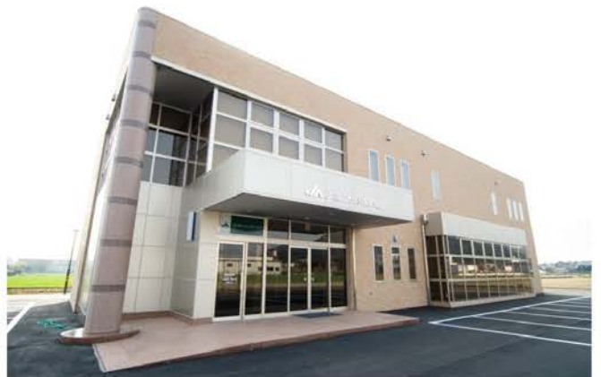
J A 越前たけふ東部支店