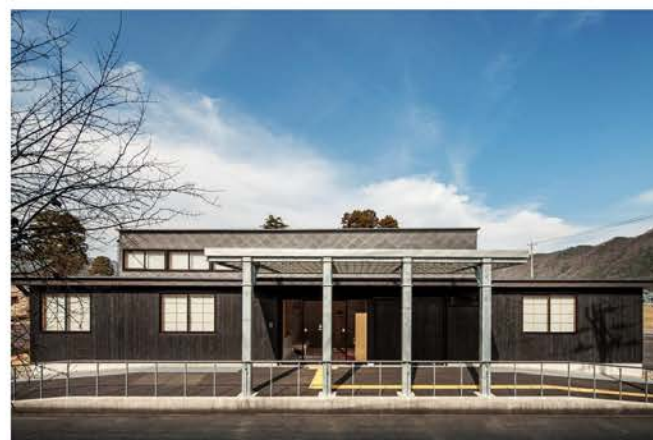
木漏れ日ハウス（デイサービス）新築工事