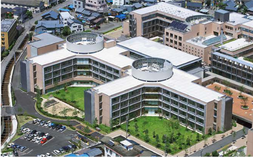
福井県立病院整備事業第二期建設工事(全体)

医療技術の目覚ましい発達や高齢化社会の到来は、施設そのものに大きな変革をもたらしつつあります。当社では、施設の企画段階からプランとして加わり、医師や関係者らのニーズを充分把握した上で、利用者の立場に立った施設計画を検討。将来の設備更新や、設備管理システムの変化に柔軟に対応できる体制を整えるなど、高度な専門性と技術力を要求される医療施設や福祉施設の建築に対して、万全の施工プランを臨んでいます。