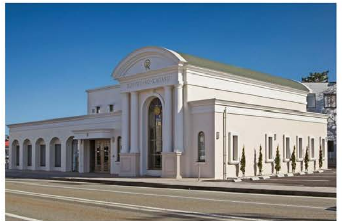
幸福の科学福井支部精舎新築工事