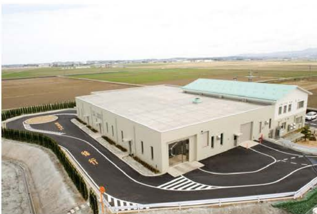
坂井汚泥センター