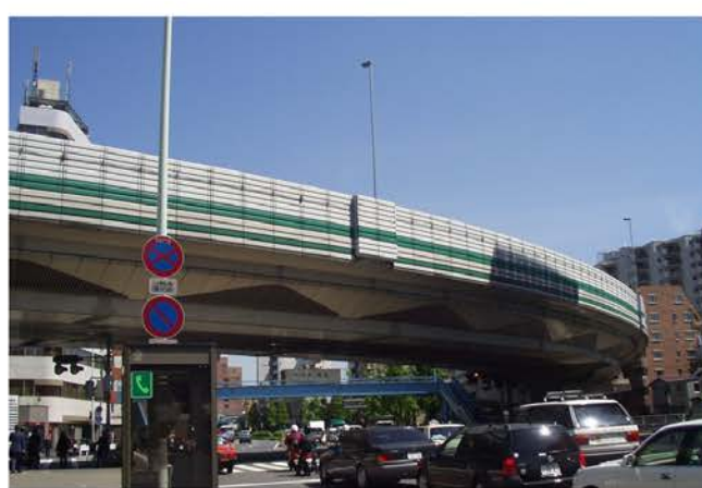
首都高速道路 遮音壁落下防止工事