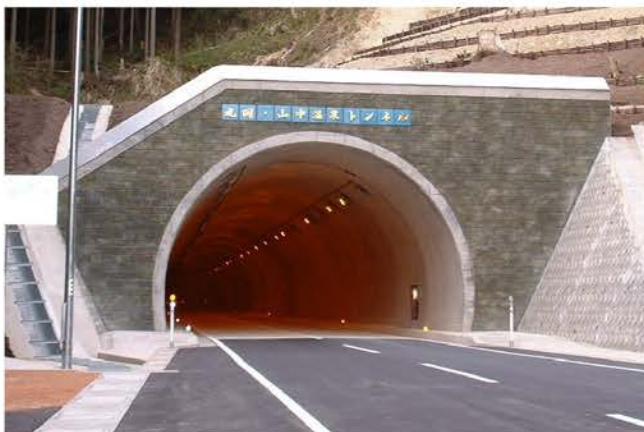
新大内トンネル工事