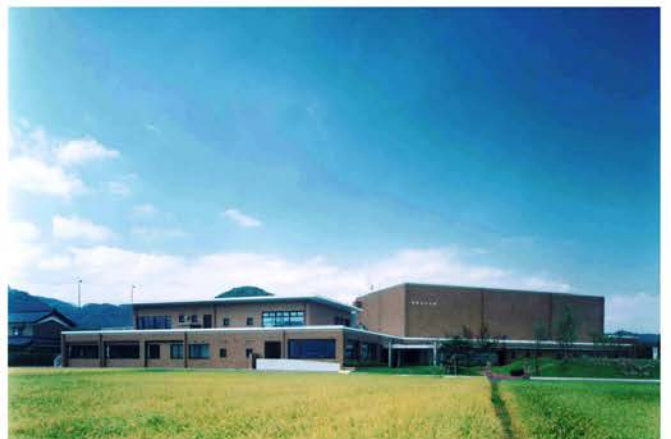
南越前町南条文化会館新築工事