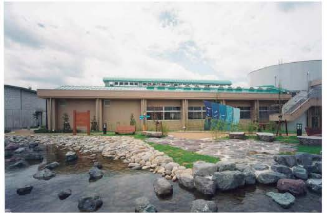
福井県内水面センター新築工事