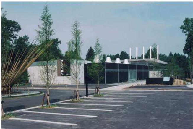
金津創作の森 整備事業センター施設建設工事

当社は、福井県など自治体の依頼により公共施設の建築を数多く担当してきました。コミュニティセンター、学校を始めとする教育施設など、質の高い施工技術を活かして建設された施設の数々は、地域住民にも親しまれ高い評価を得ています。これらの豊富な実績を基板に人々の多様なニーズに応えながら、未来に誇りうる共有財産としての建造物を目指し、より良い社会や文化の形成に役立っていきたく願っています。