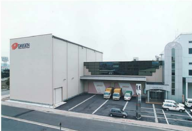
(株)ダイゲンコーポレーション