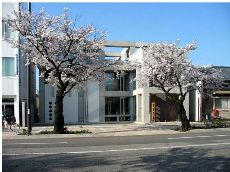
ジュエリースカラベ新築工事（福井市都市景観賞）

シンプルでありながらも、たくさんの人々の目を楽しませるようなデザインをコンセプトに…当社では、独創的なデザインはもちろんのこと、周辺環境の調和を最優先に考えた建築を基本にしています。特に商業施設の建築においては、デザインの良し悪しが、集客に影響することも少なくなく、十分なりサーチを行い、デザイン立案・設計・建築、そして、場合によってはプロデュースに至るまで総合的な視野に立ち提案し、建物と街づくりを目指しています。