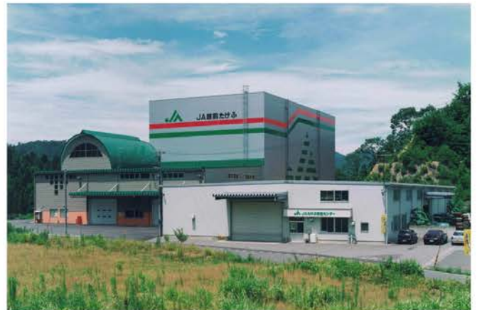
JA越前たけふ米品質向上物流化施設