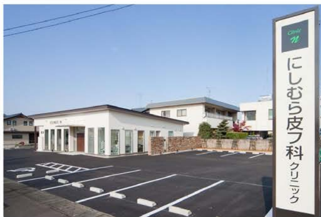
にしむら皮膚科クリニック