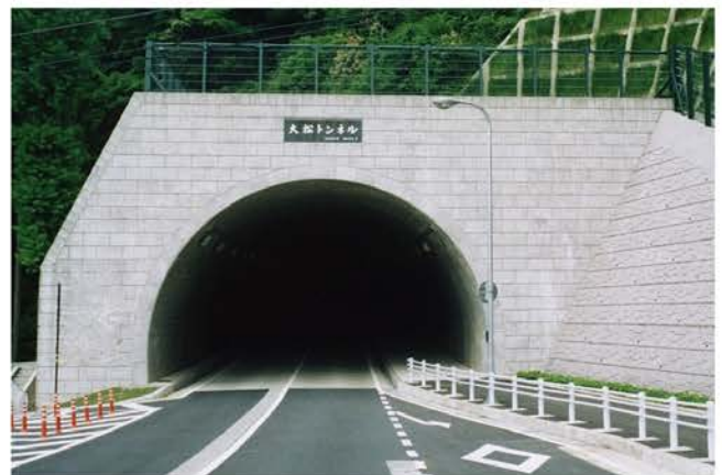
大松トンネル工事