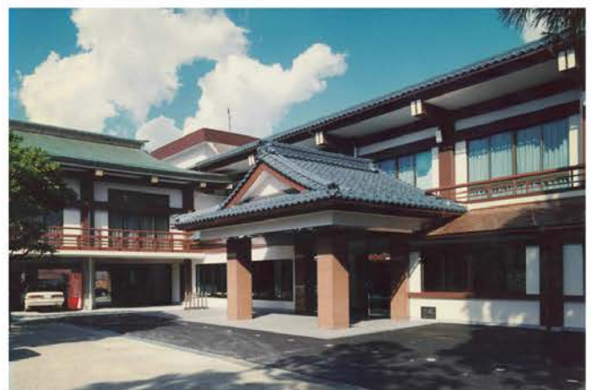
神明神社 儀式殿建築工事