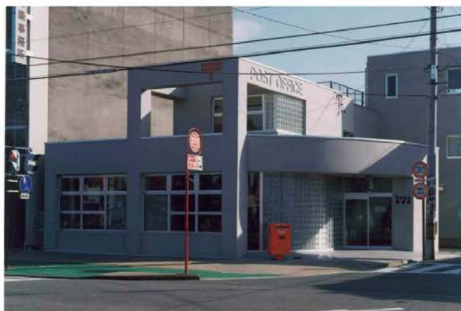
福井宝永郵便局新築工事