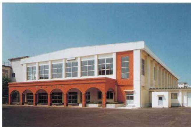
明道中学校体育館改築工事