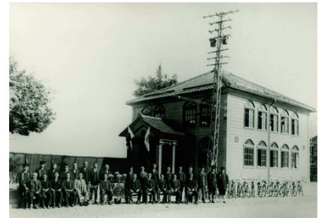
武生市郡役所新築工事