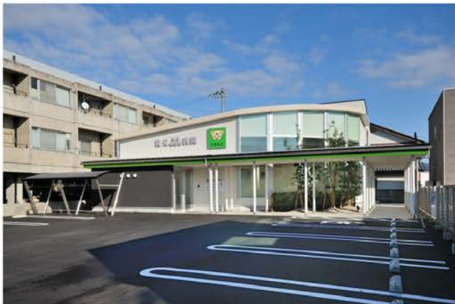
滝元耳鼻咽喉科医院新築工事

医療技術の目覚ましい発達や高齢化社会の到来は、施設そのものに大きな変革をもたらしつつあります。当社では、施設の企画段階からプランとして加わり、医師や関係者らのニーズを充分把握した上で、利用者の立場に立った施設計画を検討。将来の設備更新や、設備管理システムの変化に柔軟に対応できる体制を整えるなど、高度な専門性と技術力を要求される医療施設や福祉施設の建築に対して、万全の施工プランを臨んでいます。