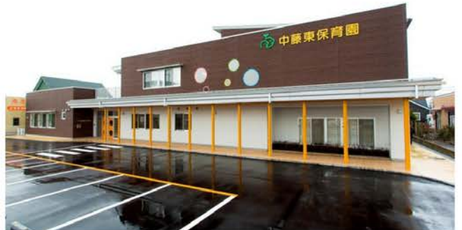
中藤東保育園新築工事