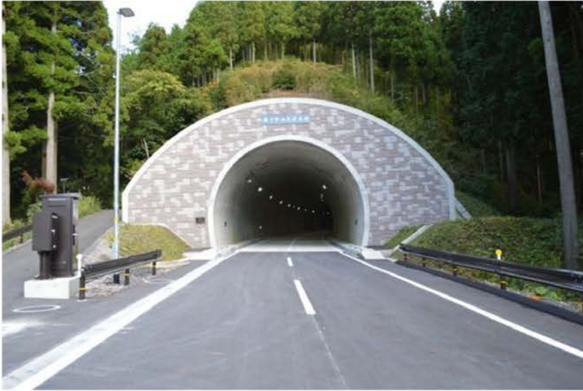
ホノケ山トンネル工事 河野工区

国土の自然形状を損なわないまま、増大する輸送需要にこたえるために、トンネル建設のニーズは高まりを見せています。