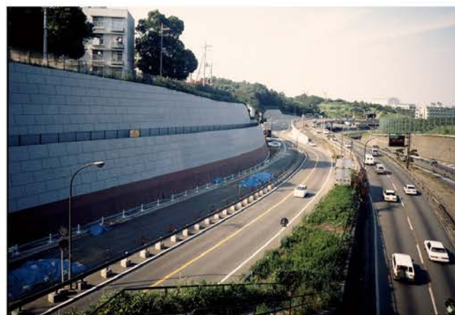
横浜新道常盤台工事