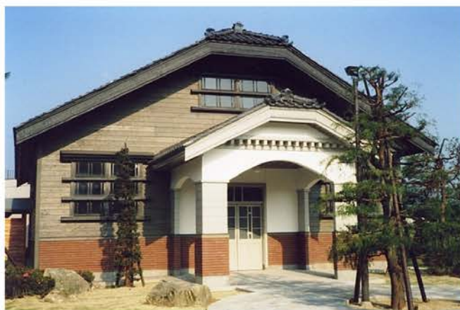
南条ふるさと資料館新築工事