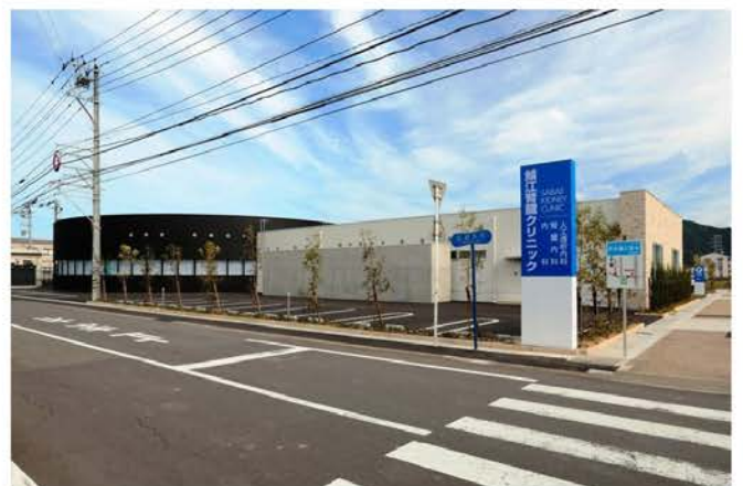
鯖江腎臓クリニック新築工事