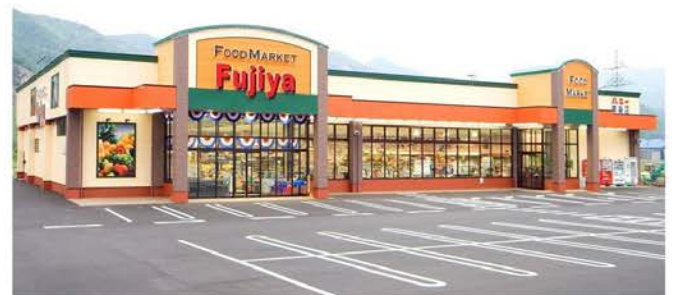
八二一南条店新築工事