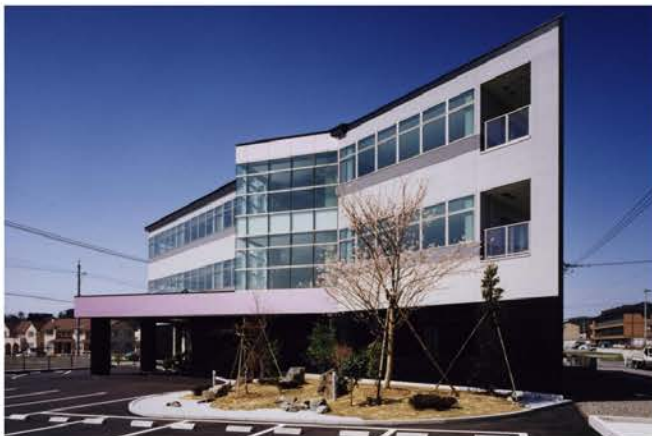
金沢エンジニアリングシステムズ(株)

会社の社屋や工場、倉庫の建設など、企業建設全般に関することも当社の得意分野です。この分野ではコスト対策もさることながら、日常の仕事をよりスピーディーに、より効率よく行うための、独創的な企画設計、レイアウトが求められています。当社では、まず現状の問題などを把握した上で、そこからお客様が求める姿をイメージし、デザイン設計をしています。数々の実績に基づいた当社独自のノウハウをベースに、高い品質を維持しながら、お客様のビジネスをサポートしています。