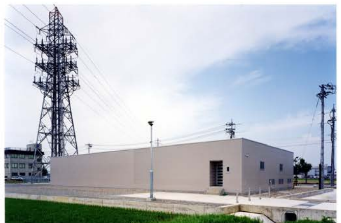
北陸電力 成和変電所