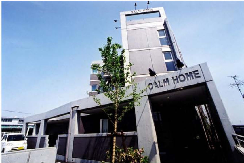
カームホーム (CALM HOME) 新築工事

低層の小型マンションから高層の大規模集合住宅まで、暮らしやすさを第一に考えた住宅建設。当社は、建築の分野でも、このように多彩な実績を築いてきました。高性能・高品質の技術を、企画・設計からアフターサービスにいたるまでトータルなシステムで提供することによって、施主の高い信頼を勝ち得ています。