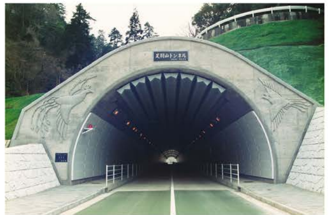
足羽山トンネル工事