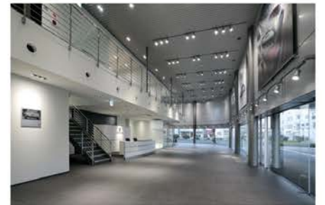
ポルシェセンター福井新築工事