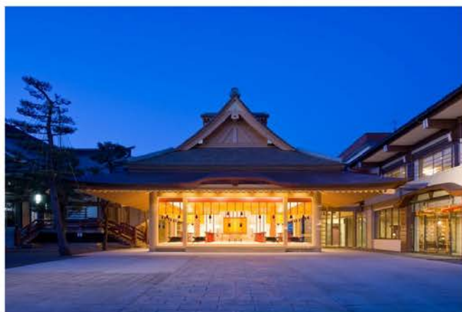
神明神社 神楽殿新築工事