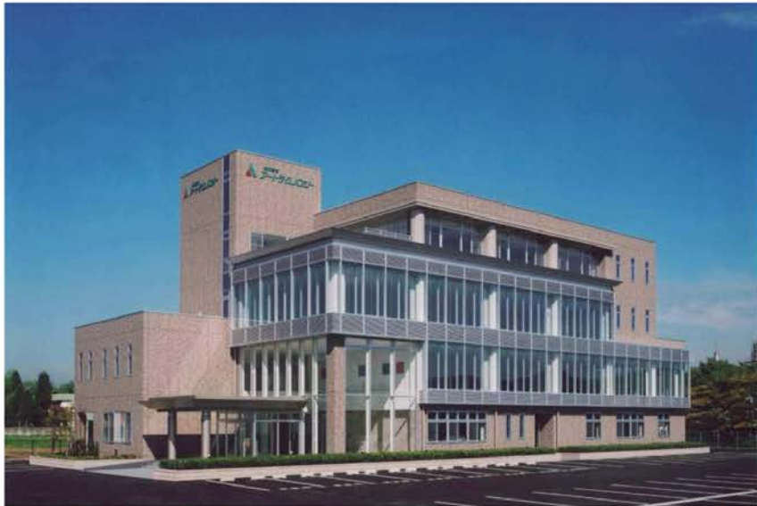
(株)アートテクノロジー

会社の社屋や工場、倉庫の建設など、企業建設全般に関することも当社の得意分野です。この分野ではコスト対策もさることながら、日常の仕事をよりスピーディーに、より効率よく行うための、独創的な企画設計、レイアウトが求められています。当社では、まず現状の問題などを把握した上で、そこからお客様が求める姿をイメージし、デザイン設計をしています。数々の実績に基づいた当社独自のノウハウをベースに、高い品質を維持しながら、お客様のビジネスをサポートしています。