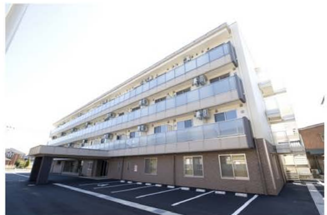
高齢者専用賃貸住宅江守きらめき 新築工事