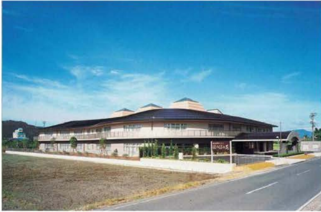
南条郡特別養護老人ホーム整備工事