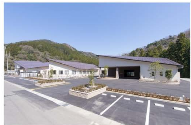
こうの（特養）新築工事