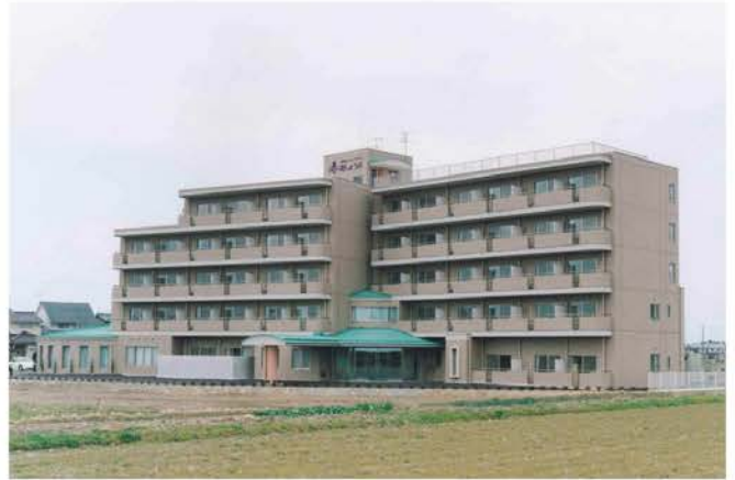
花しょうぶ（ケアハウス）新築工事