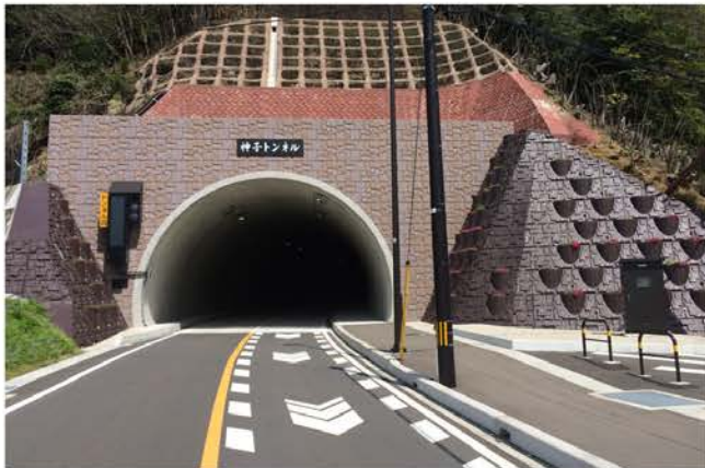
神子トンネル工事 小川工区

当社は、ダムや宅地造成・道路・河川護岸など、数々の建設工事によって培った土木技術のノウハウを、トンネル建設に活用。高度な技術を要するトンネル建設において多大の成果を上げると共に、輸送システムの高度化やネットワーク化を実現。地域の社会生活や産業の発展を推進しています。