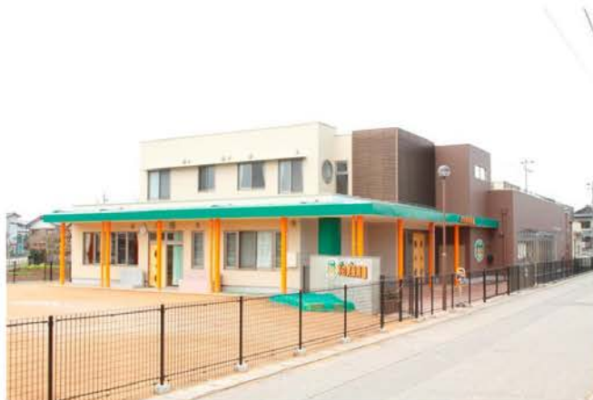
木の実保育園新築工事