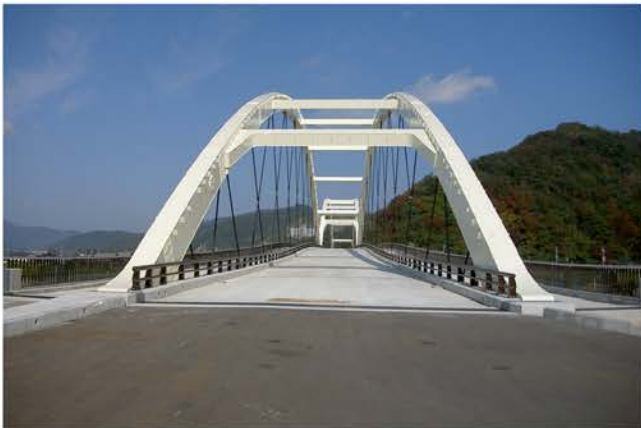
水鳥大橋建設工事

当社は、豊富な技術の集積をもとに、自然と調和する橋梁の建設工事を独自の施工で実現しています。