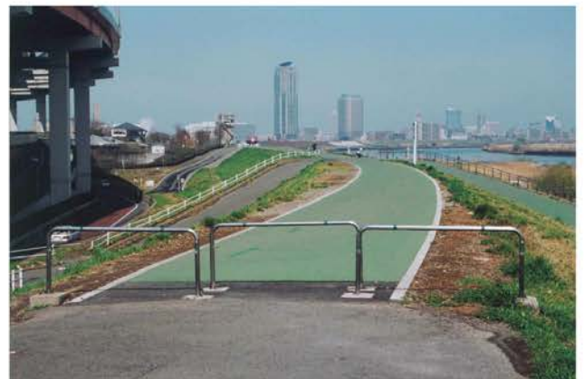
岩淵地区管内坂路整備工事 隅田川