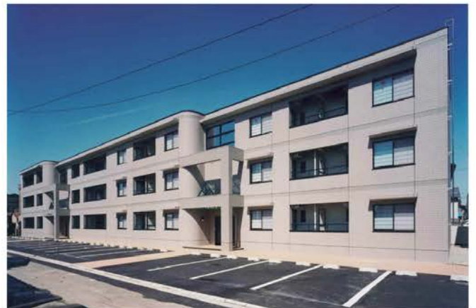
福井銀行宝永社宅 新築工事