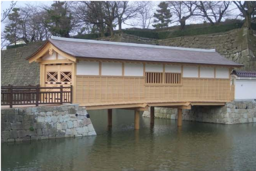
福井城御廊下橋 復元工事 (福井県知事賞受賞)

独自の構造に基づいて創られる社寺仏閣。そこには、選び抜いた材料だけを吟味して使い、ひとつひとつこだわって作業をしていく職人独自の世界があります。社寺仏閣の修理から復元、あるいは増改築に至るまで、文化財建造物を後世へ残していくために、当社では独自のプロジェクトチームで対応しています。伝統を守りつづけていく職人たちの熱い思いは、若い世代へと受け継がれて、それが当社の財産になっているのです。