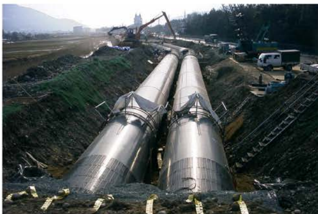
九頭竜川右岸幹線用水路工事