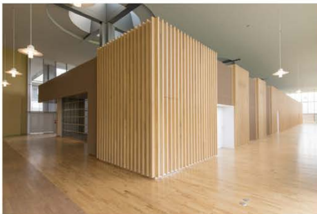
ふるさと文学館新築工事(福井県立図書館)