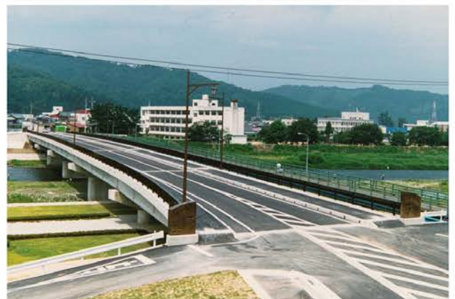
橋梁整備北山山橋（南条大橋）