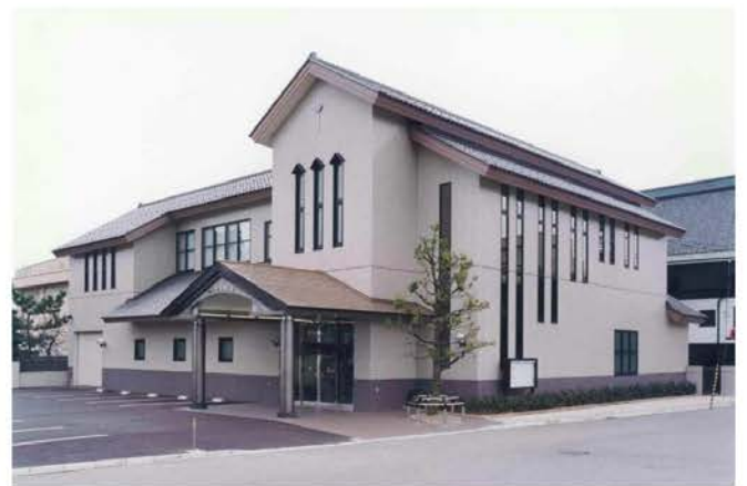
千福寺りんどうホール新築工事