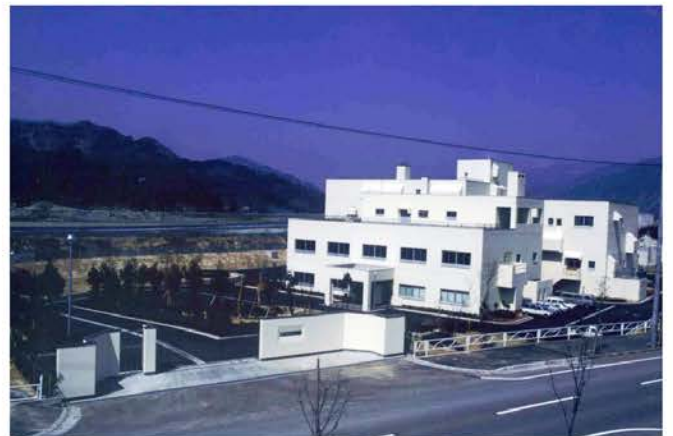
勝山浄化センター建設工事