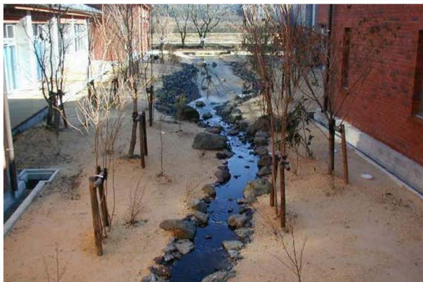
南条小学校ビオトープ建設工事

学校をはじめとした教育施設の建築内容は、社会の変化や子供たちの意識の変化とともに、その内容も大きく変わってきています。とりわけ重要視されているのが、環境を考えた資材の利用や、耐震・対価などの安全性、そして毎日の学校生活を楽しく過ごすことができるような快適性です。特に日常頻繁に利用する場所においては、当社の長年の経験と実績によって培われたさまざまなノウハウが活かされています。