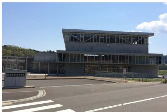
安居中学校新築工事