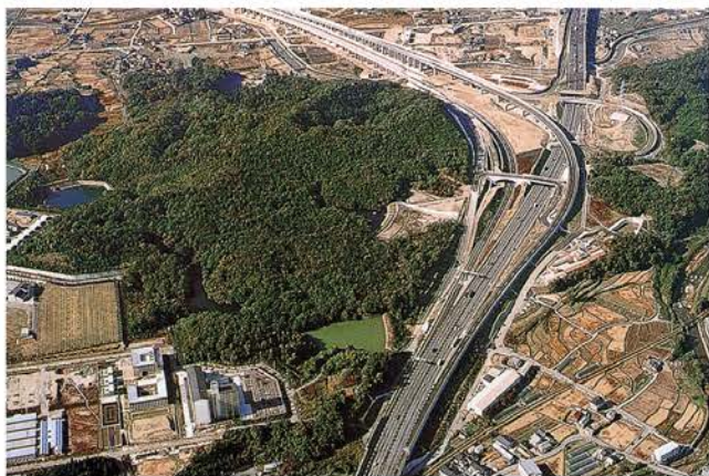
山陽自動車道 中高架橋西工事