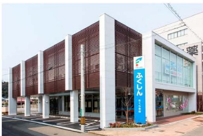
福井信用金庫さくら支店新築工事