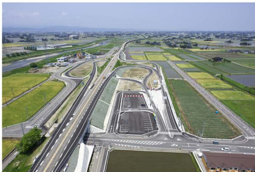
東海北陸自動車道 南砺スマートIC工事

経済の高度成長やモータリゼーションの進展と共に、わが国の道路網は発達してきました。さらに、道路整備の成長期といえる今、全国各地で次々に道路建設が行われています。当社は、その中でも有数のビックプロジェクトに参画し、自ら蓄積した建設技術をもとに多大な貢献を果たしています。時代の先端を行くレベルの高い施工技術は高く評価され、当社の信頼の一角を築いています。