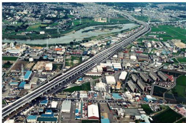
京滋バイパス 宇治西インターチェンジ工事

経済の高度成長やモータリゼーションの進展と共に、わが国の道路網は発達してきました。さらに、道路整備の成長期といえる今、全国各地で次々に道路建設が行われています。当社は、その中でも有数のビックプロジェクトに参画し、自ら蓄積した建設技術をもとに多大な貢献を果たしています。時代の先端を行くレベルの高い施工技術は高く評価され、当社の信頼の一角を築いています。