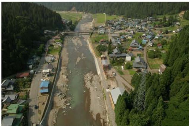
西天田地区護岸災害復旧工事 足羽川

河川の水量確保や水害防止などを目的とした河川護岸工事は、さまざまな建設技術が必要とされる難易度の高い土木工事です。当社は、地盤改良技術や斜面安定技術、治水・利水技術、特殊杭打功法などの諸技術において、数々のダム建設で蓄積したノウハウを駆使し、質の高い工事を実施しています。また徹底した工事管理による合理化で安全性の高い作業体制も特色のひとつ。独自の技術と作業システムで、河川環境の整備を着実に進めています。