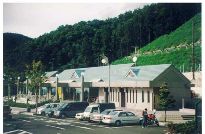
河野パーキング駅社新築工事