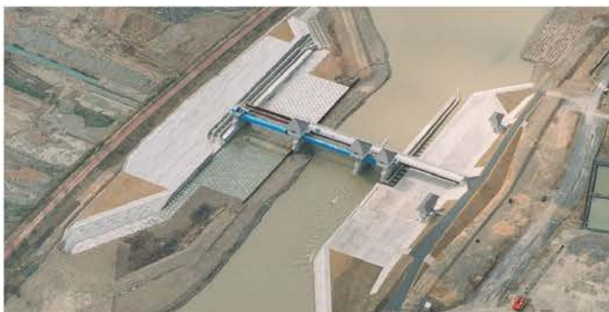
八乙女頭首工建設工事

環境を保全しながら水資源の確保や電力需要に応え、自然災害から暮らしを守るために、ダム建設のニーズはいま大きな注目を集めています。当社は、ロックフィルダム、アースダムなど、建設材料や構造の異なるさまざまなダムの建設において数々の実績を上げてきました。蓄積された技術力を基盤に、多角的な研究を重ね、工事の合理化を図る最新の材料・施工技術を柔軟に取り入れて、安全で経済的な工事を遂行しています。