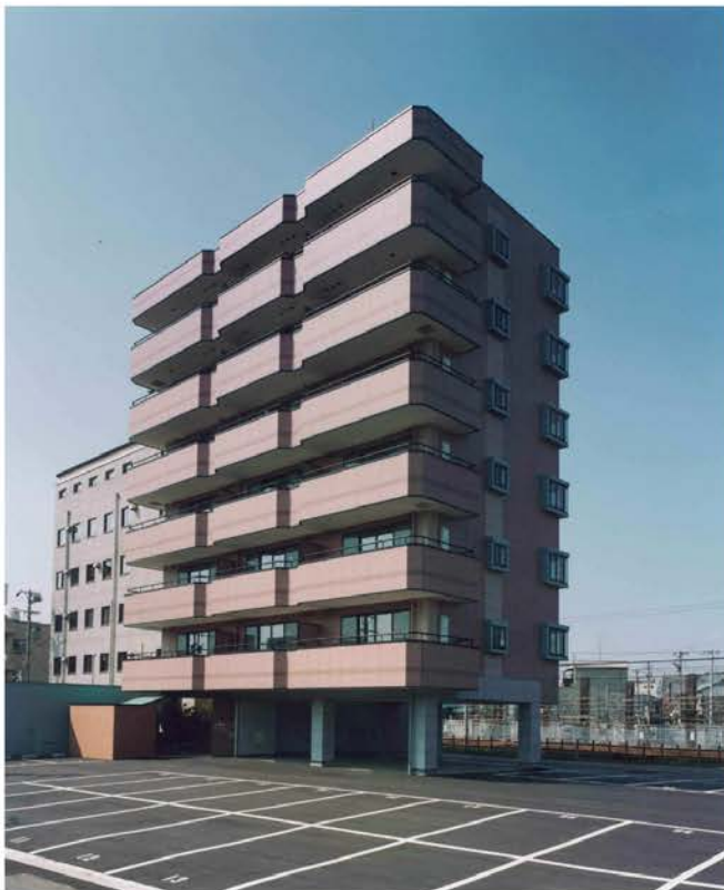
Hマンション新築工事

低層の小型マンションから高層の大規模集合住宅まで、暮らしやすさを第一に考えた住宅建設。当社は、建築の分野でも、このように多彩な実績を築いてきました。高性能・高品質の技術を、企画・設計からアフターサービスにいたるまでトータルなシステムで提供することによって、施主の高い信頼を勝ち得ています。