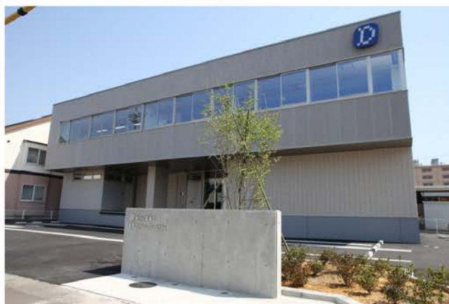
(株)電陽社福井営業所