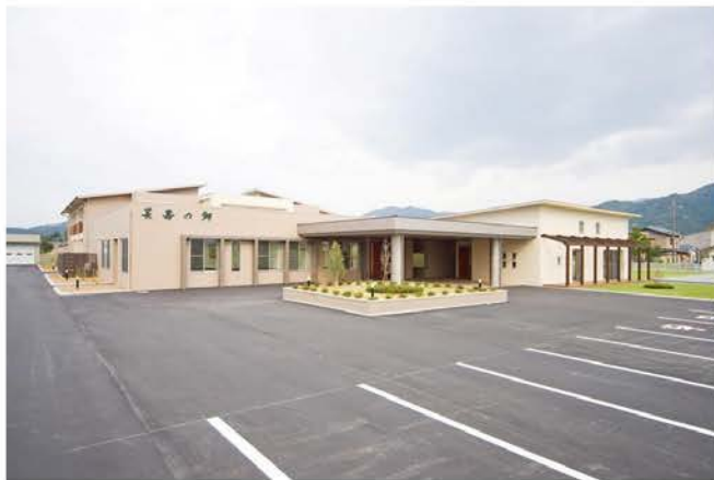
長寿の郷新築工事