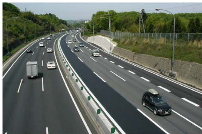
中国自動車道 山口地区登板車線設置工事