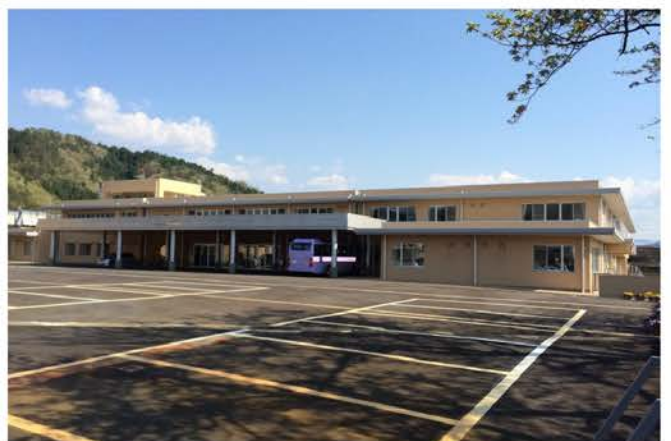
奥越地区特別支援学校建築工事