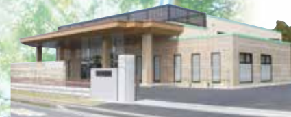
ナリコーセレモニー 富里ホール