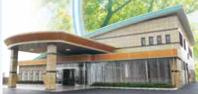
ナリコーセレモニー 香取ホール