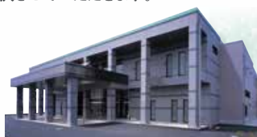
ナリコーセレモニー 寺台ホール

人生の旅立ちのとき、心からやすらぎと慈しみをもってサポートするナリコーセレモニーは、心あたまる大切な時間をお創りいたします。また、真心をこめたきめ細やかなサービスで、ご親族のみなさまのご要望に沿うセレモニーをご提案させていただきます。私どもは、セレモニーを通じて人と人との心のつながりを大切にし、皆様方におだやかな時間と空間をご提供させていただきます。