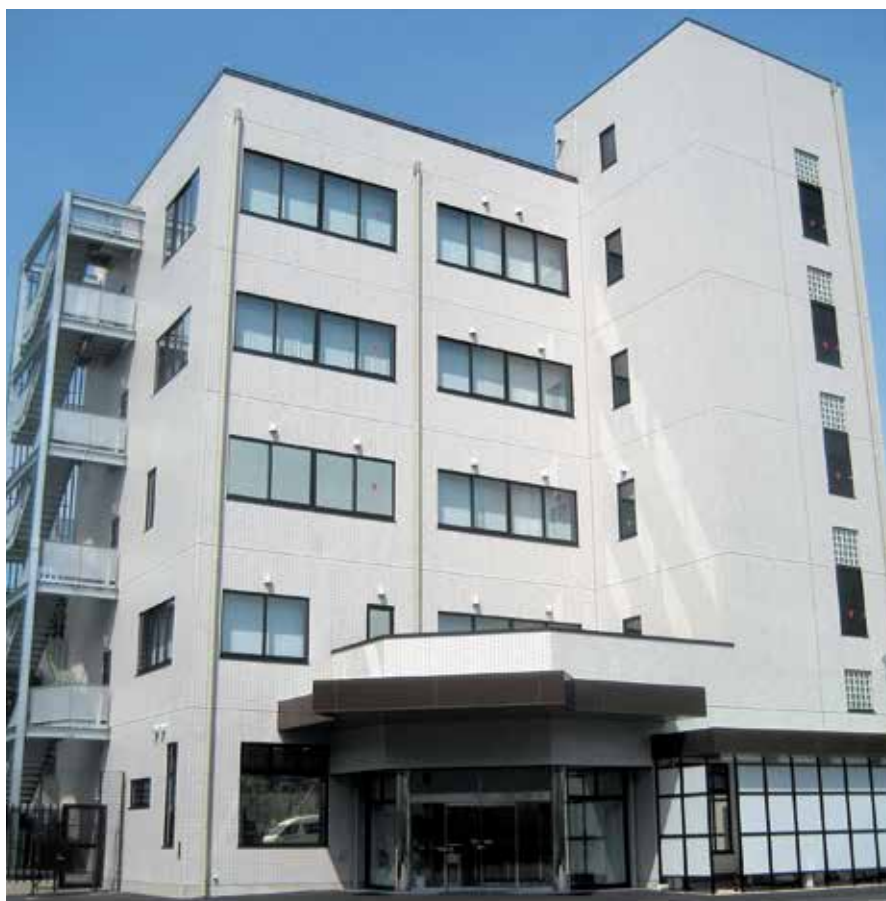
ナリコークリーンセンター事務所棟