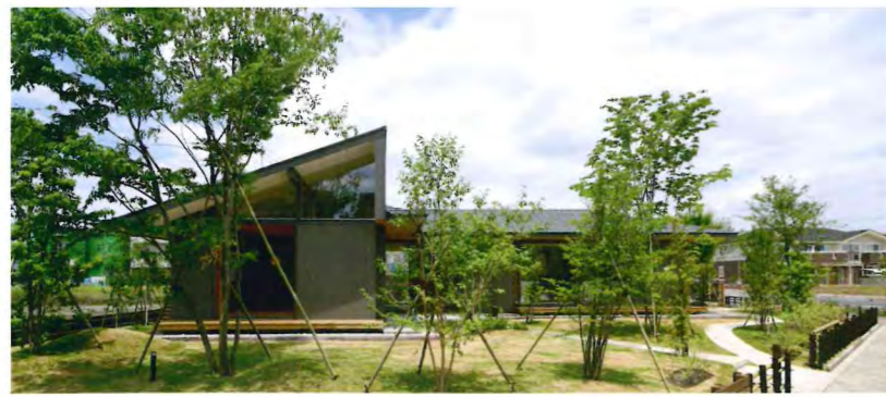
越谷レイクタウン営業所