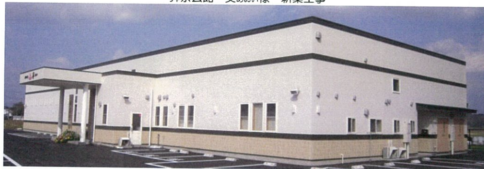
葬祭会館 葵あい様 新築工事