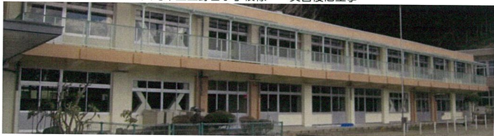
大崎市立上野目小学校様 災害復旧工事