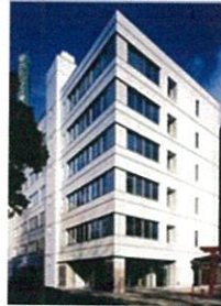
学校法人菅原学園 仙台ビジネス専門学校様 増築工事