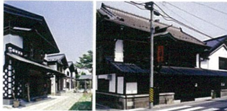
古川緒絶橋周辺商業施設整備建設工事 （醸室）