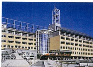
宮城県古川合同庁舎 新築工事