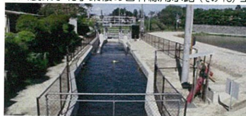
江合川農業水利事業桜の目幹線用水路（その13）工事