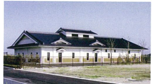
飯川地区農集排1号処理場 建設工事