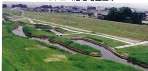
大崎市古川福沼地区工事