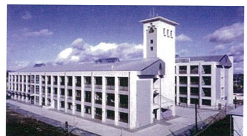
宮城県古川工業高等学校 総合実習棟改築工事