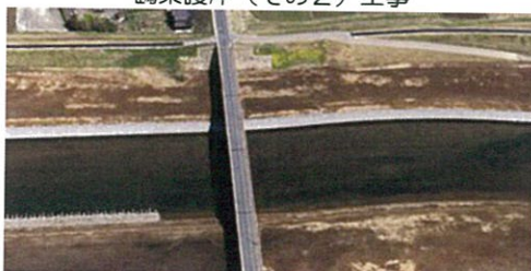
鶴巣護岸（その2）工事