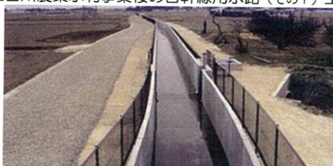
江合川農業水利事業桜の目幹線用水路（その7）工事