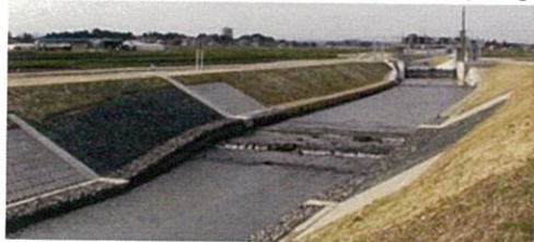
大崎西部農業水利事業渋井川改修（その7）工事