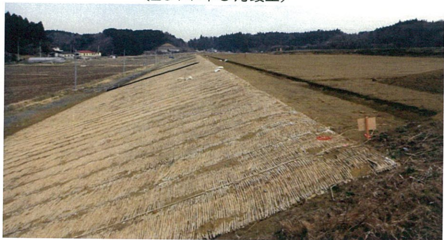
鳴瀬川多田川地区築堤工事