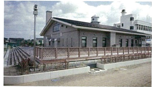
大崎市古川配水場建設工事