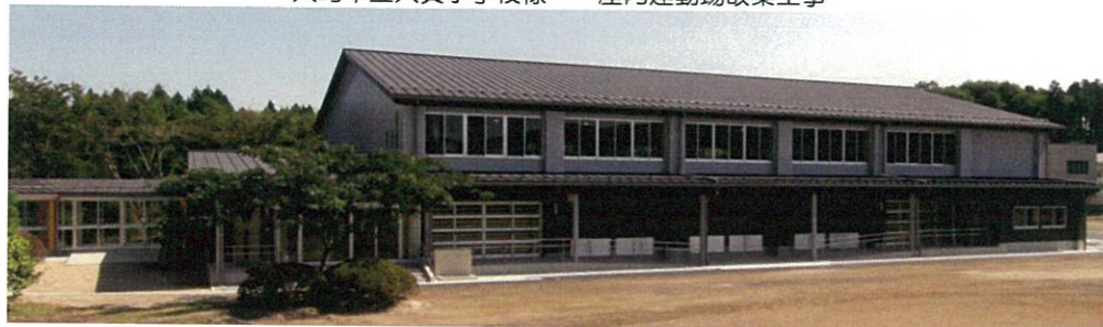
大崎市立大貫小学校様 屋内運動場改築工事