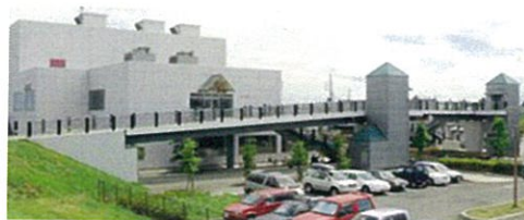
大崎市古川福沼土地改良整理事業 福沼2号歩道橋架設工事