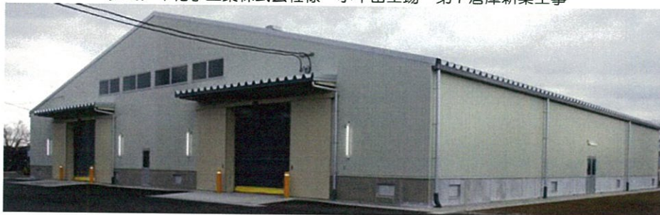
クミアイ化学工業株式会社様 小牛田工場 第7倉庫新築工事