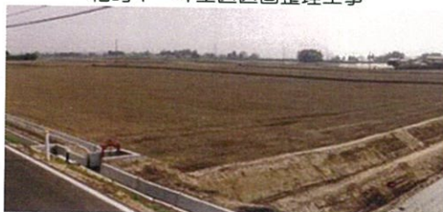
多田川左岸地区（担い手区画）－A52号 柏崎1－4工区区画整理工事