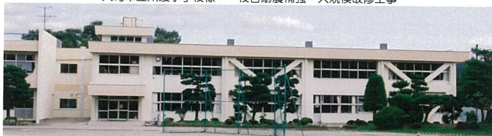
大崎市立川渡小学校様 校舎耐震補強・大規模改修工事