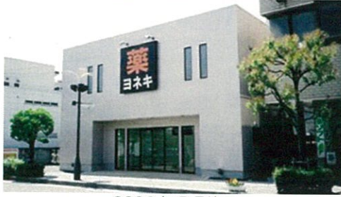
株式会社ヨネキ十字堂十日町店様 改築工事（設計・施工）