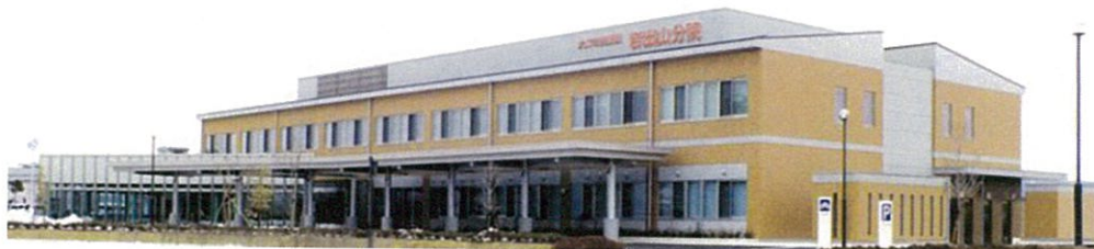
大崎市民病院岩出山分院建設事業（特定建設工事共同企業体）