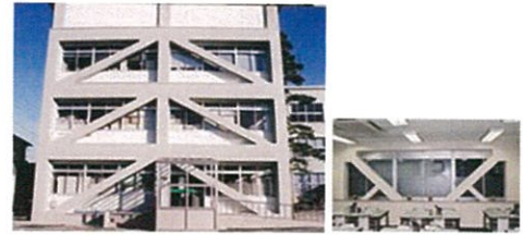
大崎市役所本庁舎耐震補強工事