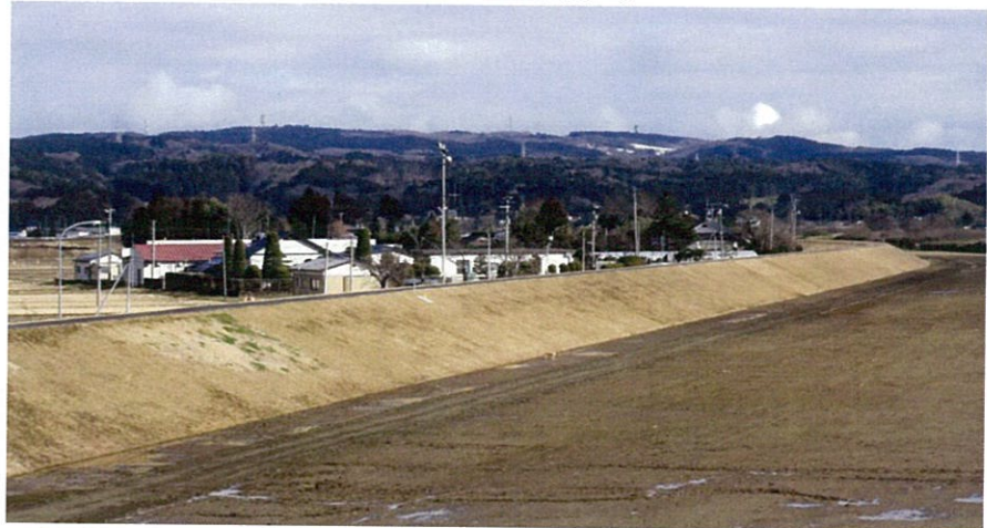
鳴瀬川砂山地区築堤工事