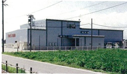
株式会社フルカワミート様 工場新築工事