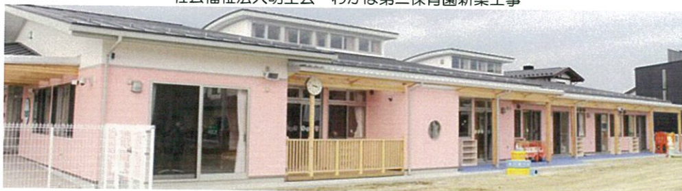
社会福祉法人明生会 わかば第二保育園新築工事