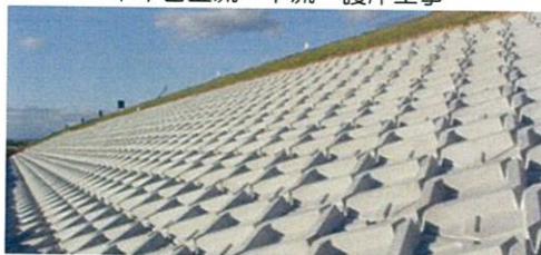
下中目上流・下流 護岸工事