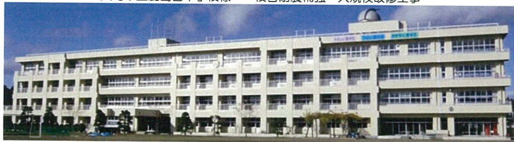
大崎市立鹿島台中学校様 校舎耐震補強・大規模改修工事