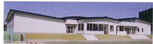
美里町立南郷幼稚園・保育所建築工事