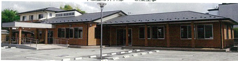
早坂整形外科様 新築工事